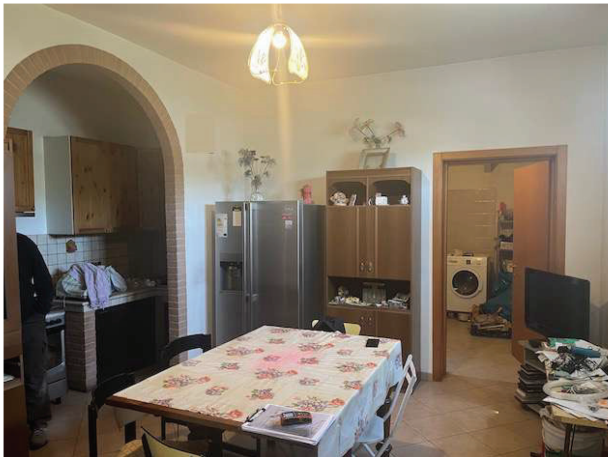
Zona pranzo con angolo cottura