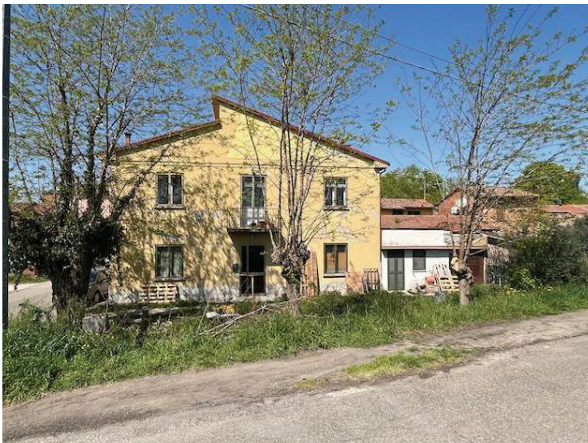
Il fronte principale dello stabile