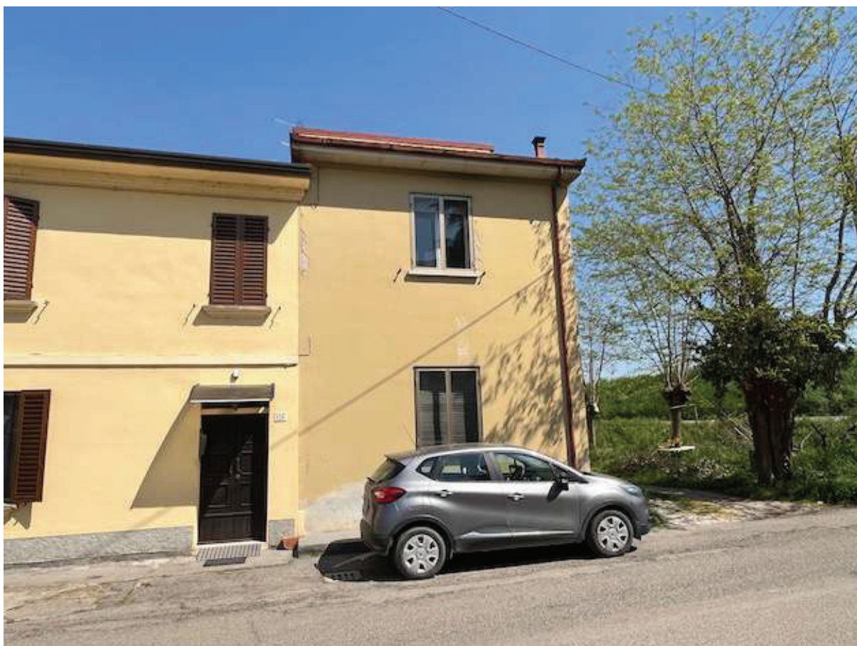
Il prospetto laterale dello stabile