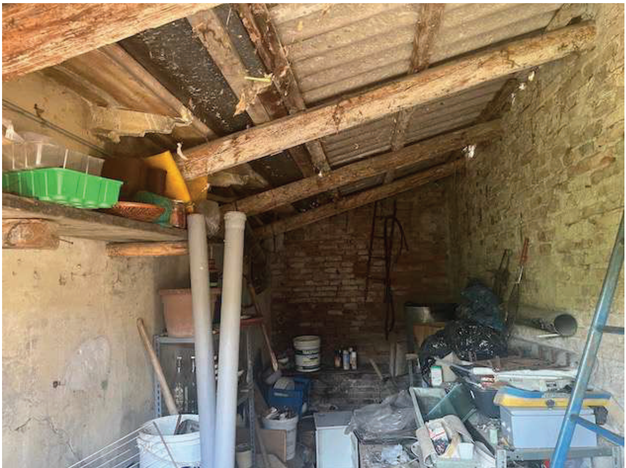
L'interno del manufatto abusivo