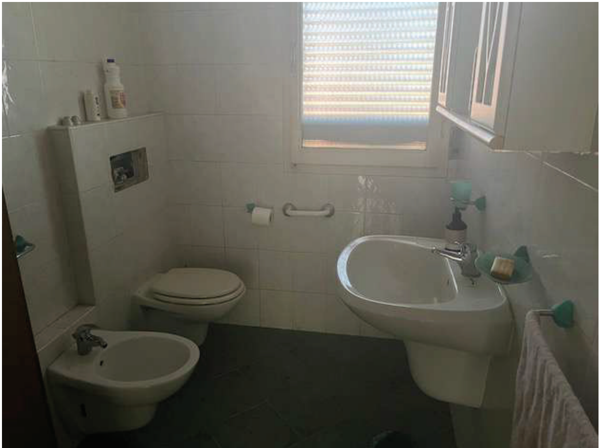
Bagno al piano primo