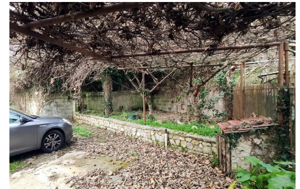
Lato ovest della corte esterna attrezzata a giardino