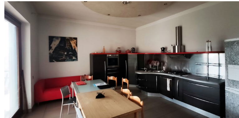
La cucina illuminata da un'ampia vetrata scorrevole