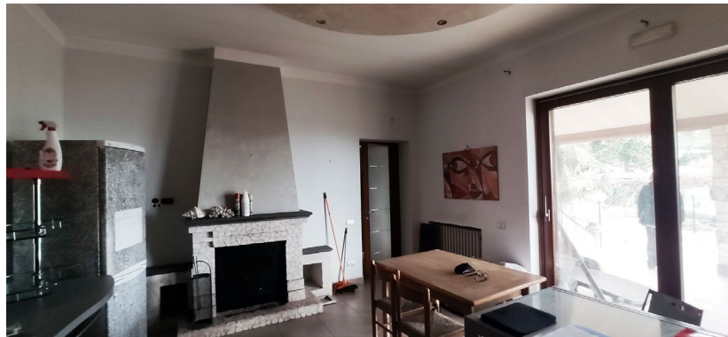
Cucina con termocamino