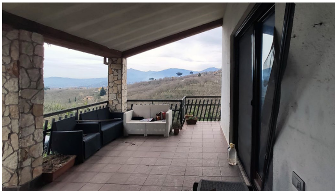
Portico antistante ingresso e cucina con vista verso ovest