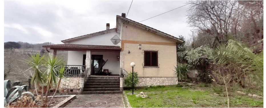
Prospetto principale della casa unifamiliare