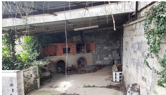
La zona forno/barbecue esterna lato est