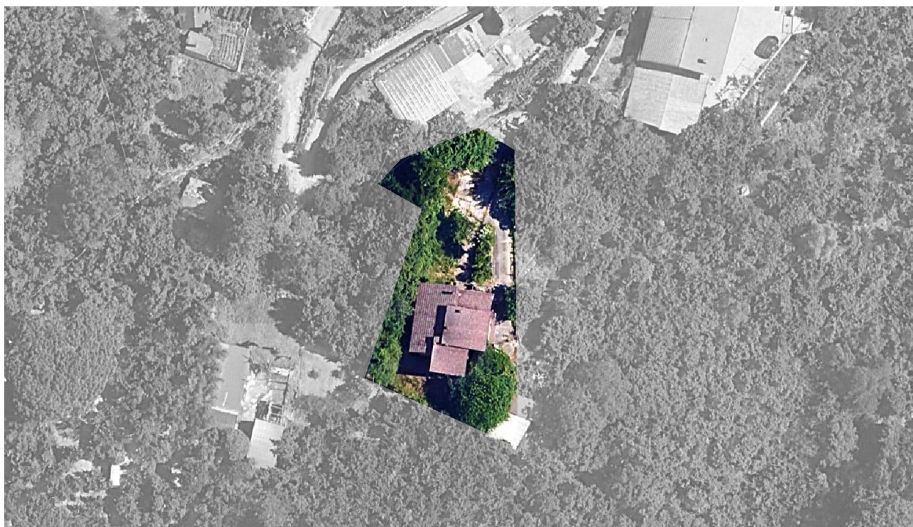
Ortofoto | Dettaglio del fabbricato e della corte esterna pertinenziale attrezzata a giardino