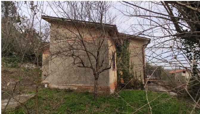
Prospetto posteriore sud