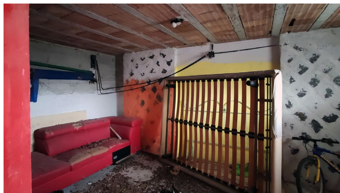
Deposito al piano seminterrato