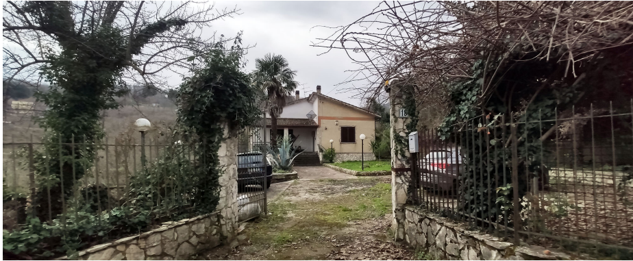
Vista della proprietà dal cancello d'ingresso