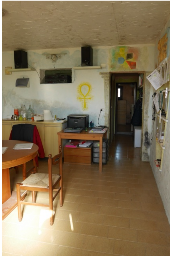
FOTO 6 - Piano terra. L'ingresso.