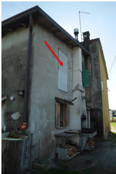
FOTO 2 – Il fabbricato in esame. Retro. Si nota l'accesso esterno al "fienile" posto al piano primo.