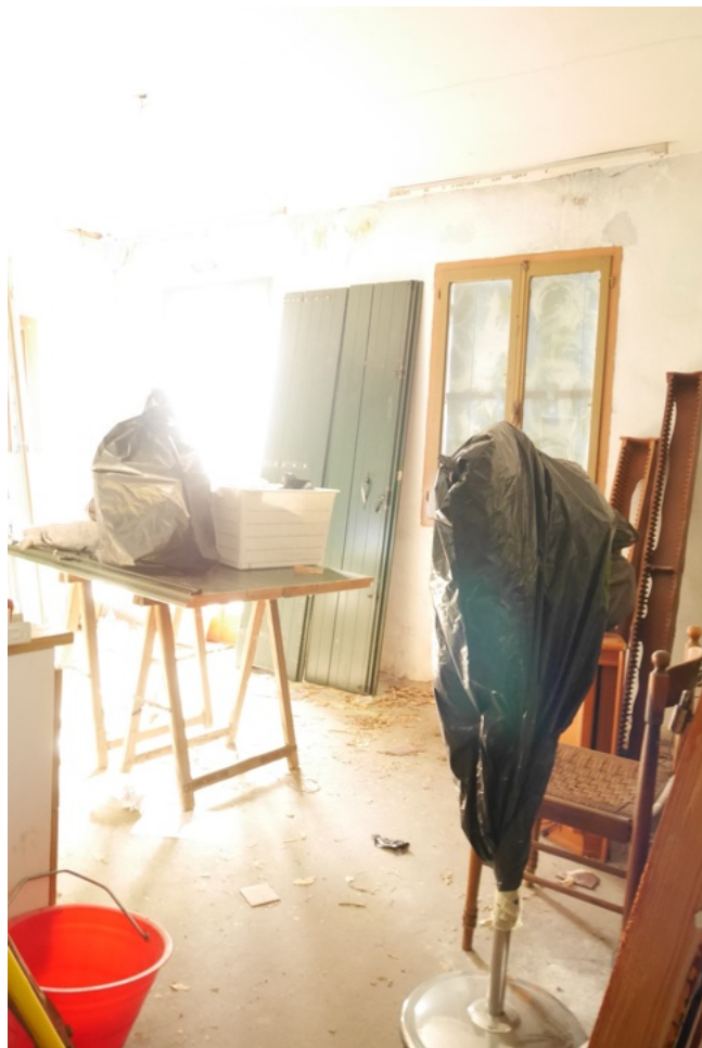
FOTO 12 - Piano primo. La camera.