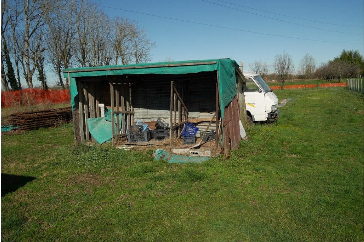
FOTO 4 - Altro manufatto. Si notano i cavi dell'elettrodotto.