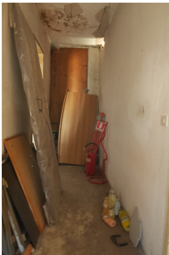
FOTO 10 - Piano primo. Il disimpegno.