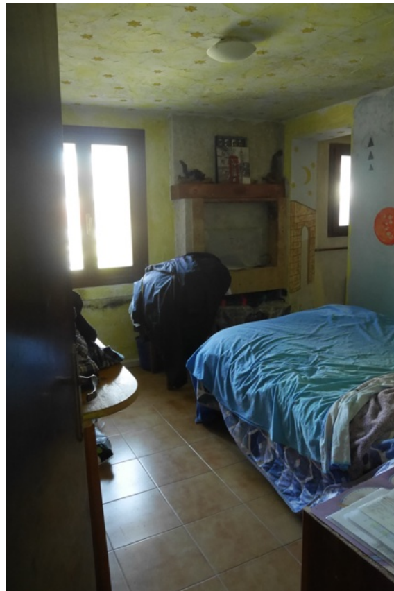
FOTO 7 - Piano terra. La camera e la porta di accesso alla cantina.