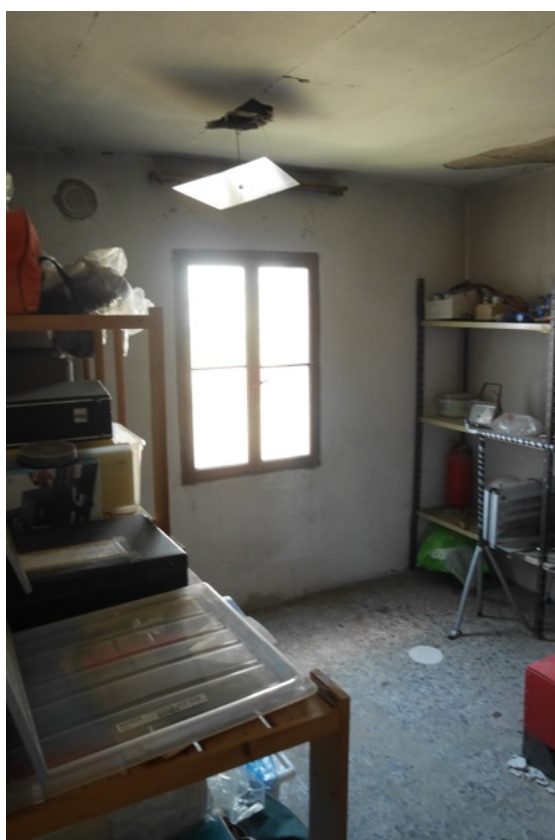
FOTO 11 -Piano primo. La cucina.