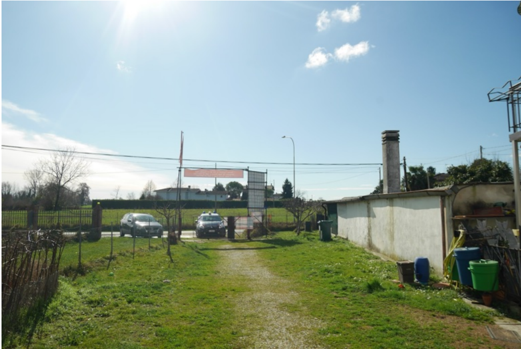
FOTO 14 - Lo scoperto antistante l'edificio ad uso abitativo verso la Via Giovanni Pascoli.