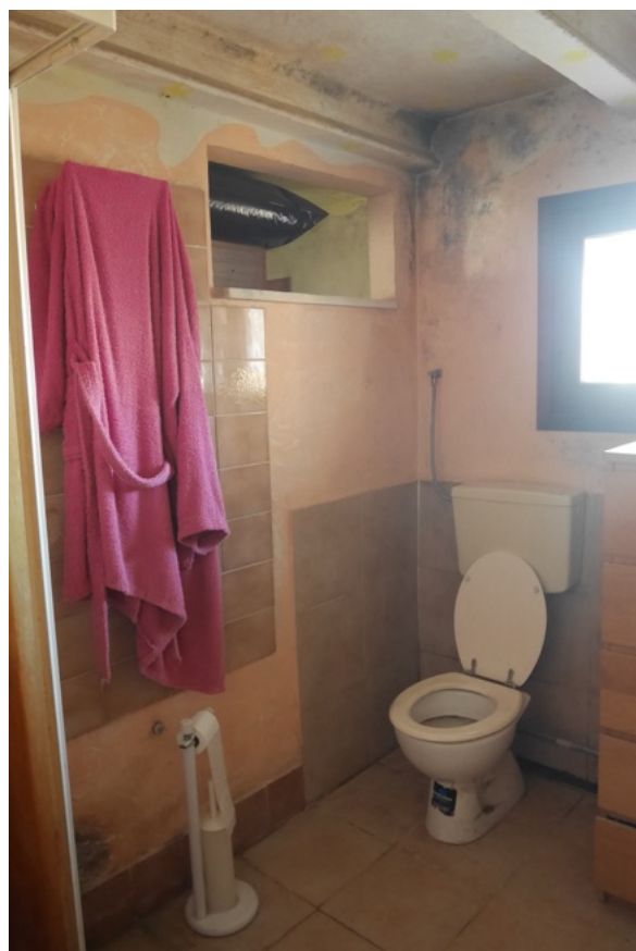
FOTO 8 - Piano terra. Il bagno.