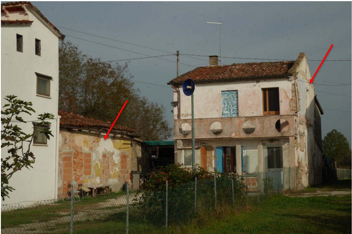
FOTO 5 - L'edificio ad uso abitativo. Si notano i segni di precedenti edifici posti in aderenza facenti parte dello stesso complesso poi demoliti.