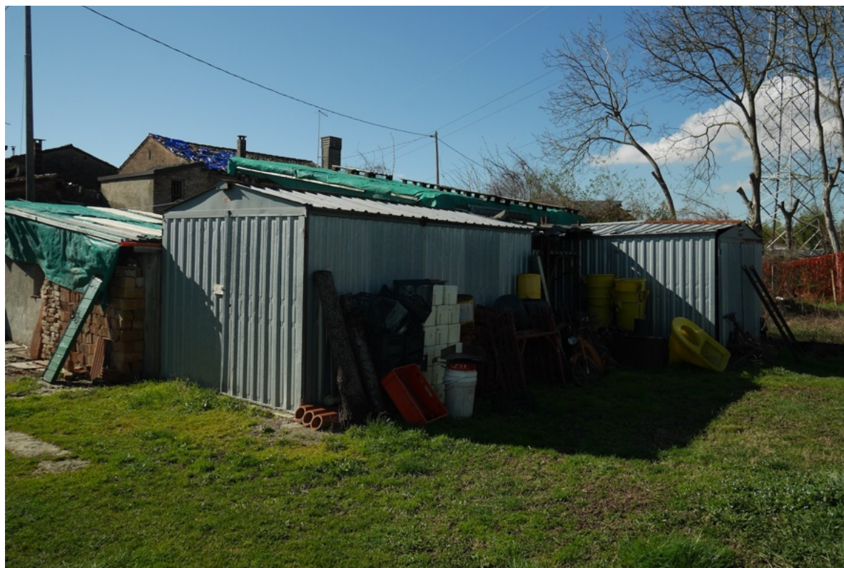
FOTO 3 – I manufatti sparsi nei terreni. Si nota sulla destra il traliccio dell'elettrodotto con i relativi cavi.