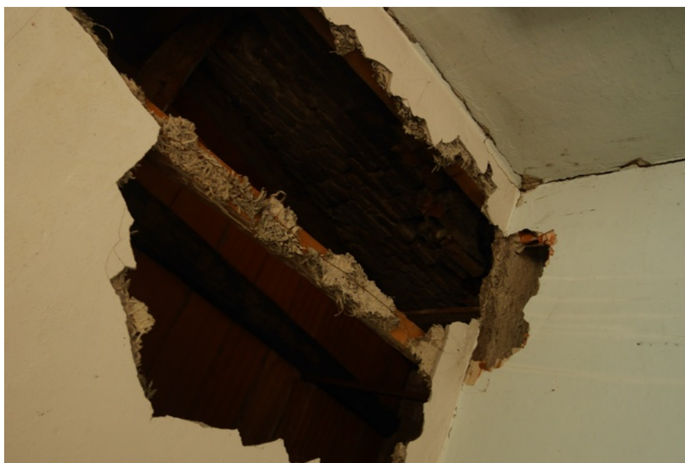
FOTO 13 - Piano primo. La struttura della copertura.