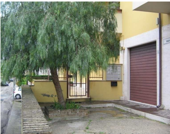
Ingresso Principale pedonale