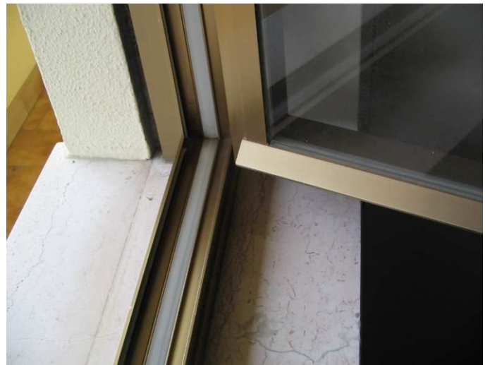
Particolare infissi - soglie