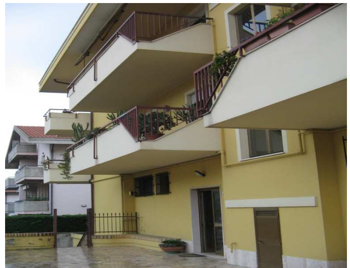
Ingresso su corte comune