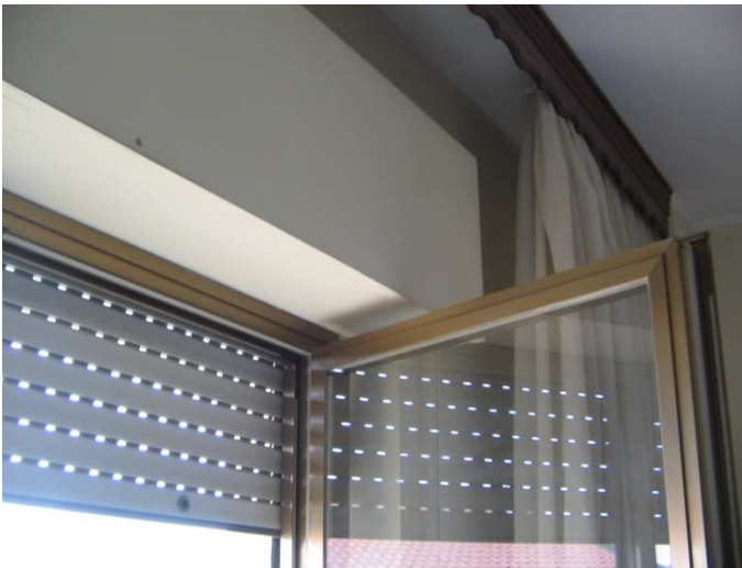
Particolare infissi con cassonetti