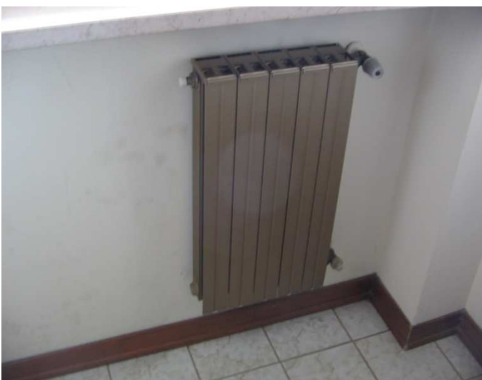
Particolare Elementi Radianti