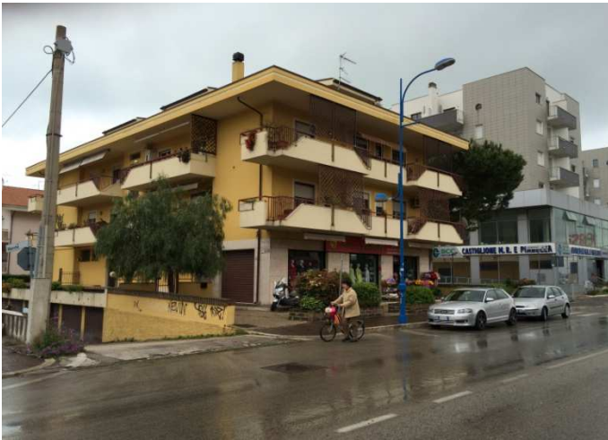
Vista da Corso Umberto I°