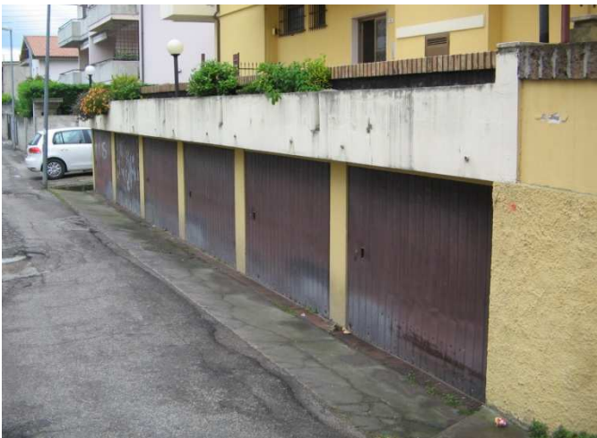
Garage Vista da Via Marche