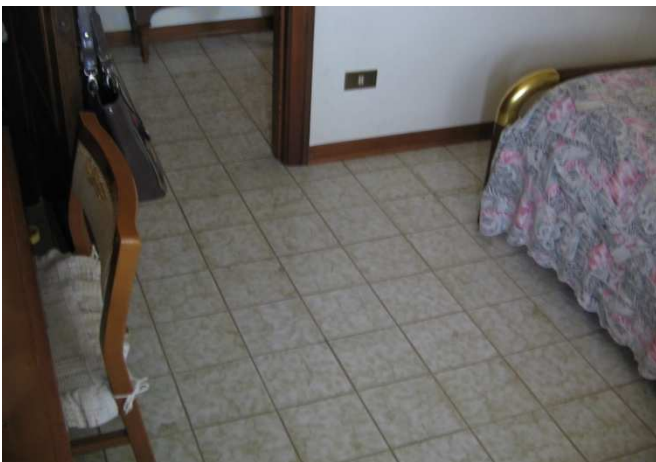
Camera dal Letto