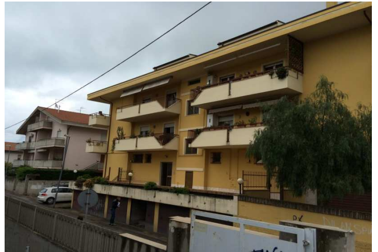
Vista da Via Marche