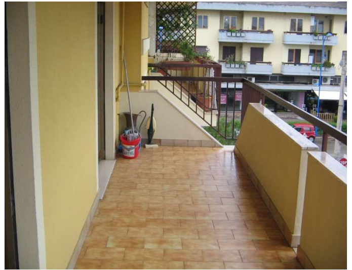
Balcone lato Nord - Est