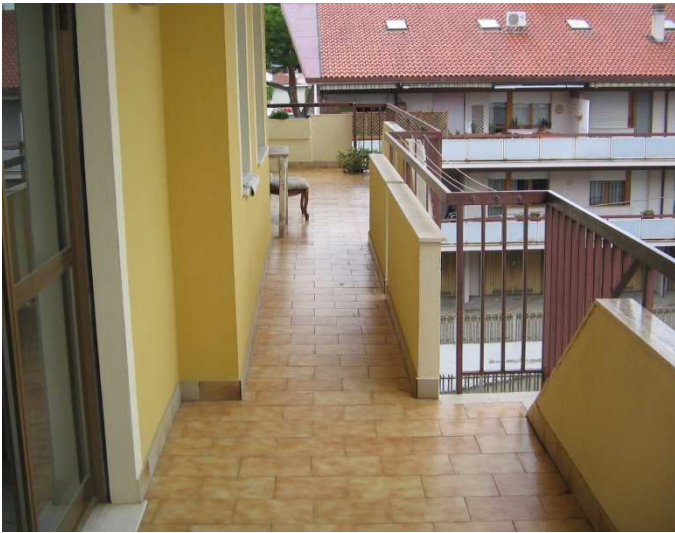
Balcone lato Nord – Ovest