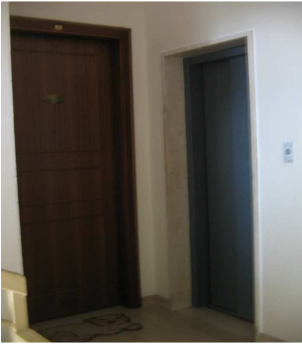
Ingresso Abitazione dal pianerottolo