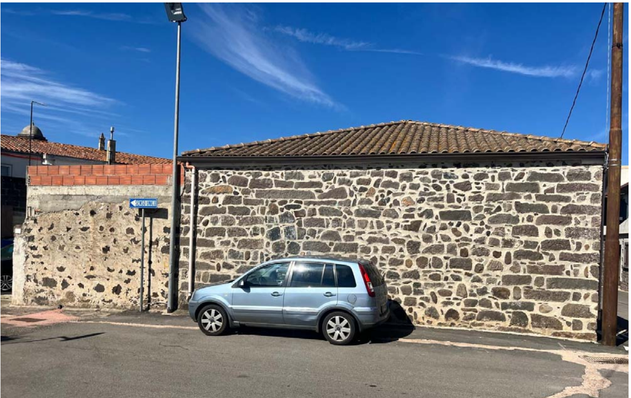
Prospetto sulla via Caprera