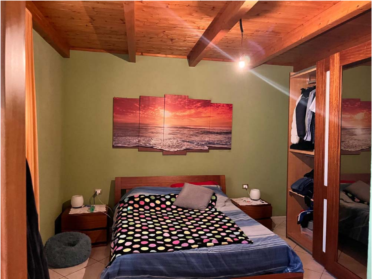
Camera da letto matrimoniale