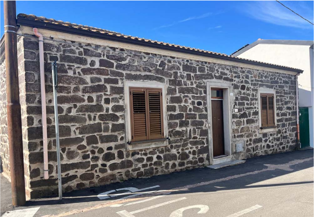
Prospetto principale sulla via Iosto