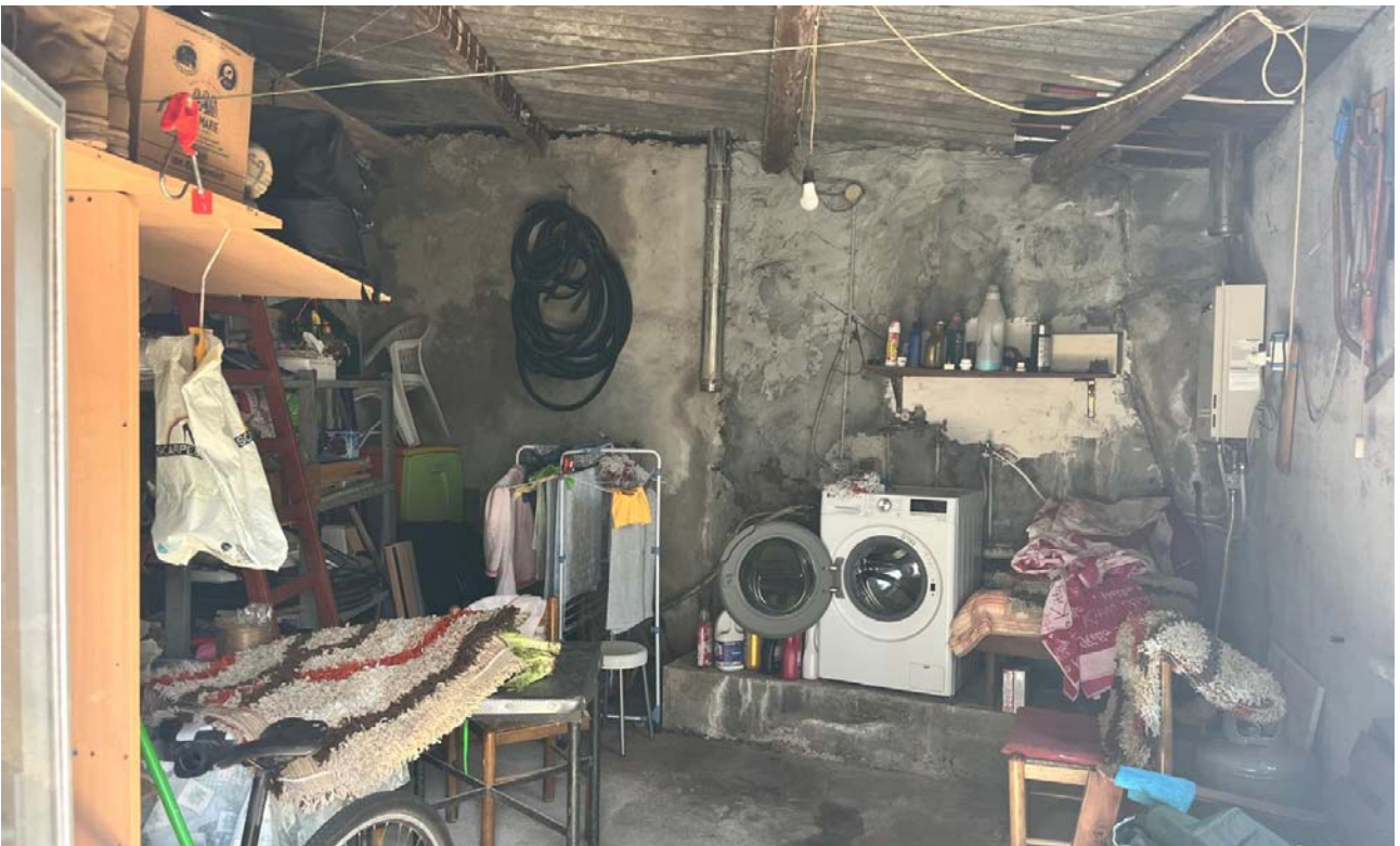
Locale tecnico - interno