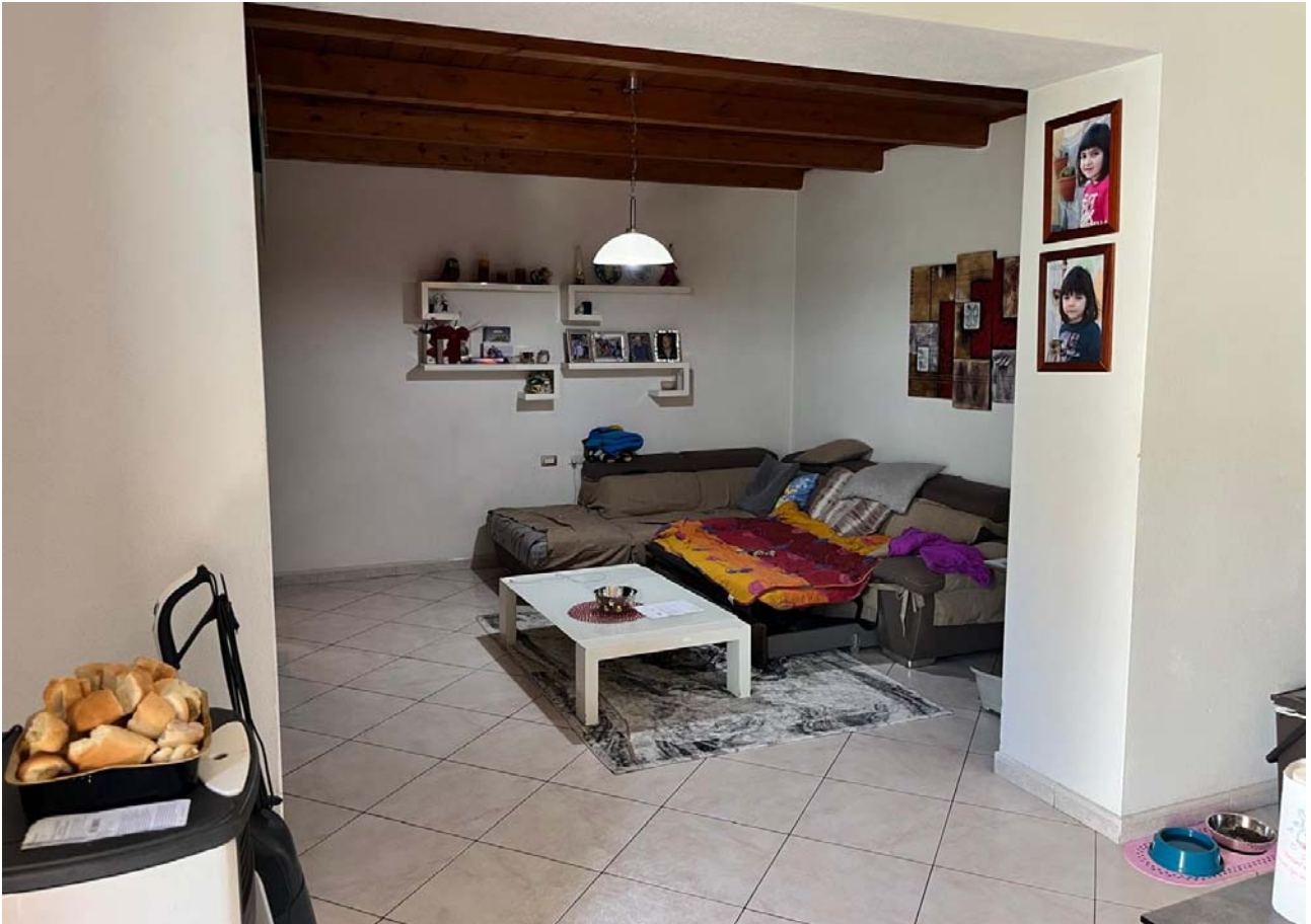
Vista salone dalla cucina