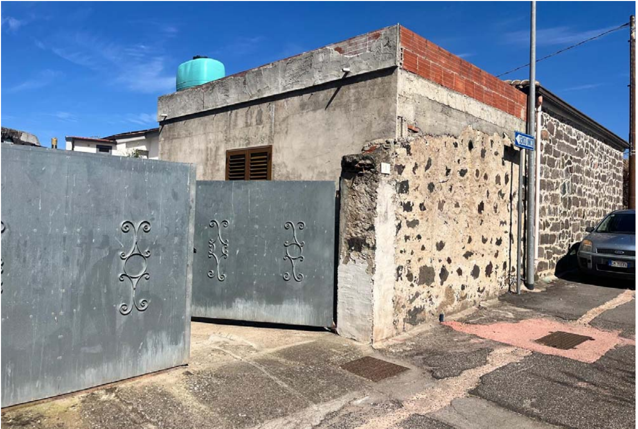
Ingresso carrabile dalla via Caprera