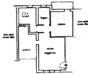
PIANO PRIMO H=2,70 e 2,40 mt