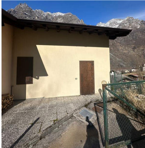
Fotografia n. 2 – ingresso