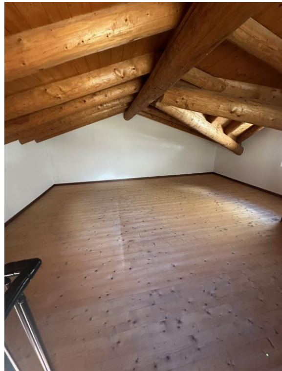
Fotografia n. 14 – sottotetto