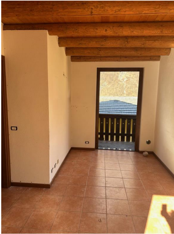
Fotografia n. 7 – zona giorno