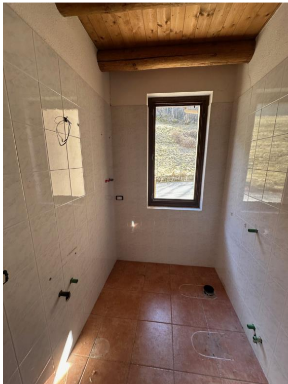
Fotografia n. 9 – bagno