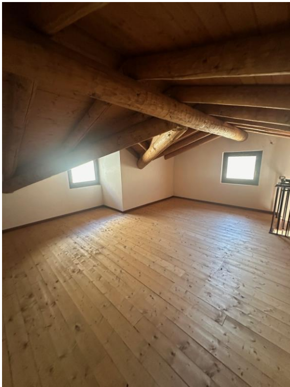
Fotografia n. 13 – sottotetto