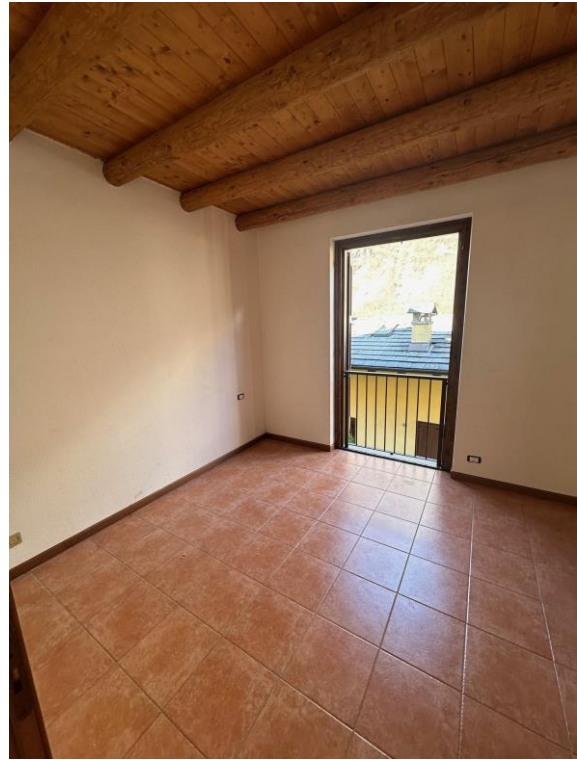
Fotografia n. 12 – camera