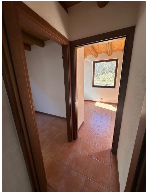
Fotografia n. 8 – disimpegno