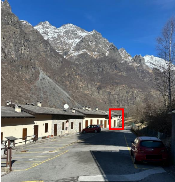
Fotografia n. 1 – esterno