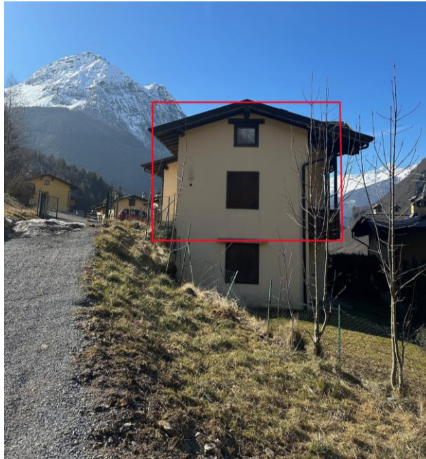
Fotografia n. 4 - esterno