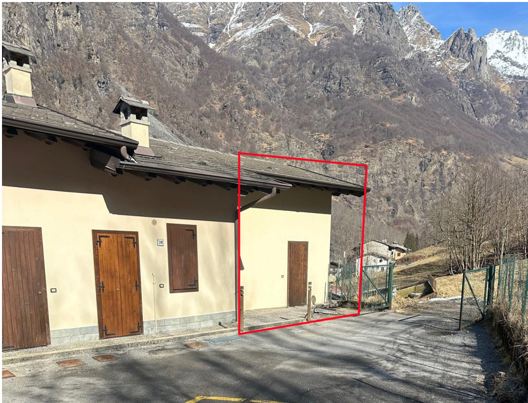
Fotografia n. 3 - esterno