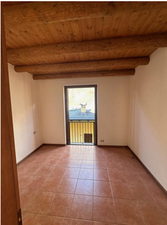
Fotografia n. 5 – zona giorno