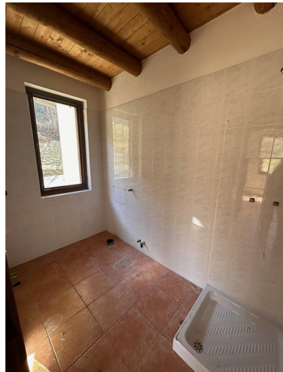
Fotografia n. 10 – bagno