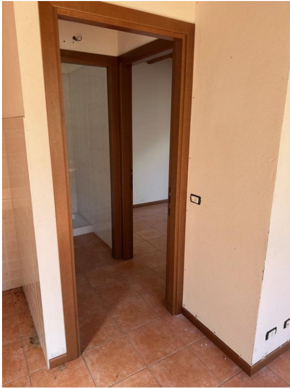
Fotografia n. 11 – disimpegno