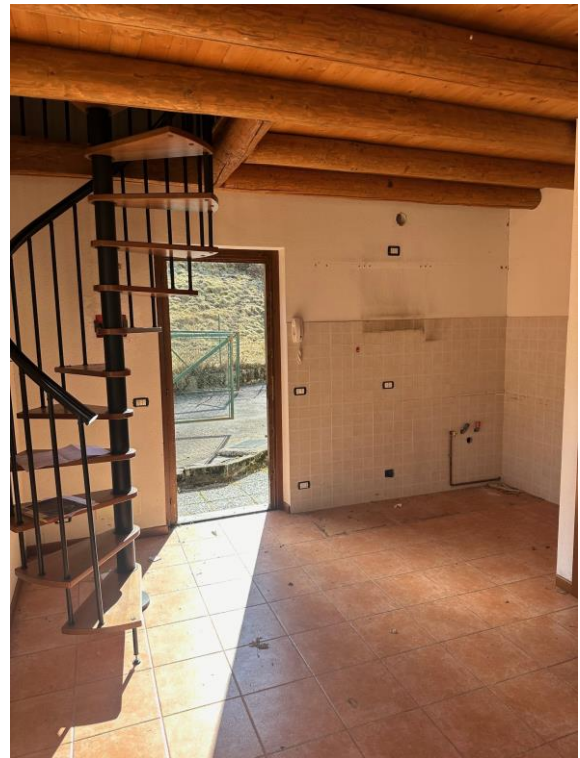
Fotografia n. 6 – cucina