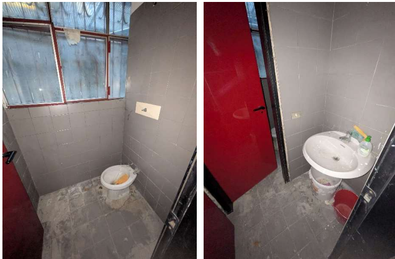
Locale bagno e antibagno