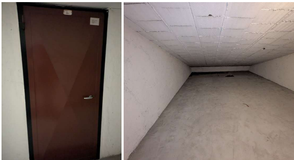
Locali deposito al sottotetto