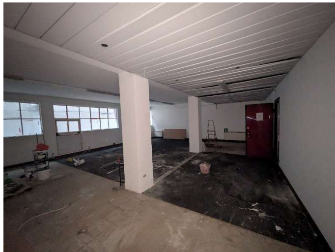
Locale piano interrato