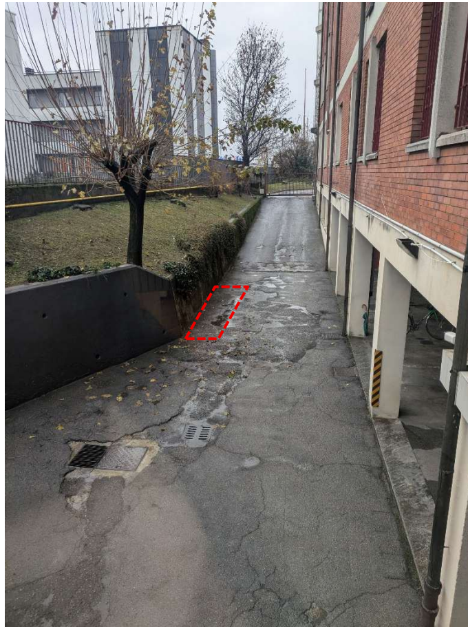
Posto auto – posizione indicativa