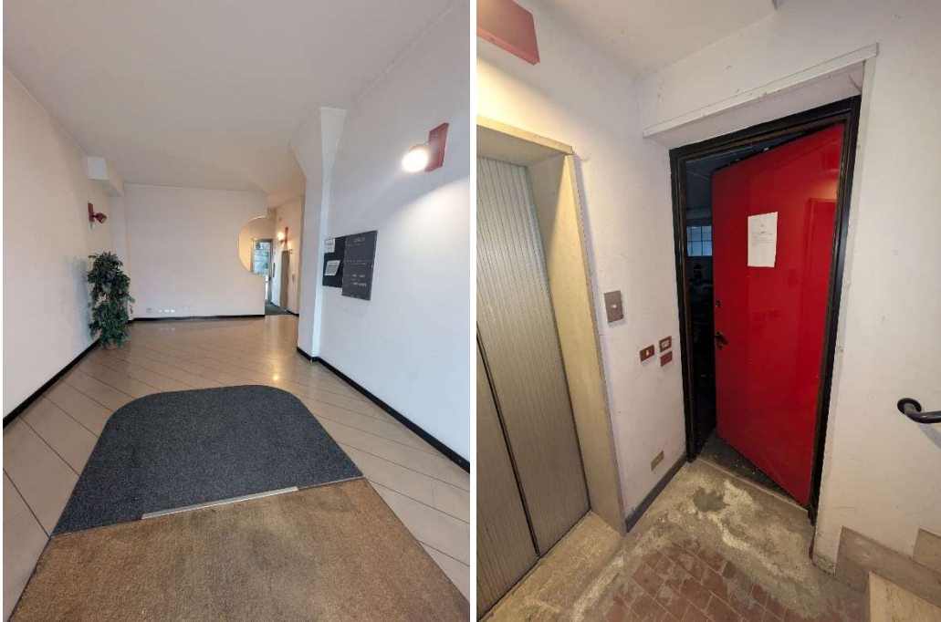
Ingresso scala B e ingresso all'unità al piano interrato