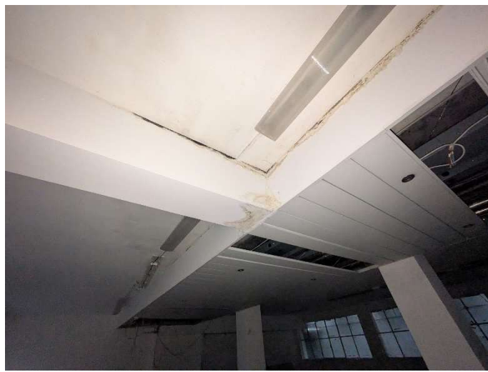
Locale piano interrato