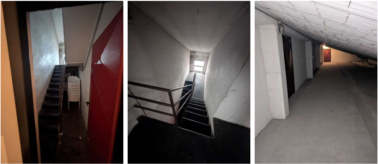
Ingresso ai locali sottotetto dalla scala A