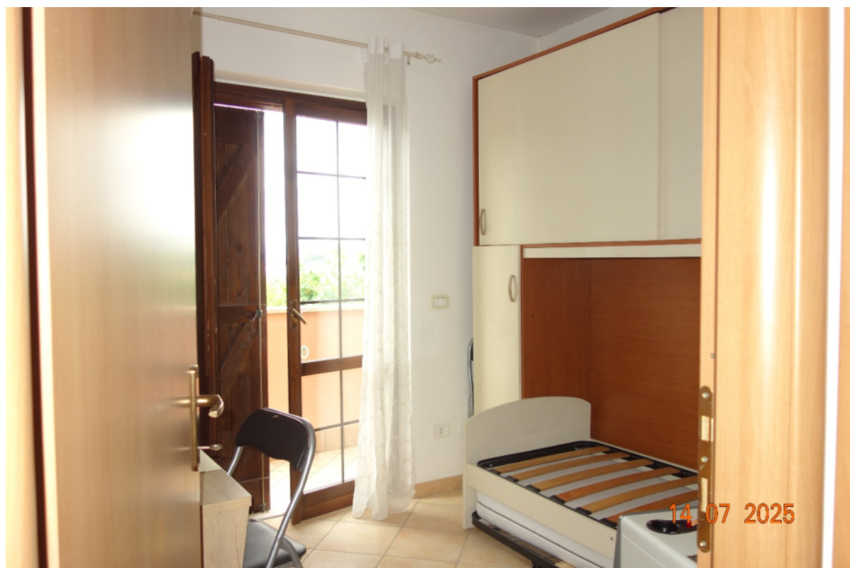
Foto 17 Vista del vano destinato a stanza da letto singola