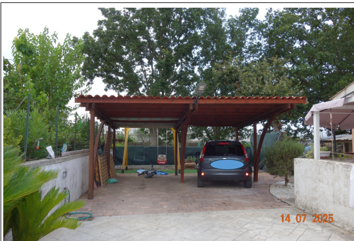
Foto 2 Vista della tettoia destinata a ricovero auto insistente sull'area esterna pertinenziale