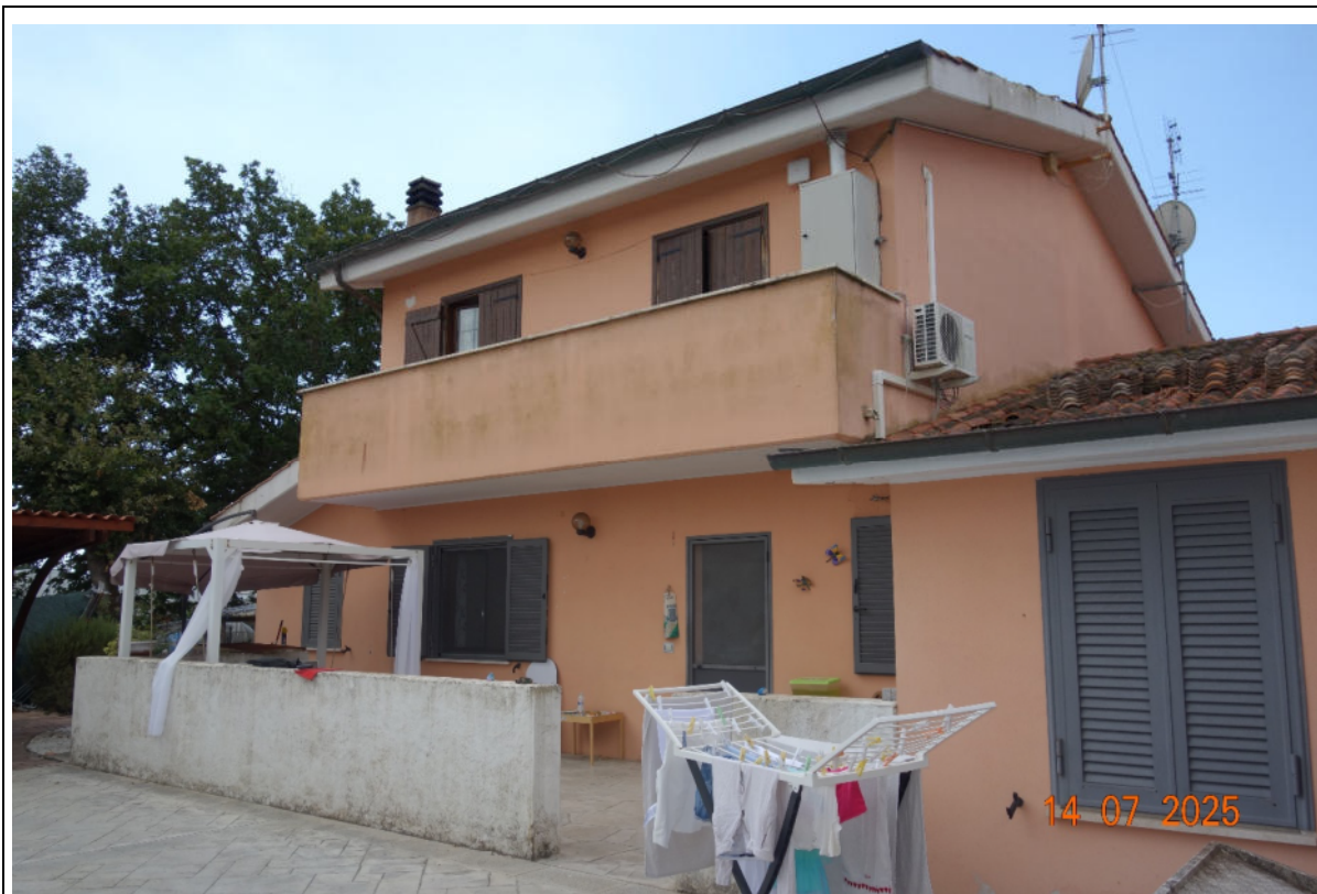
Foto 1 Vista del prospetto di ingresso