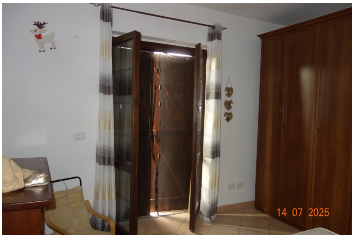
Foto 16 Vista del vano destinato a stanza da letto matrimoniale