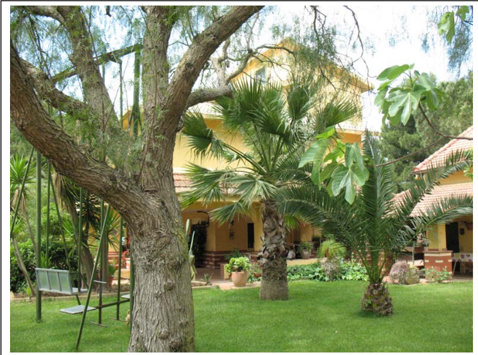
Rilievo Fotografico – Fabbricato principale - esterni