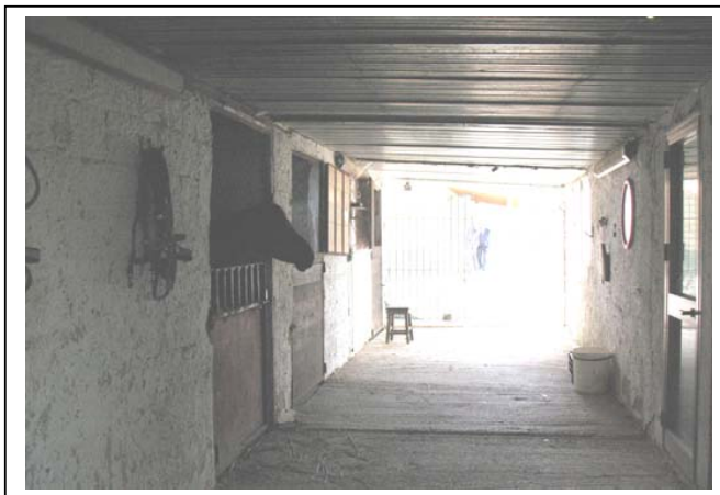
Rilievo Fotografico – Corpi secondari B