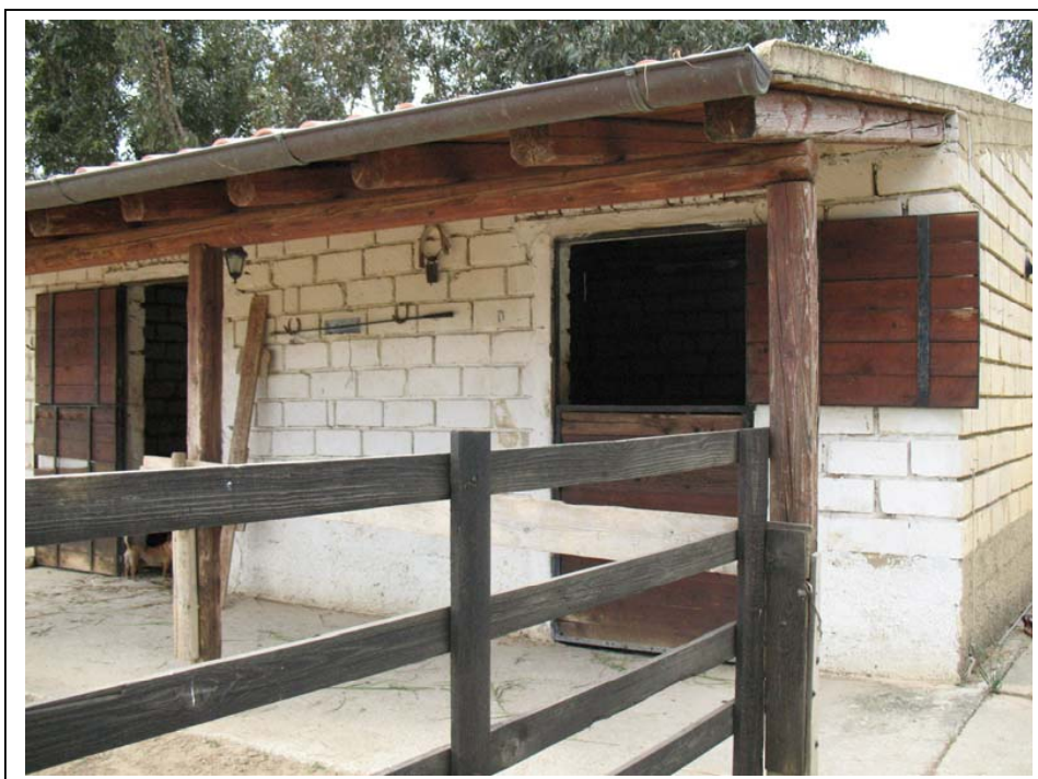
Rilievo Fotografico – Corpi secondari A