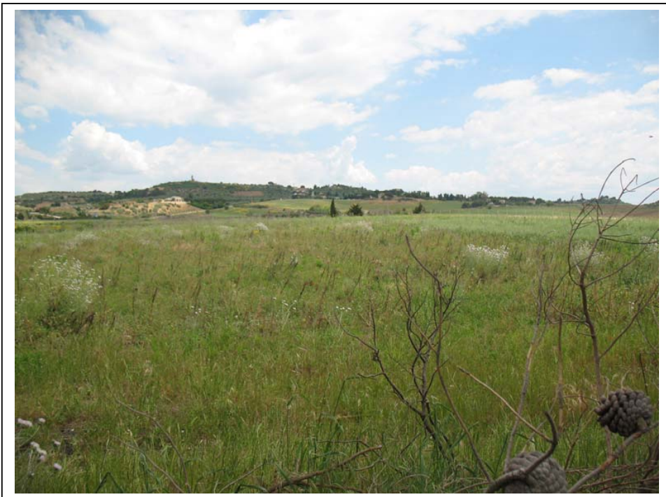
Rilievo Fotografico – Terreno