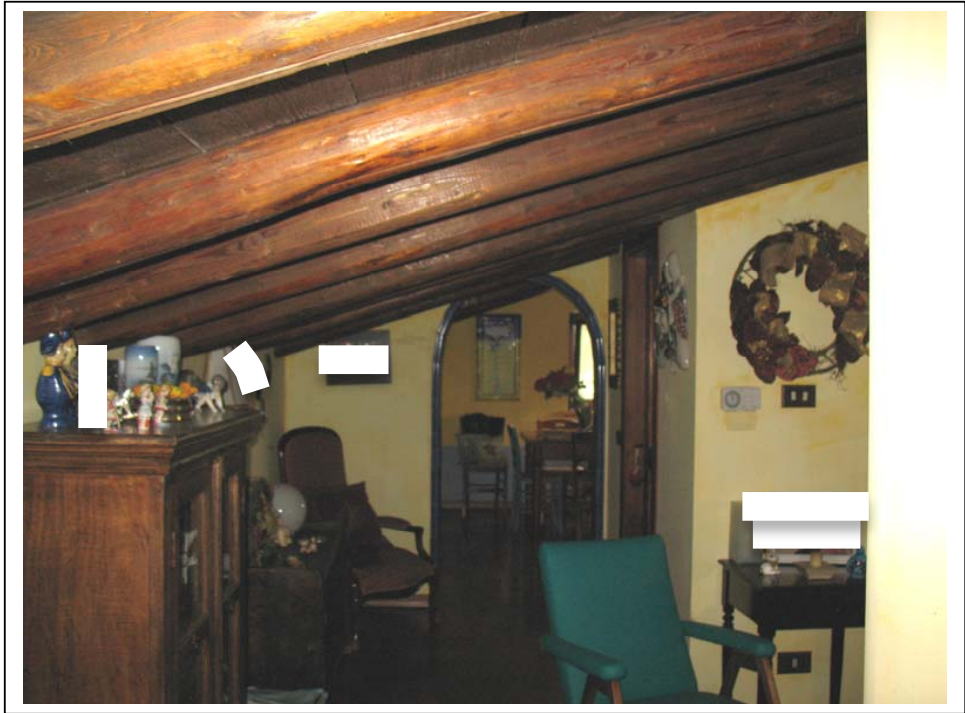
Rilevo Fotografico – Interni