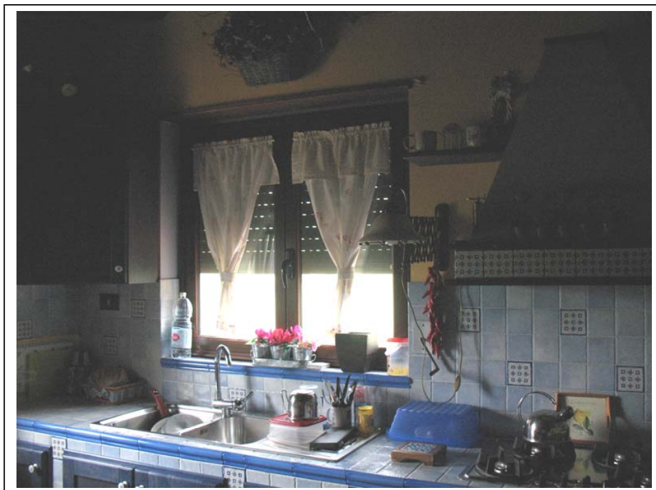
Rilievo Fotografico – Interni