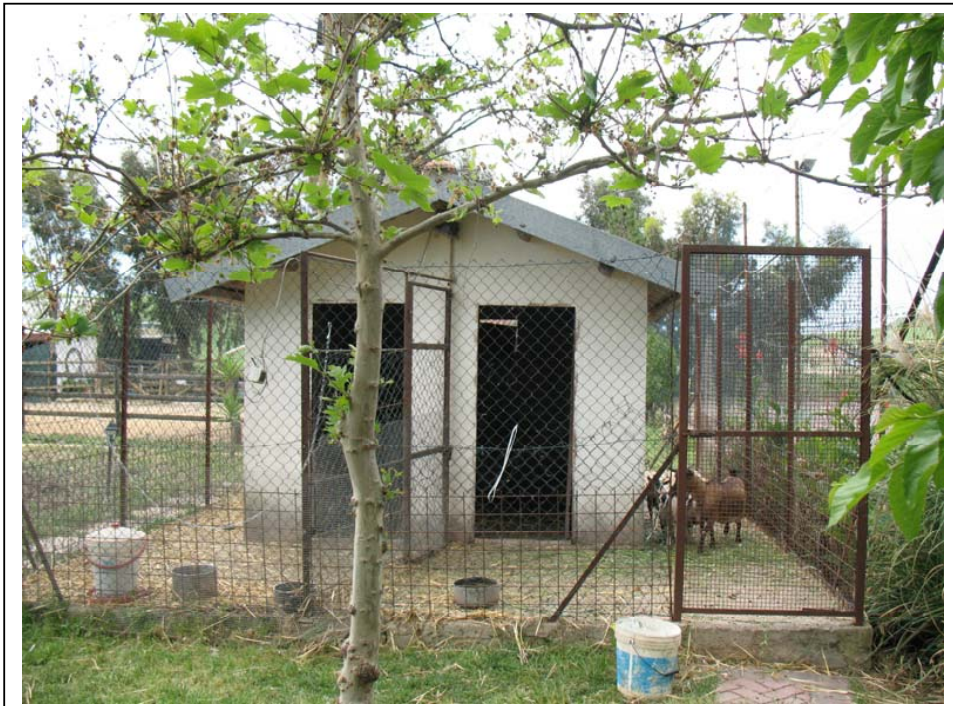
Rilievo Fotografico – Corpi secondari D e C