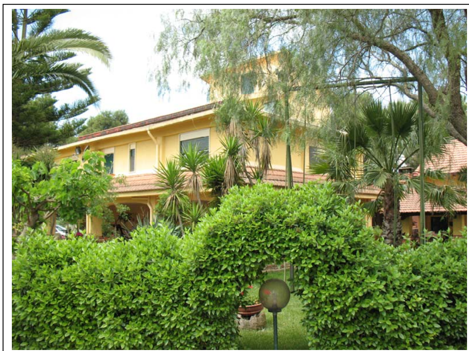
Rilievo Fotografico – Fabbricato principale - esterni