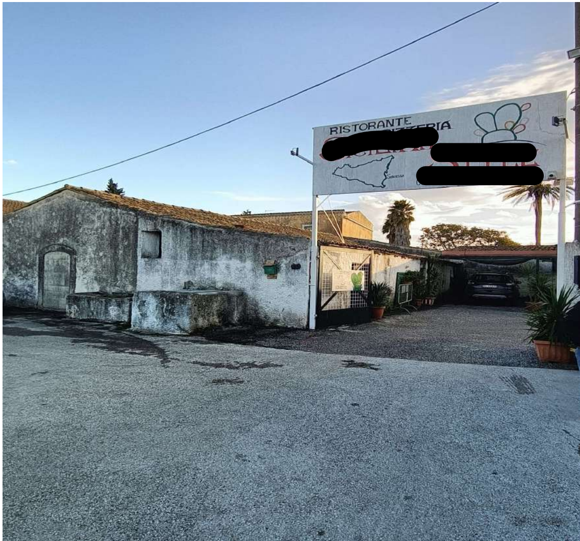
1- Ingresso ristorante pizzeria, fabbricato rurale e terreno (Fg.65 p.la 635, Fg.65 p.la 26)