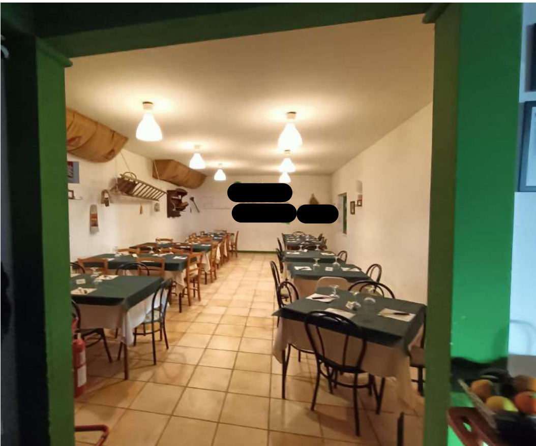
15 – Vista interna della sala del locale ristorante-pizzeria