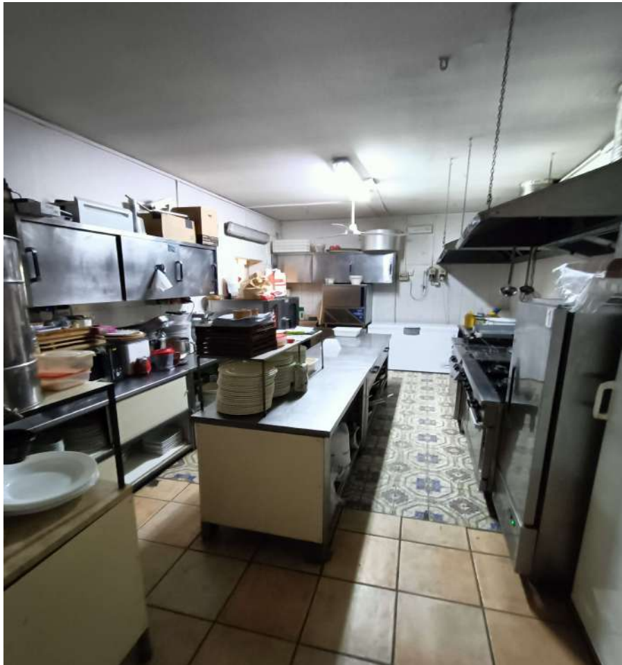
19 – Locale cucina