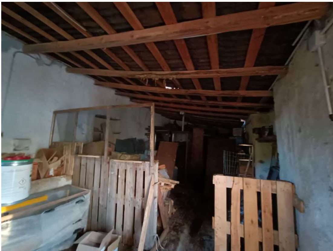
5 - Vista interna fabbricato rurale (Fig.65 p.lla26)

Alino ORDINE DEGLI INGEGNERI DOTT. ING. CIRCO ALVARO 19115 SIRACUSA