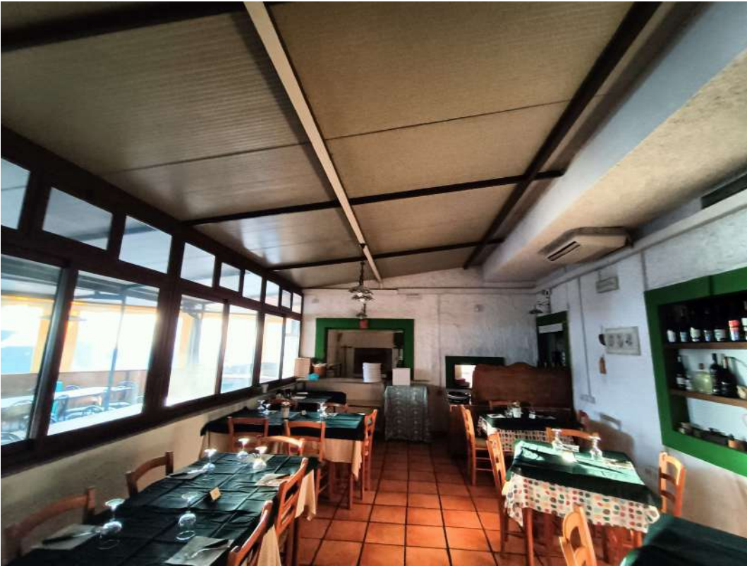
14 – Vista interna della zona somministrazione coperta del locale ristorante-pizzeria