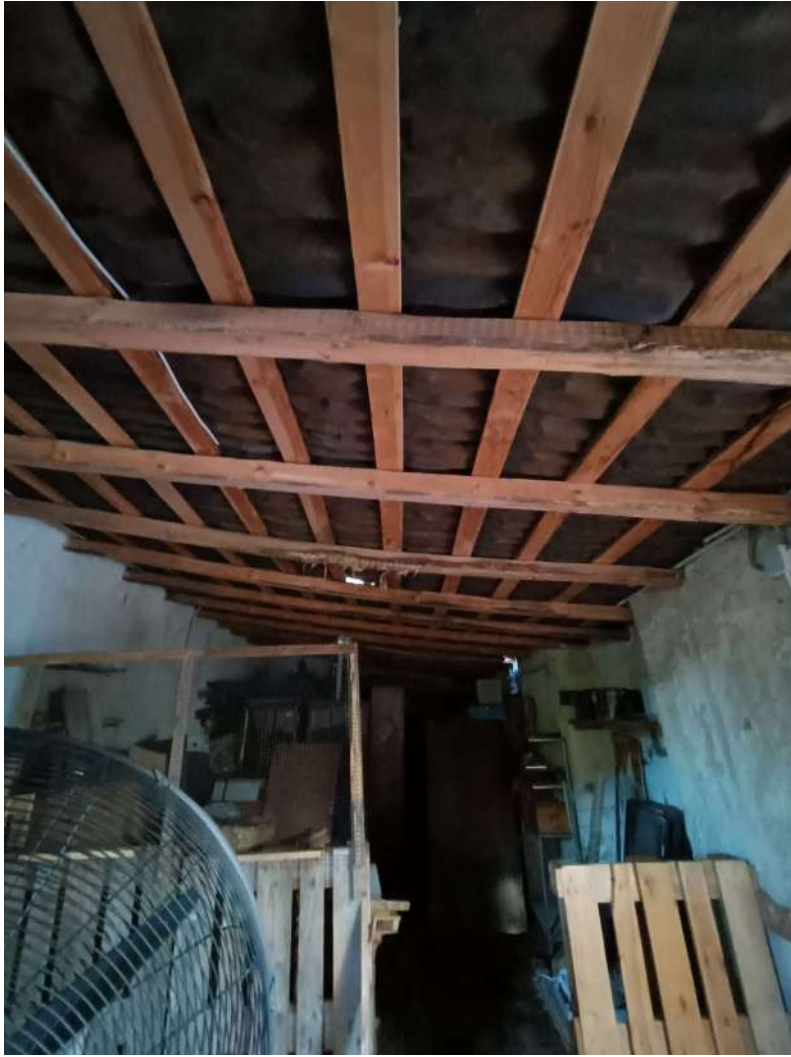
6 - Vista interna fabbricato rurale (Fig.65 p.lla26)