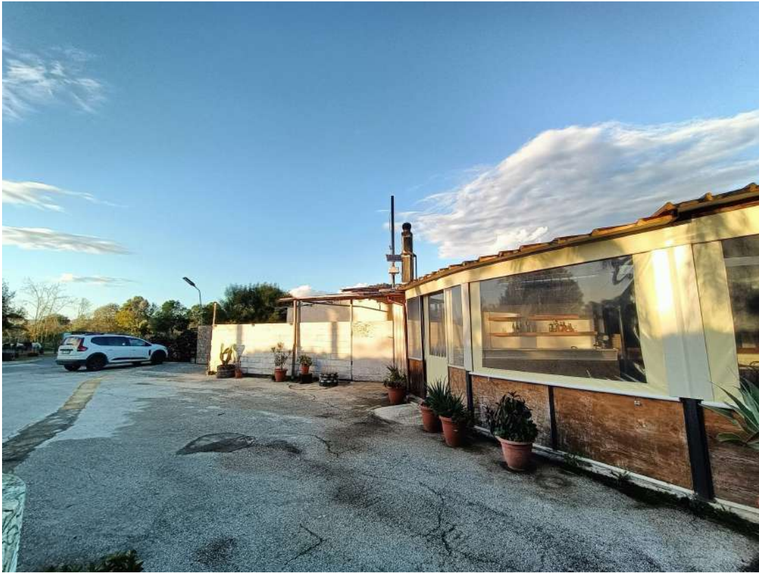
8 – Vista esterna del locale ristorante-pizzeria (Fig.65 p.lla 435)