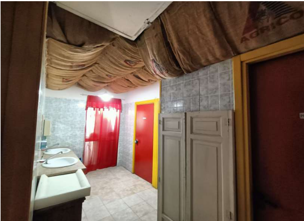
18 – Servizi igienici