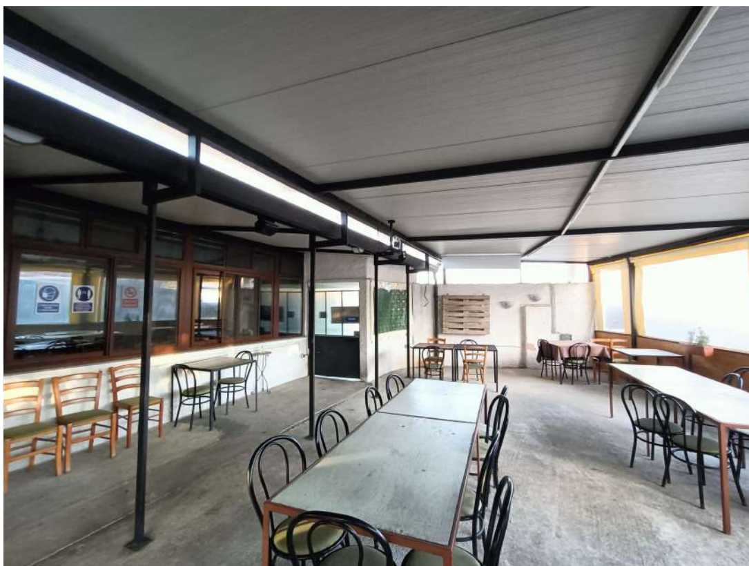
12 – Vista della “zona somministrazione all’aperto” coperta del locale ristorante-pizzeria