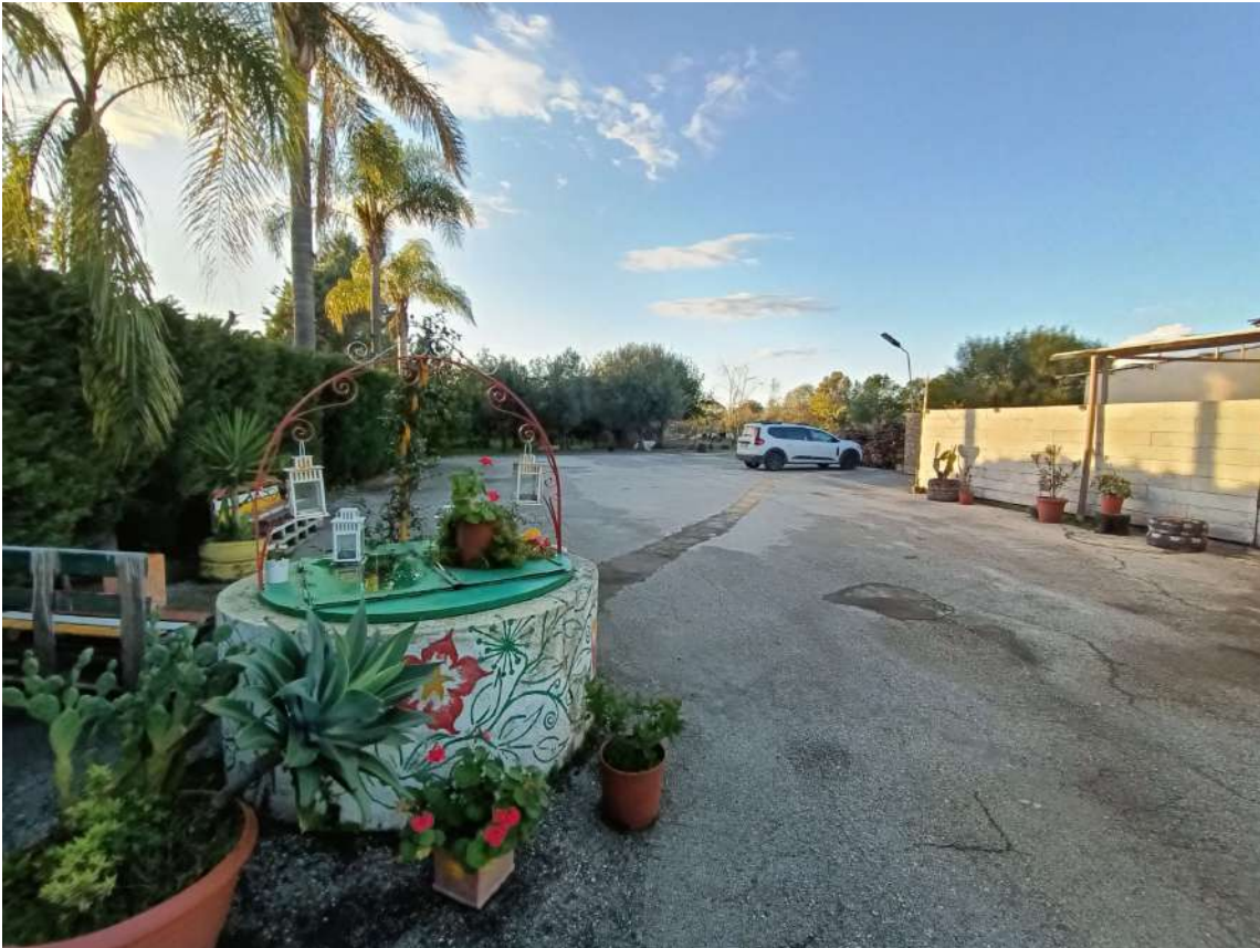
9 – Vista esterna parcheggio del locale ristorante-pizzeria e pozzo trivellato altra proprietà