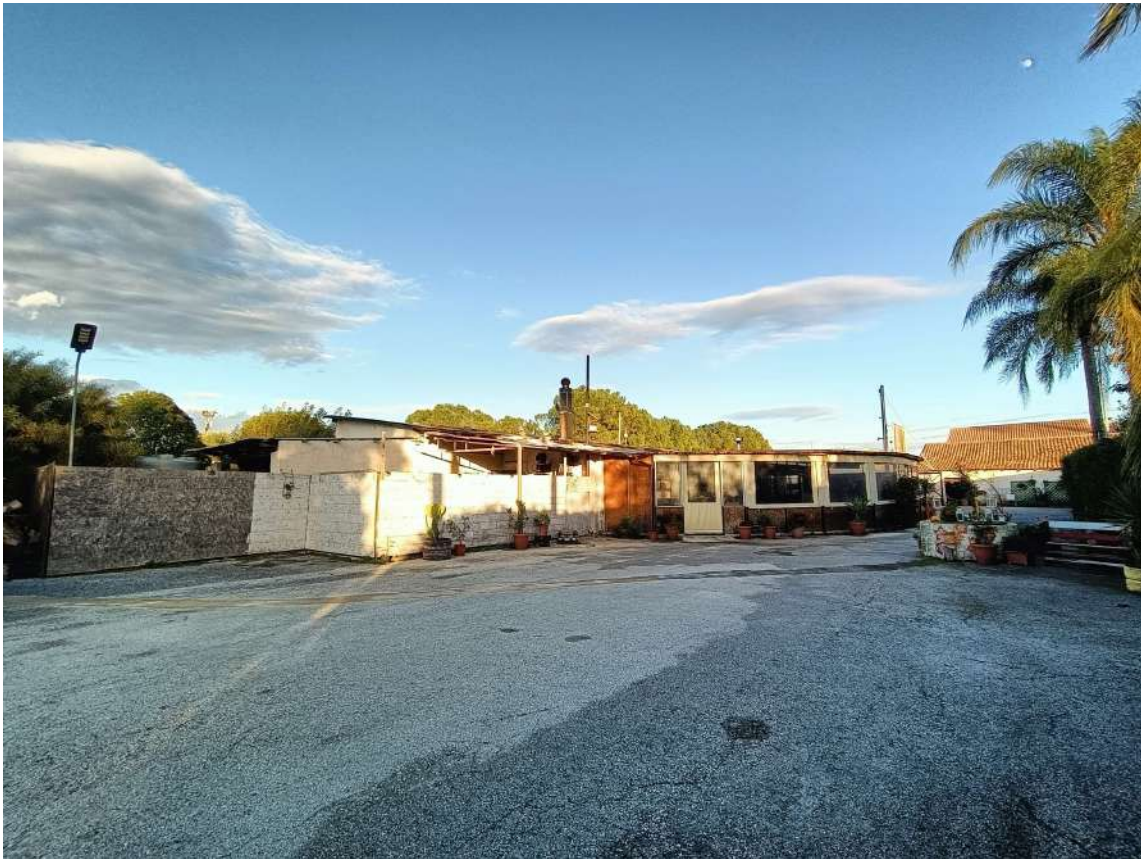
10 – Vista esterna parcheggio e locale ristorante-pizzeria (Fig.65 p.lla 435)