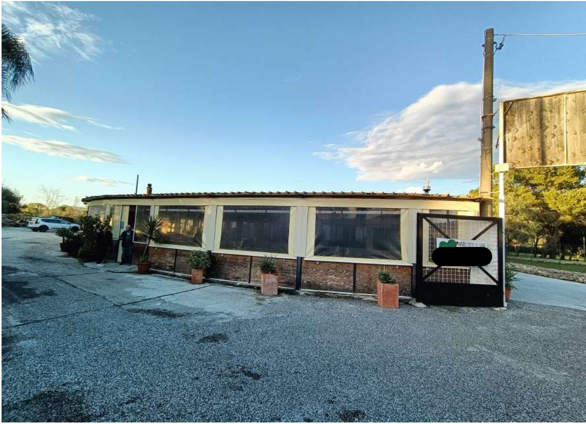
7 – Vista esterna del locale ristorante-pizzeria (Fig.65 p.lla 435)