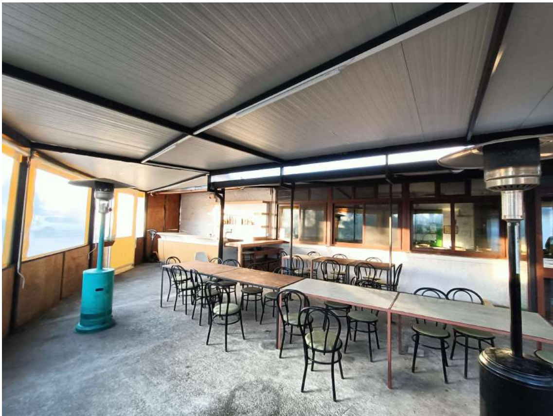
11 – Vista della “zona somministrazione all’aperto” coperta del locale ristorante-pizzeria