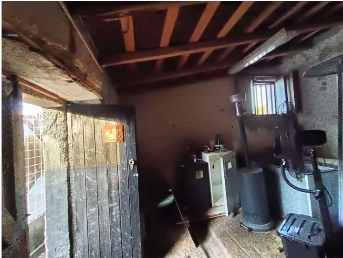
4 - Vista interna fabbricato rurale (Fig.65 p.lla26)

Alino ORDINE DEGLI INGEGNERI DOTT. ING. CIRCO ALVARO 19115 SIRACUSA