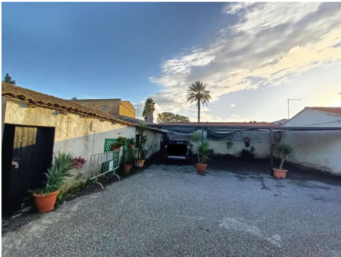
3 - Vista esterna fabbricato rurale e terreno (Fg.65 p.lla 26)

Alino A circular professional stamp for an engineer. The text inside the stamp reads: "ORDINE DEGLI INGEGNERI", "DOTT. ING. CIRCO ALVARO", "N. 885", and "SIRACUSA".