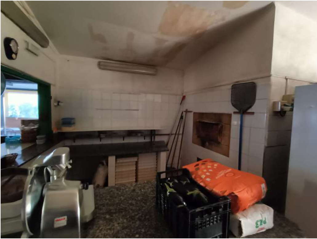
20 – Locale forno