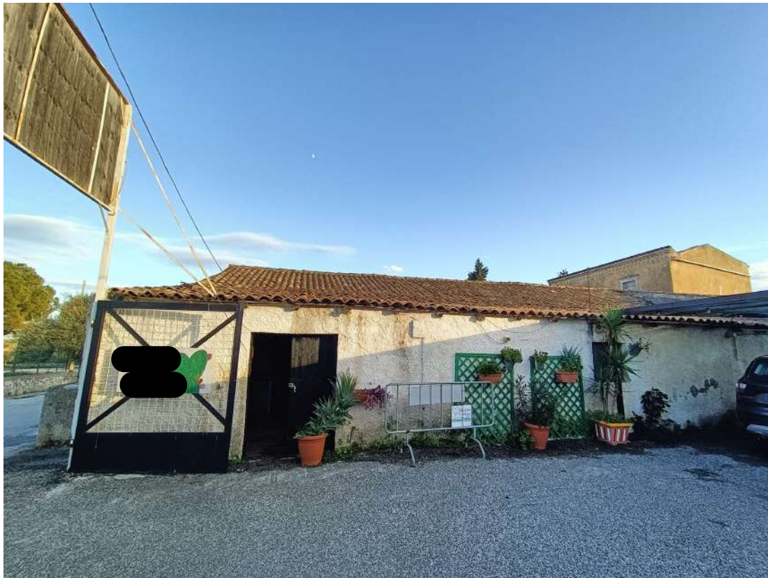
2 - Vista esterna fabbricato rurale (Fg.65 p.lla 26)