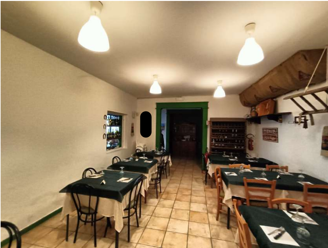
16 – Vista interna della sala del locale ristorante-pizzeria