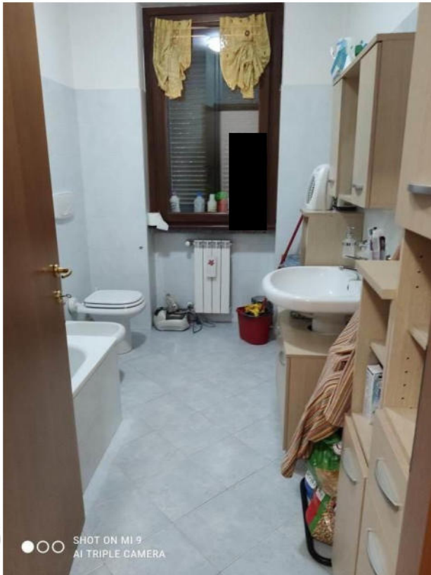
STATO DEI LOCALI INTERNI ALLA SINGOLA U.I.U. DI ABITAZIONE a 1°P. con cantina a PS1 - MAPPALE 1890 /SUB.727 -