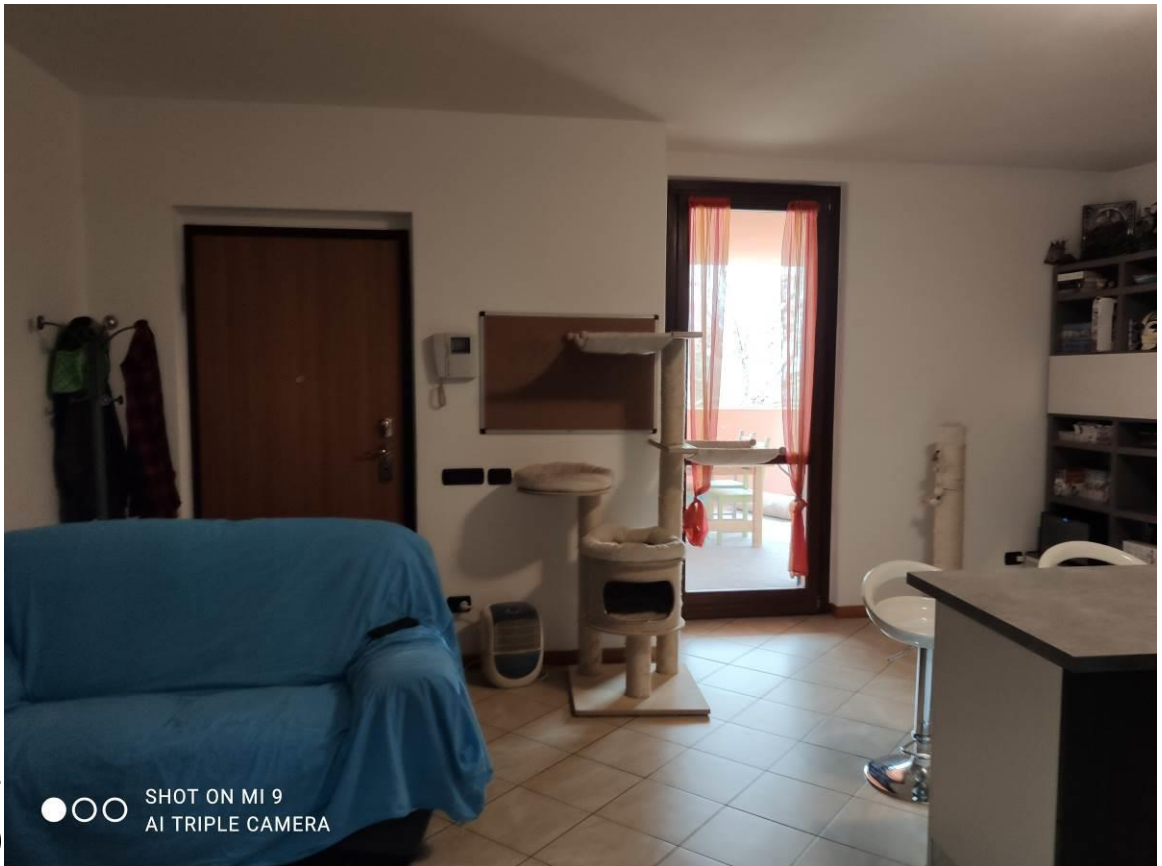
STATO DEI LOCALI INTERNI ALLA SINGOLA U.I.U. DI ABITAZIONE a 1°P. con cantina a PS1 - MAPPALE 1890 /SUB.727 -