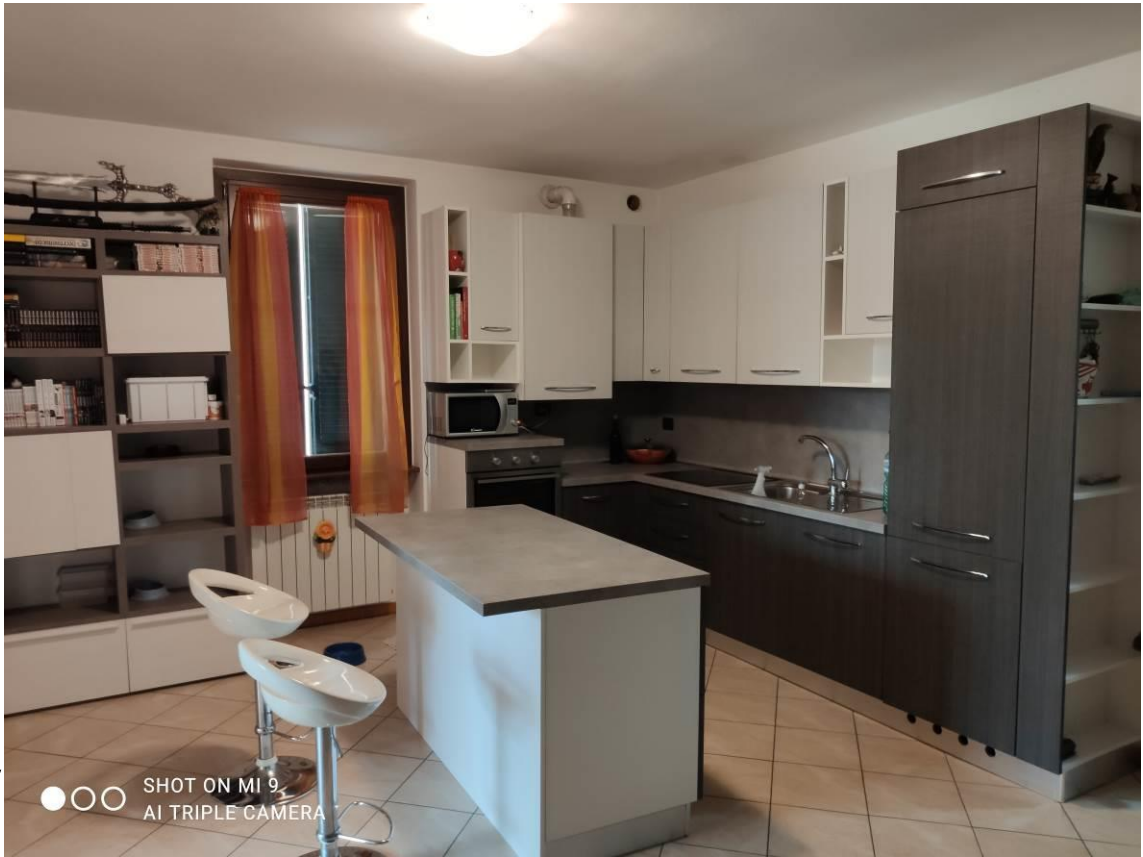
STATO DEI LOCALI INTERNI ALLA SINGOLA U.I.U. DI ABITAZIONE a 1°P. con cantina a PS1 - MAPPALE 1890 /SUB.727 -