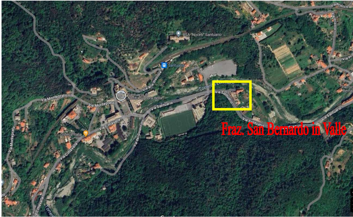
Foto 1 – Vista satellitare del territorio di Santuario con indicazioni dell'immobile

Comune di Savona, Via Santuario civ. 114