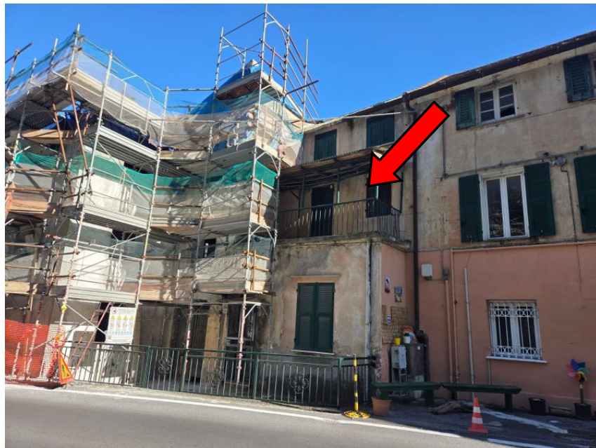
Foto 2 – Vista dell'immobile da Via Santuario con indicazione dell'immobile