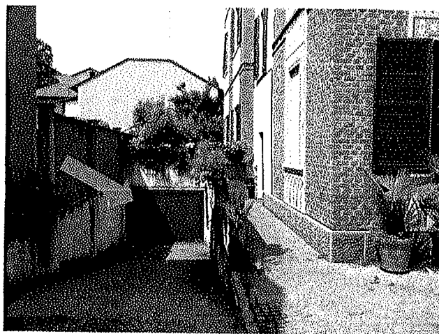
Viste verso ingresso laterale e box di pertinenza