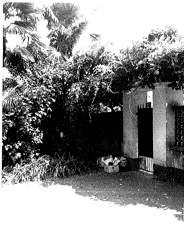
Viste del cortile interno