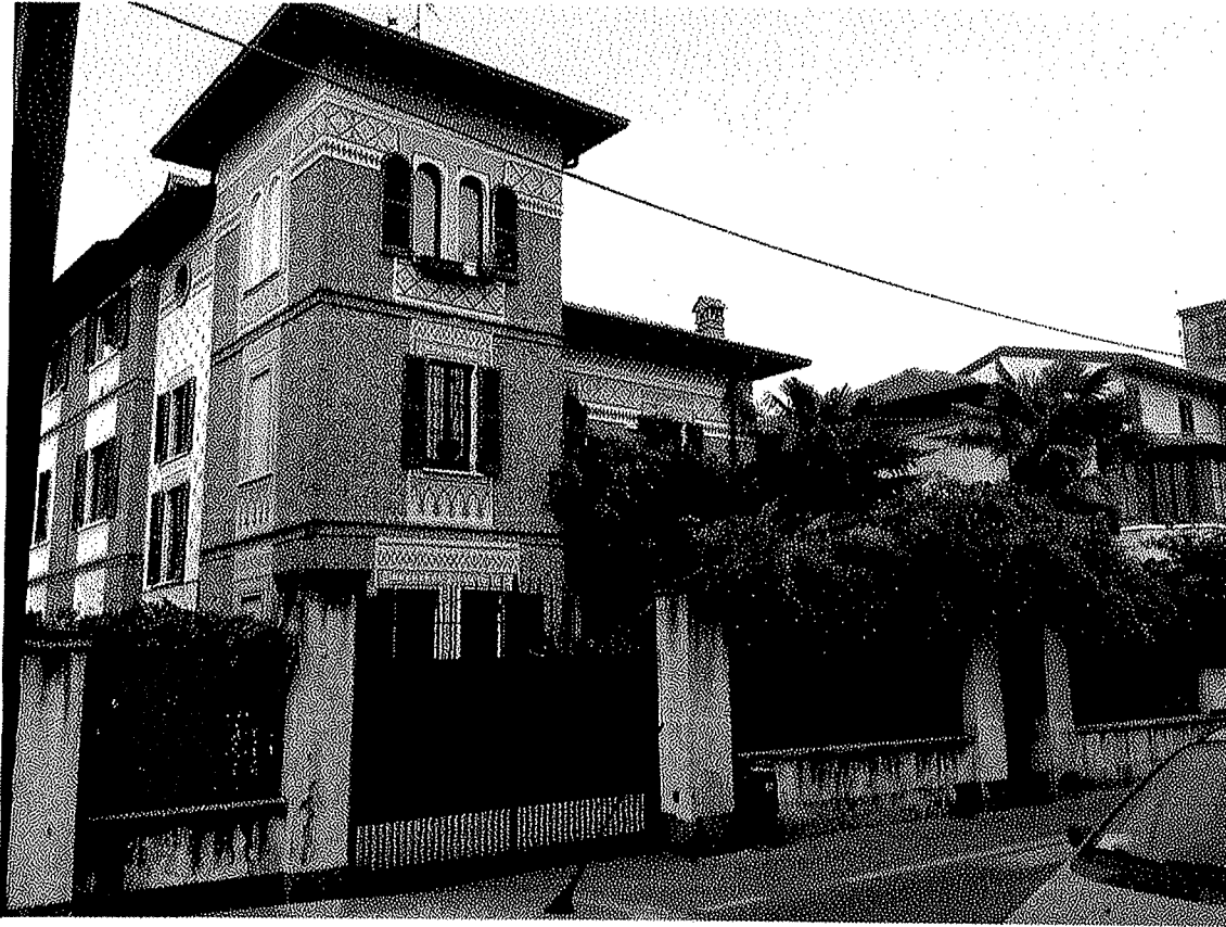
Viste della palazzina da Via Turati