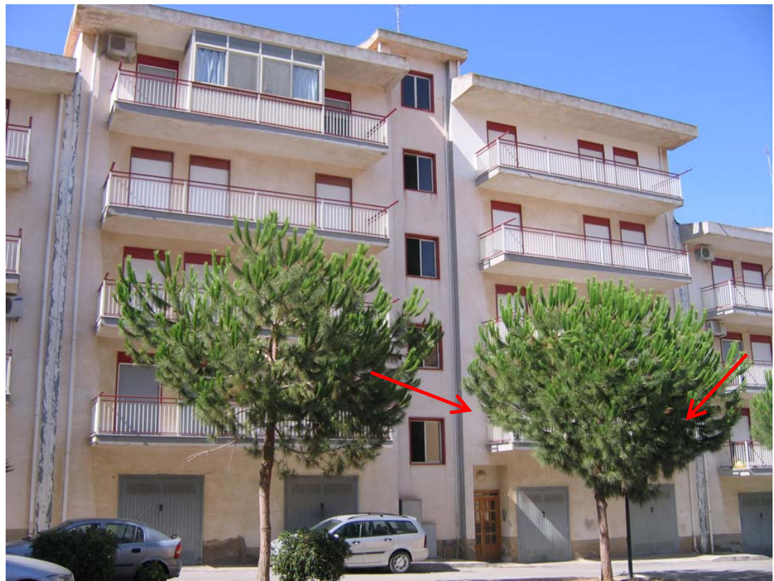
Foto n. 2 – Prospetto nord su via S. Randone e indicazione dell'appartamento