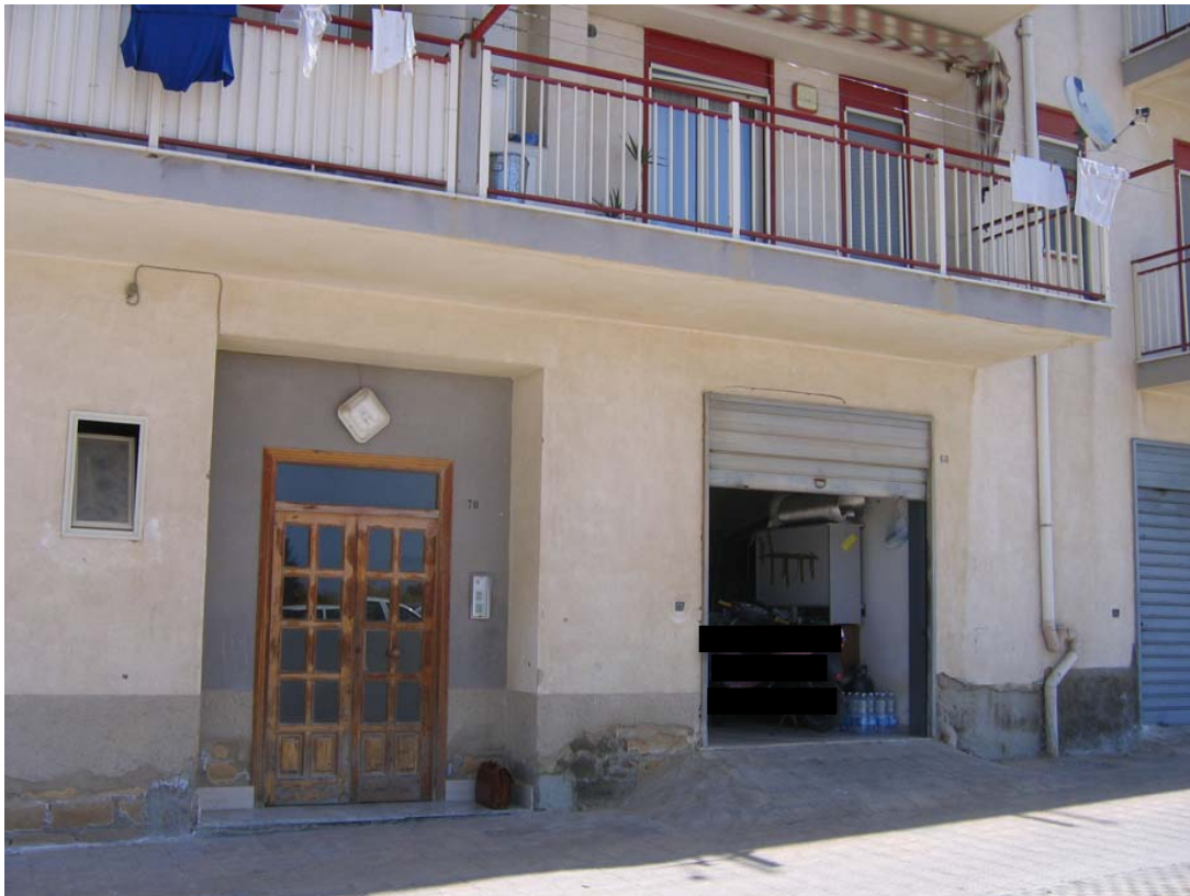
Foto n. 13 – Particolare del prospetto sud e del magazzino di pertinenza dell'appartamento