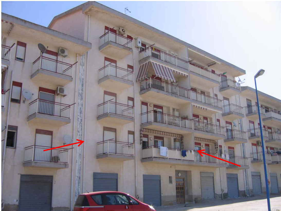
Foto n. 1 – Prospetto sud su via Buttitta e indicazione dell'appartamento