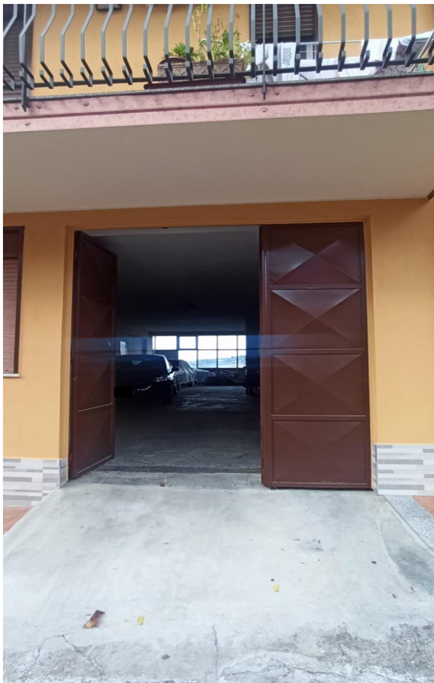
Foto 13 accesso parcheggio uso comune (non oggetto di pignoramento)