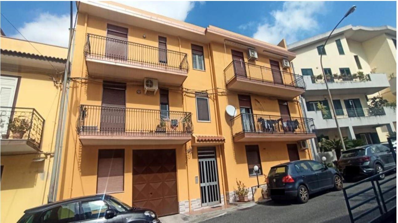
Foto 1 Prospetto principale via Roma Lato Nord