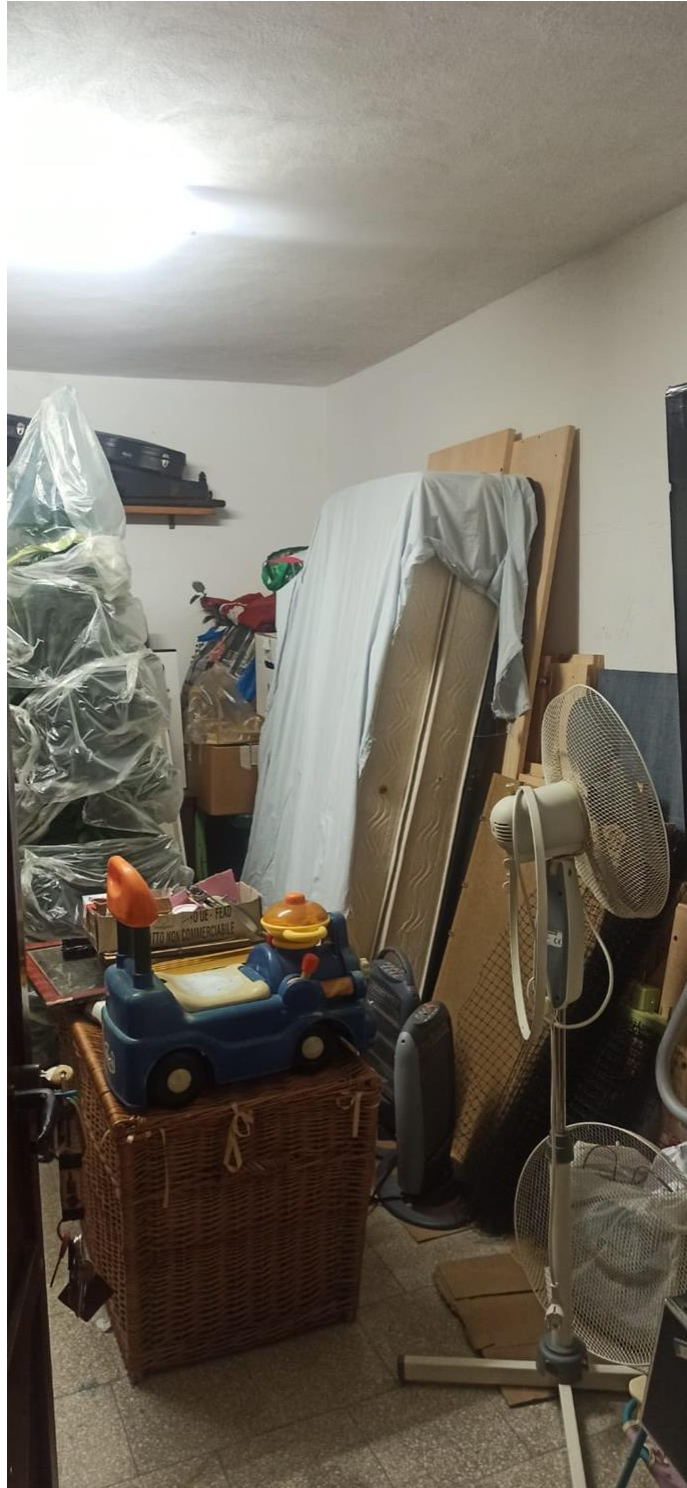
Foto 11 Seminterrato -.Magazzino sub 14 oggetto di ordinanza di demolizione.