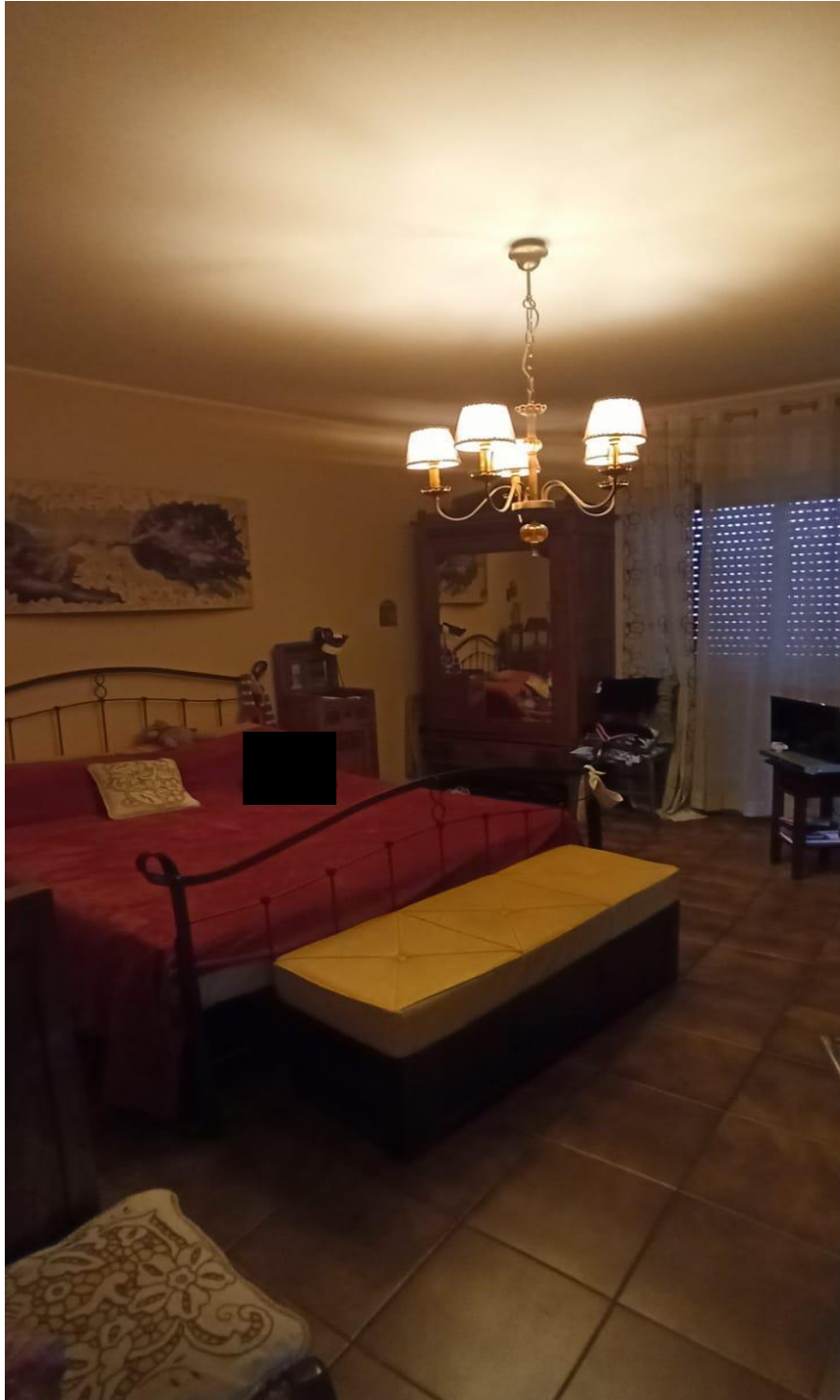
Foto 8 Appartamento primo piano - camera matrimoniale