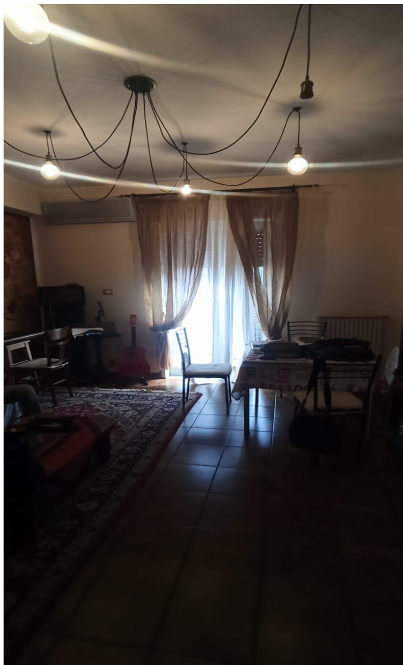
Foto 5 Appartamento primo piano-soggiorno