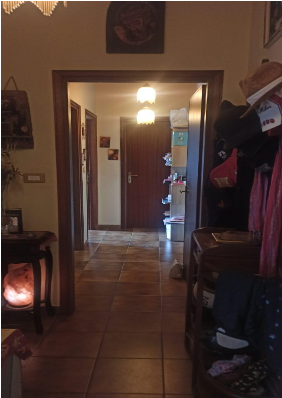
Foto 3 Ingresso appartamento sub 8 e disimpegno