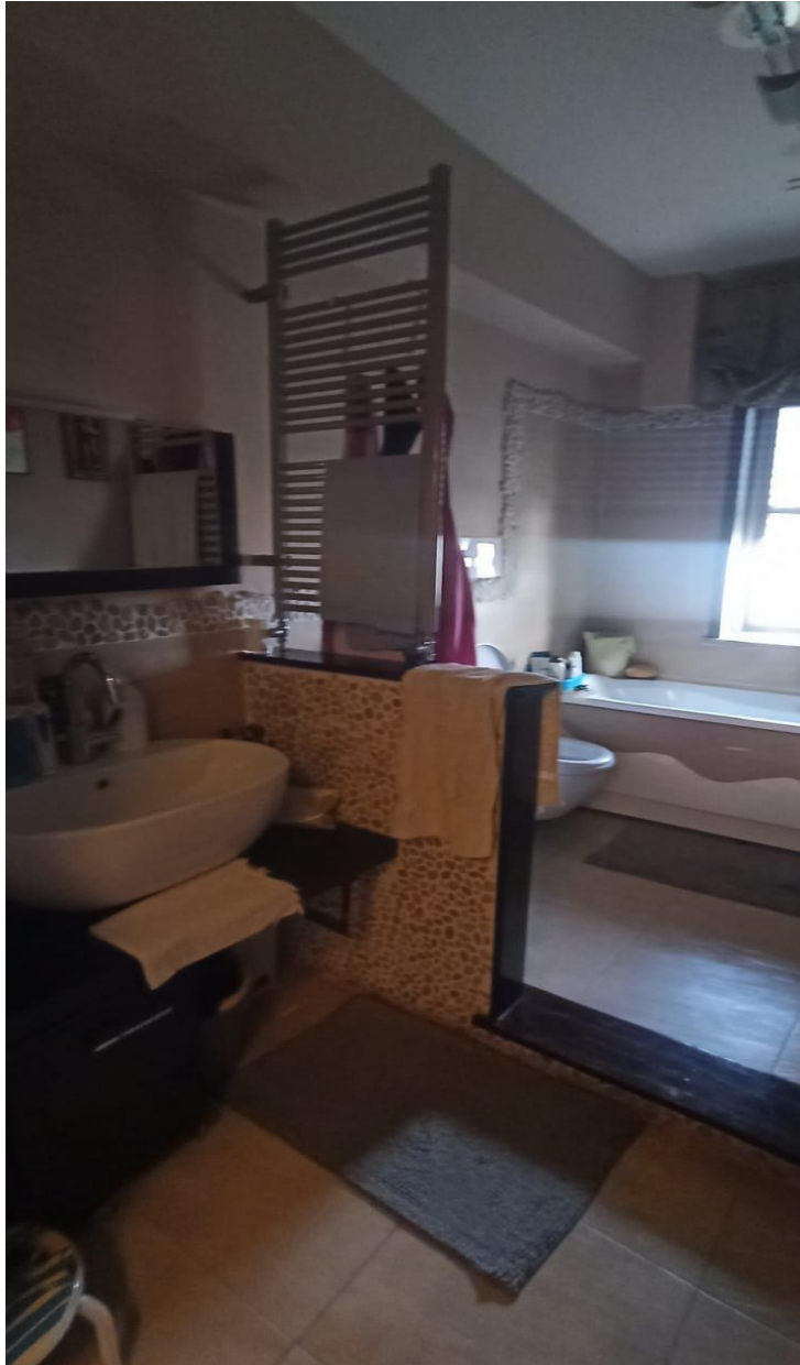
Foto 6 Appartamento primo piano- Bagno