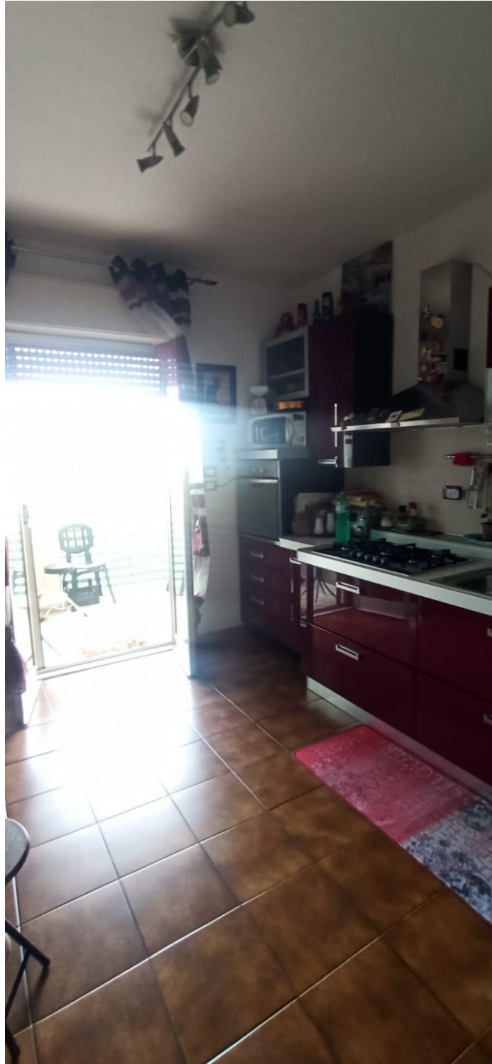
Foto 9 Appartamento primo piano-cucina