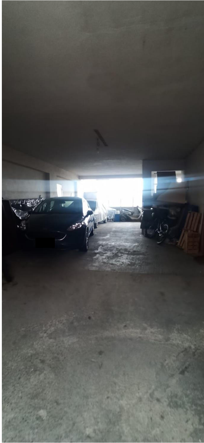
Foto 14 Piano terra- parcheggio uso comune