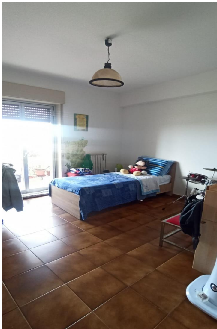
Foto 7 Appartamento primo piano -Camera da letto