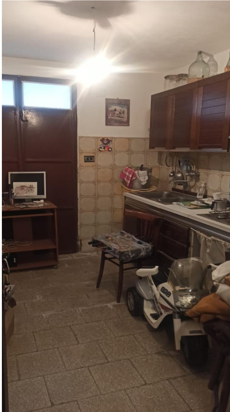
Foto 12 Seminterrato -Magazzino sub 4