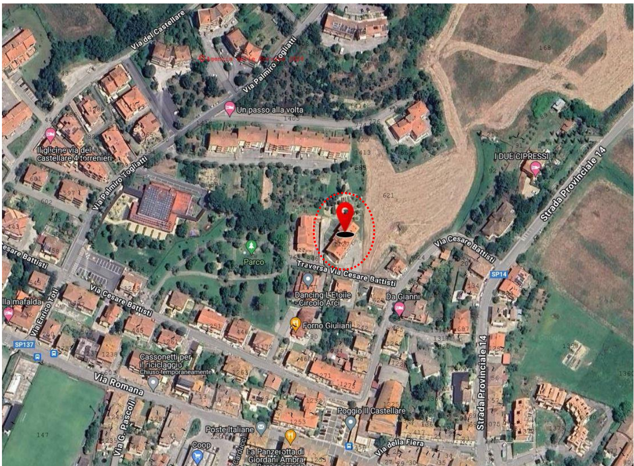
1. vista inquadramento aereo del complesso pignorato

BENI POSTI NEL COMUNE DI MONTALCINO- LOC. TORRENIERI- TRASVERSA VIA CESARE BATTISTI