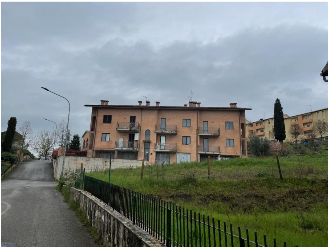
Vista frontale complesso immobiliare ospitante le u.i.u. oggetto di pignoramento