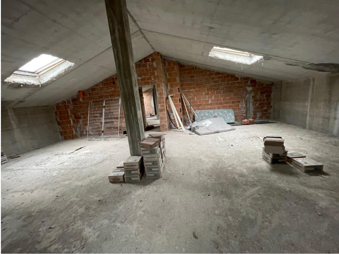
Vista locale sottotetto