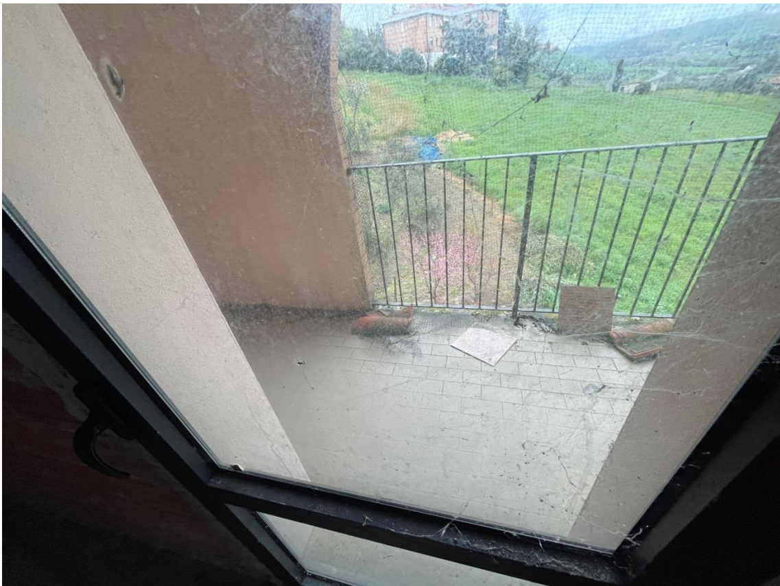
Vista balcone di pertinenza esclusiva del scale sottotetto