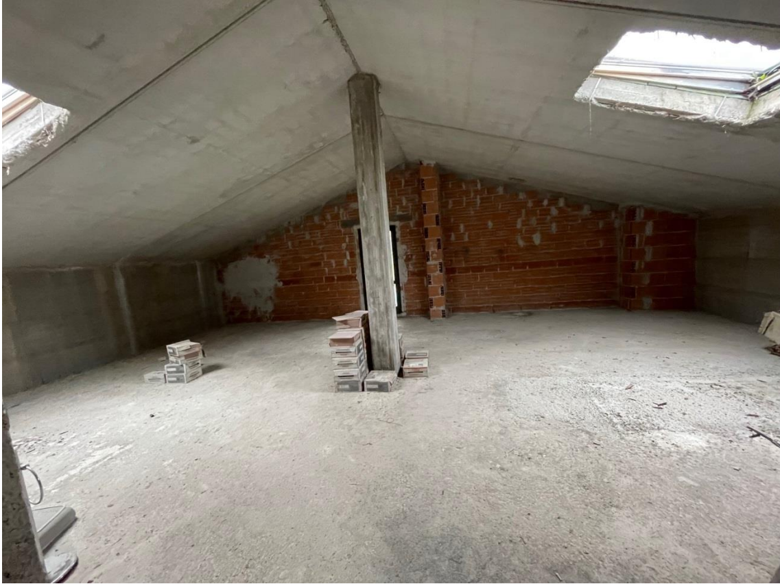
Vista locale sottotetto