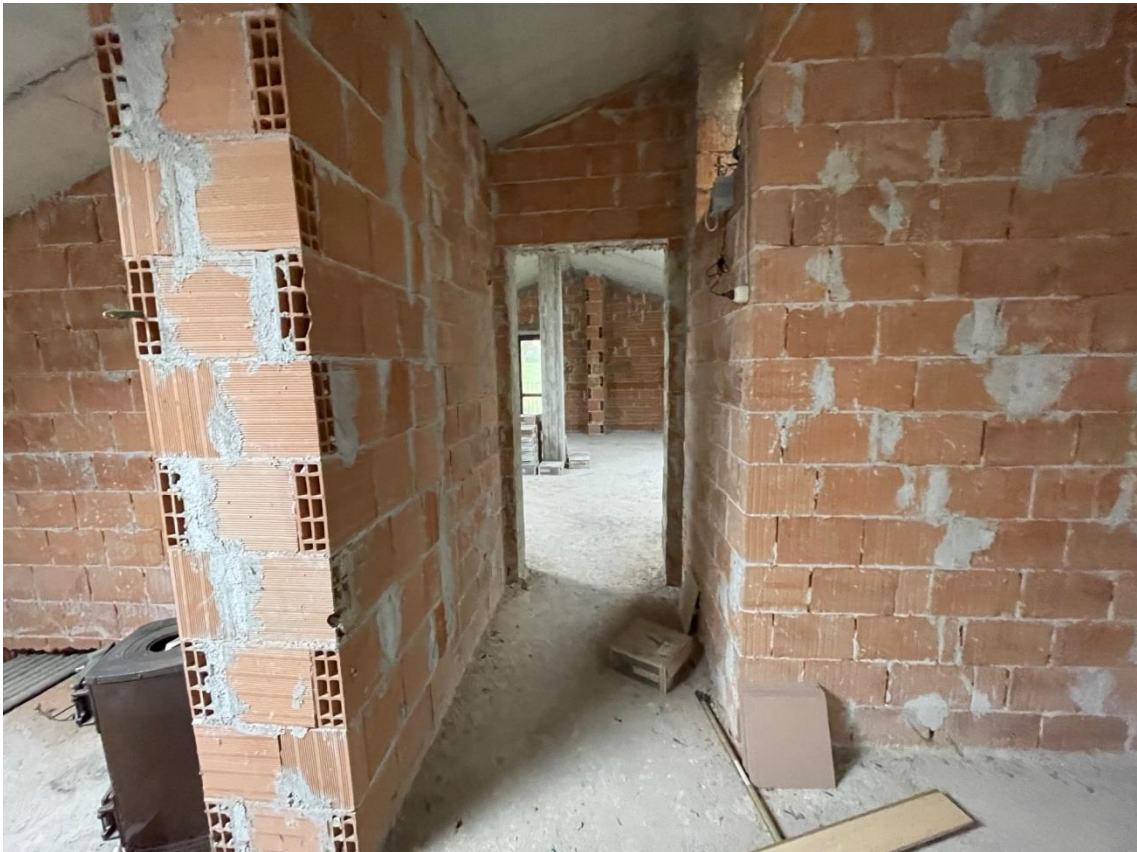
Vista locale sottotetto