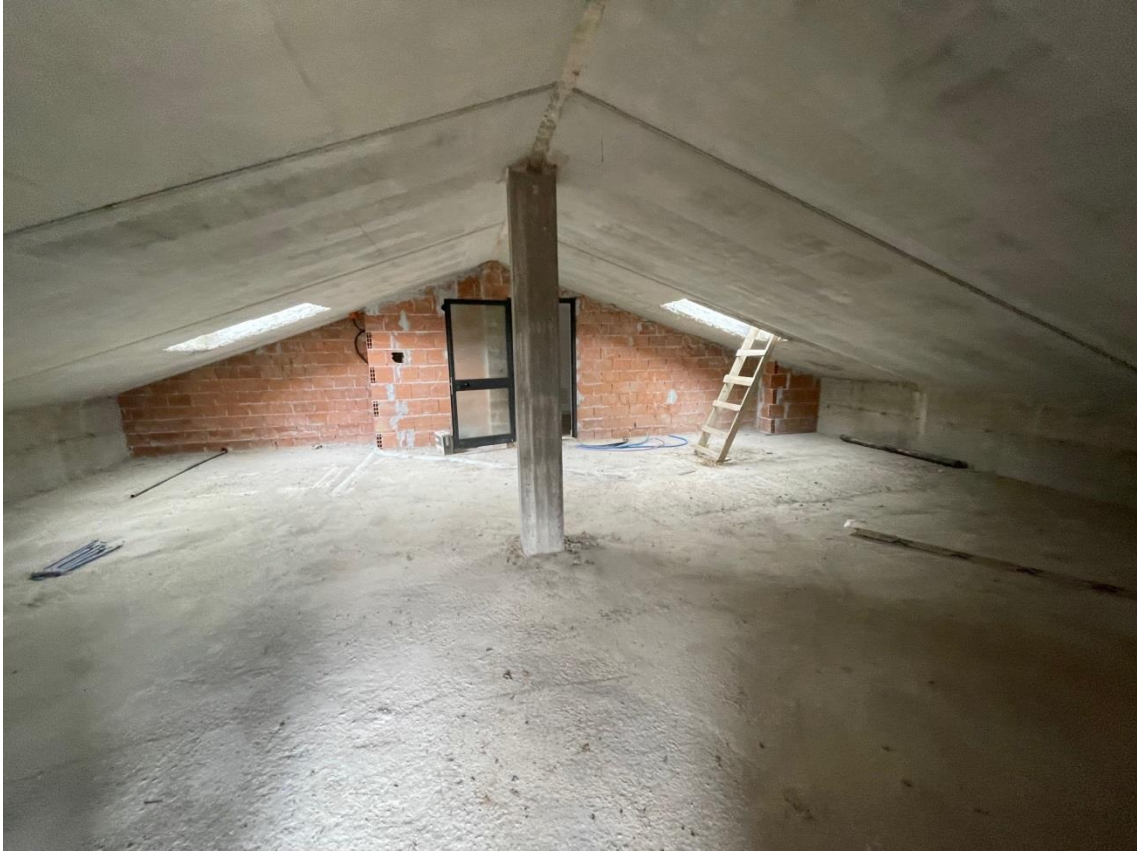
Vista locale sottotetto