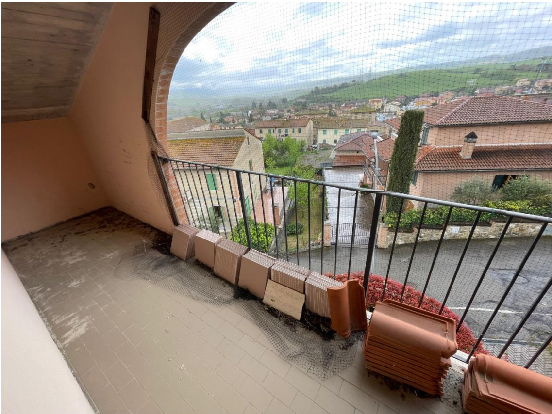
Vista balcone di pertinenza esclusiva del scale sottotetto