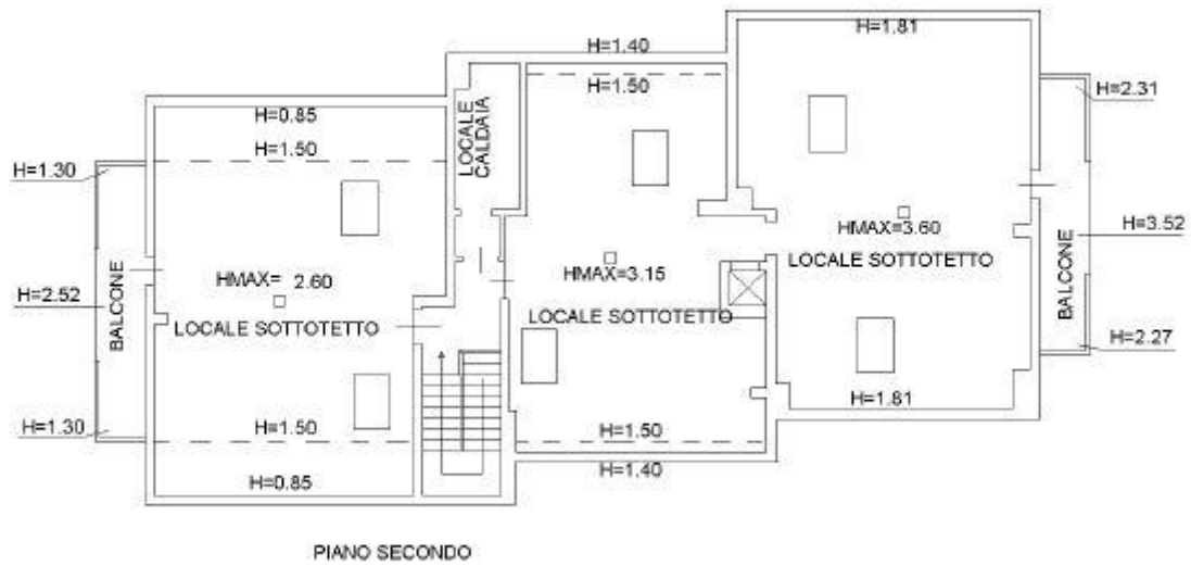
Vista planimetria catastale sub 30 - locali sottotetti accatastati come magazzini - piano 2