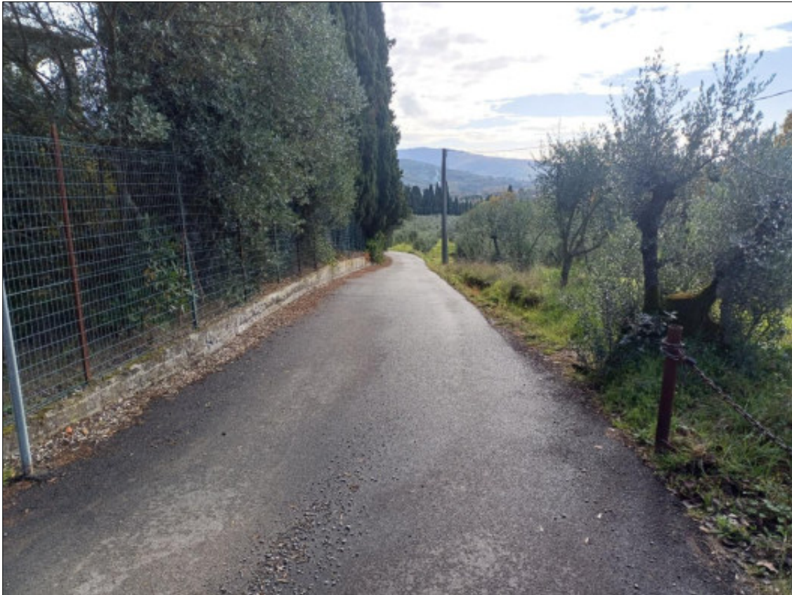
Foto 29 – via Terranuova insistente su terreni di proprietà gravati da servitù di uso pubblico