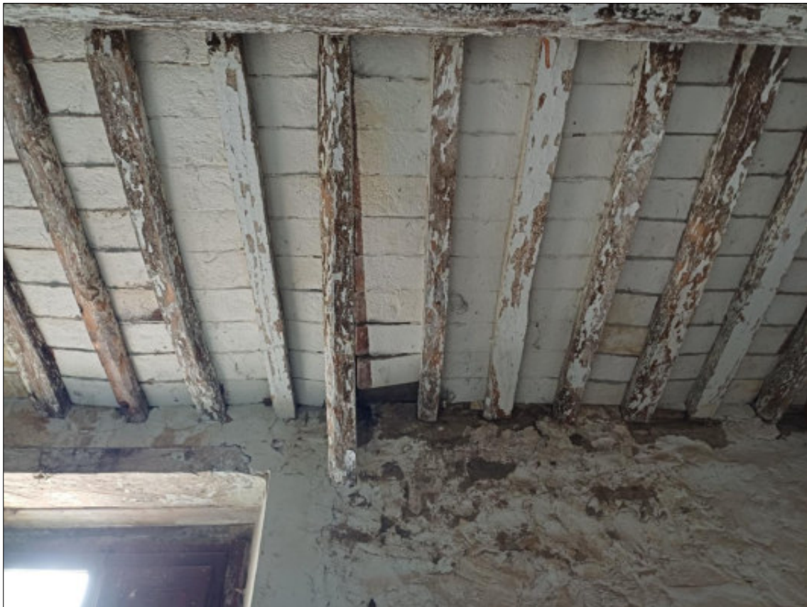
Foto 25 – particolare infiltrazione acqua piovana e travicello rotto