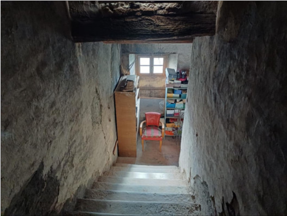
Foto 23 – vano scala collegamento piano primo-piano secondo sottotetto