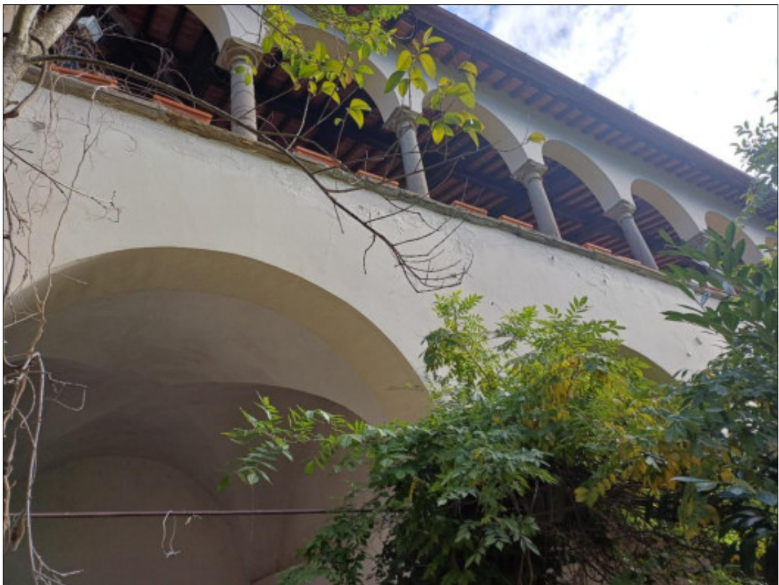
Foto 2 – porzione prospetto ovest con vista del loggiato ad archi e colonne in pietra