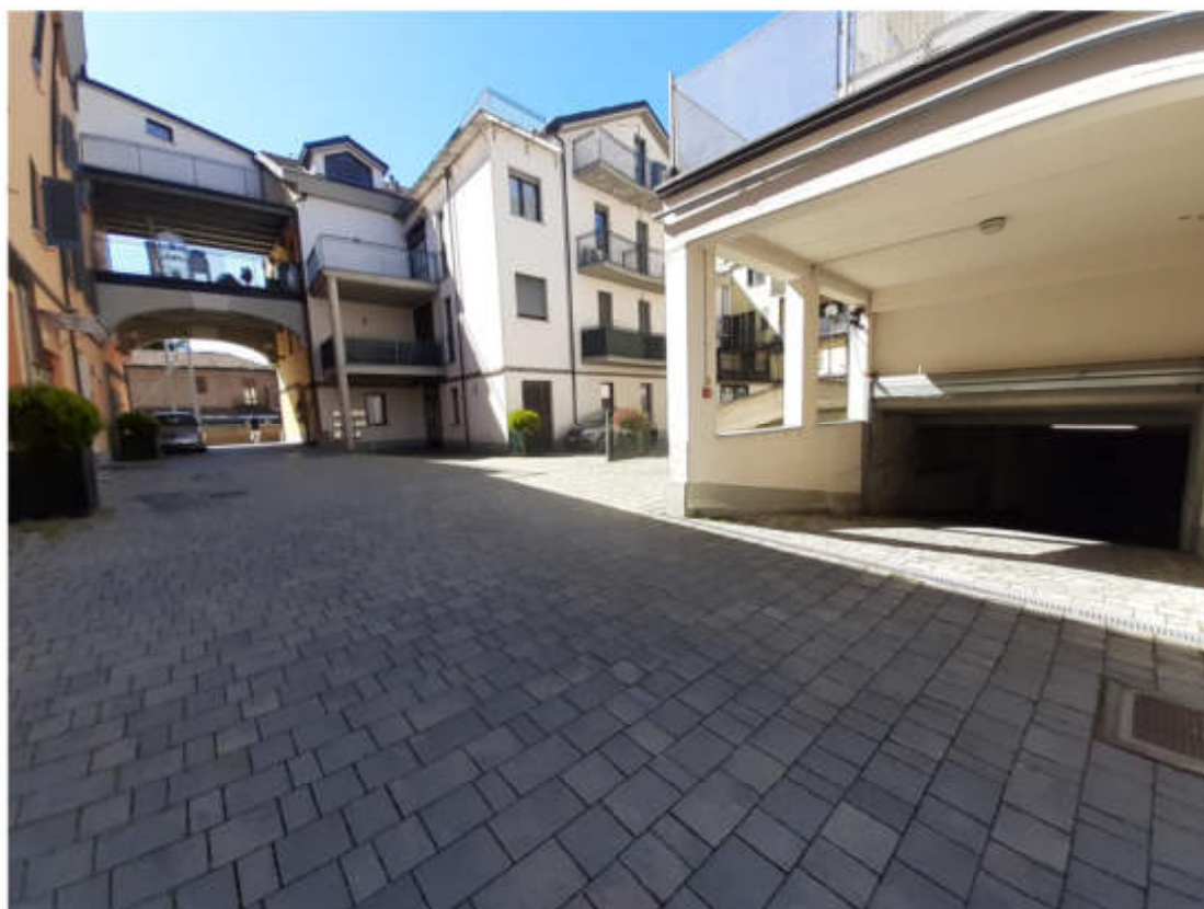
Vista dal cortile interno comune del portone carraio di accesso al piano seminterrato