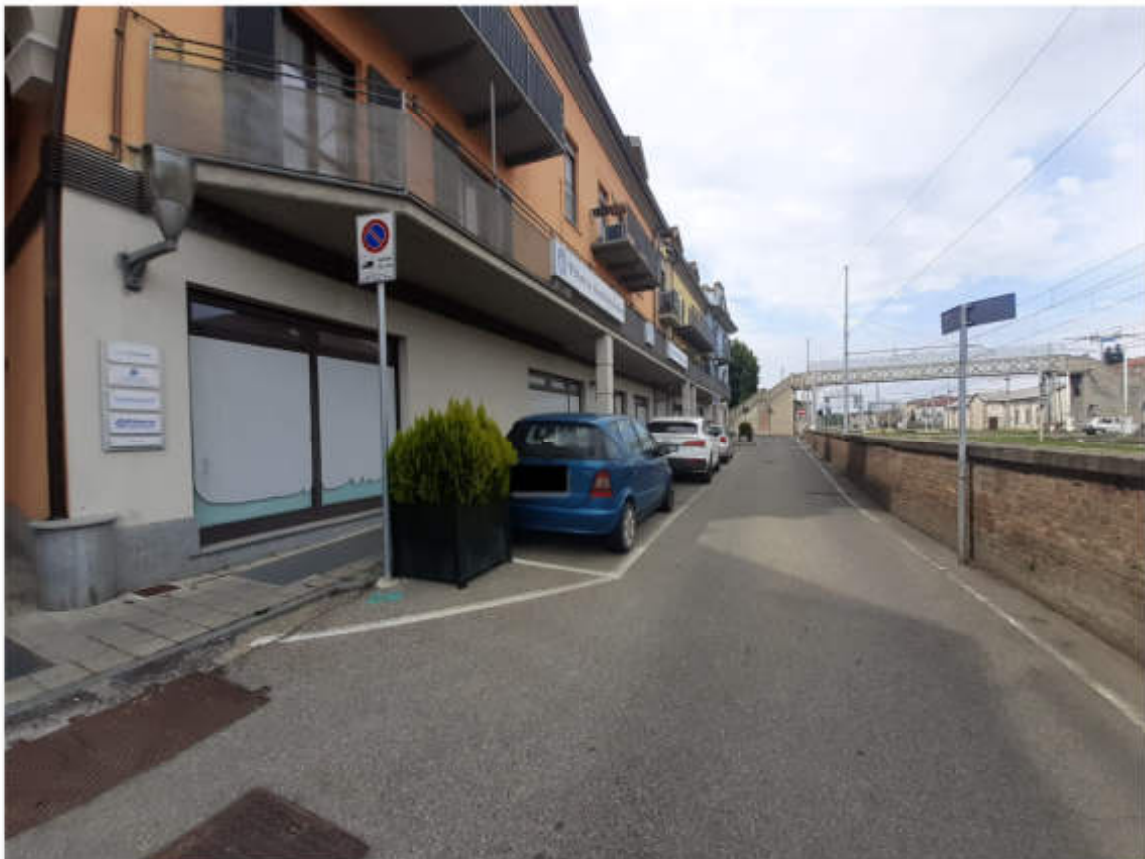
Vista strada comunale – Via San Carlo - di accesso al compendio immobiliare