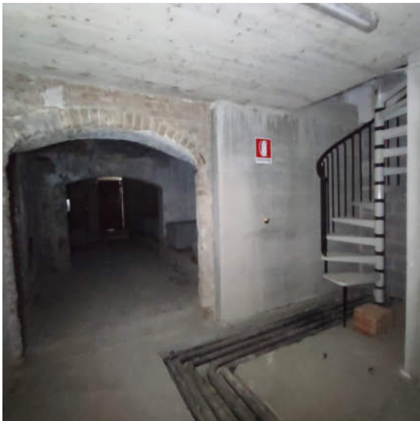
Vista interna locali in piano interrato – scala comunicazione e montacarichi