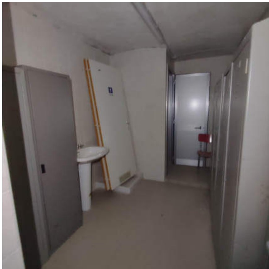
Vista interna locali in piano terra – servizi igienici