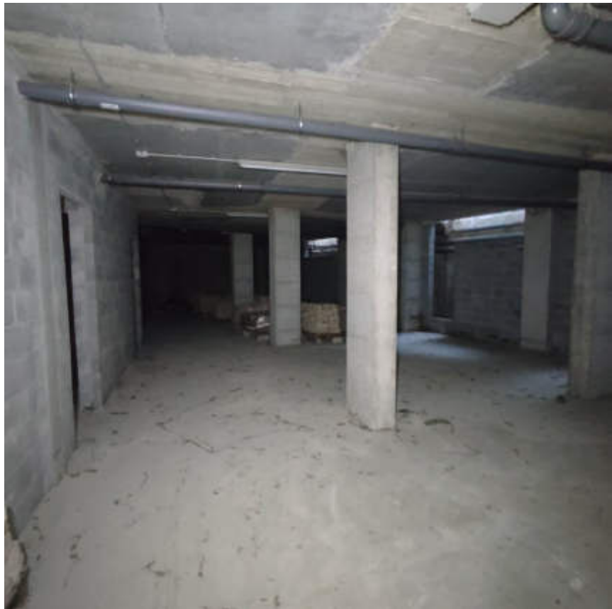
Vista interna locali in piano interrato – magazzini / locali di deposito