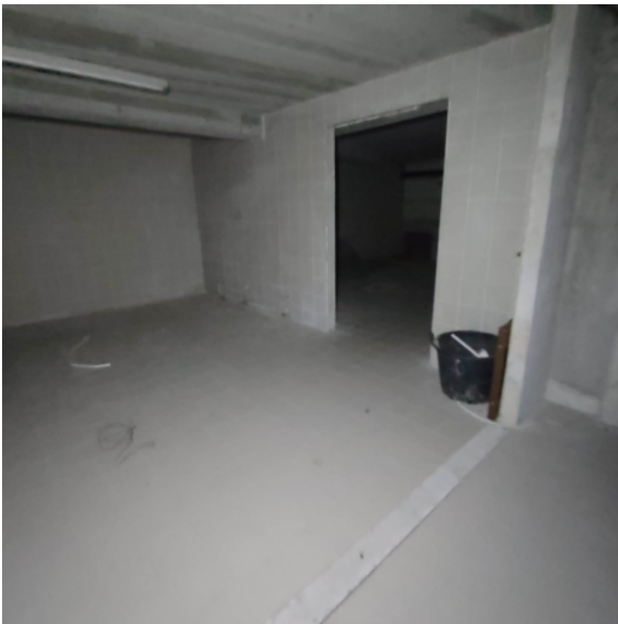
Vista interna locali in piano terra - magazzini / locali di deposito