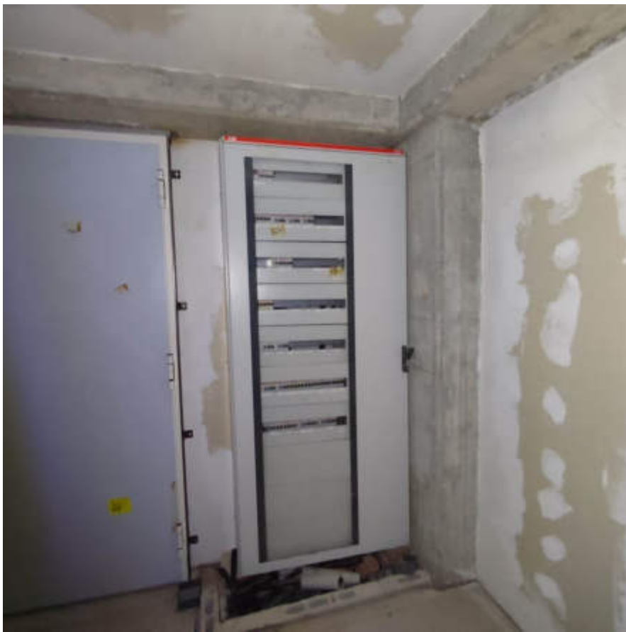
Vista interna locali in piano terra – magazzini / quadro elettrico generale