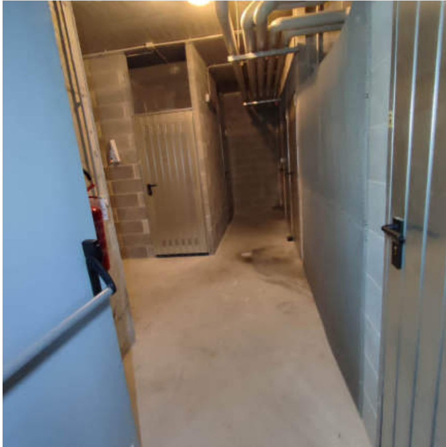
Vista dal vano scala condominiale " B " dell'accesso ai locali in piano interrato