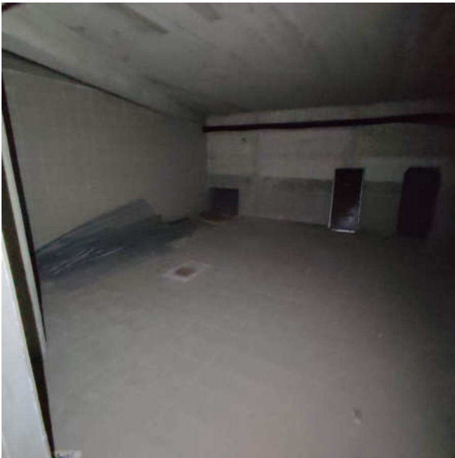
Vista interna locali in piano terra - magazzini / locali di deposito