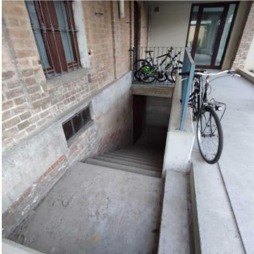
Vista dal porticato pertinenziale in fregio alla Via San Carlo dell'accesso al piano interrato