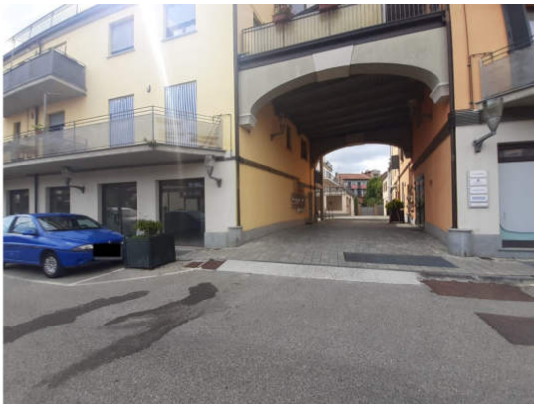
Vista dalla sede stradale di Via San Carlo dell'androne carraio di accesso al compendio immobiliare