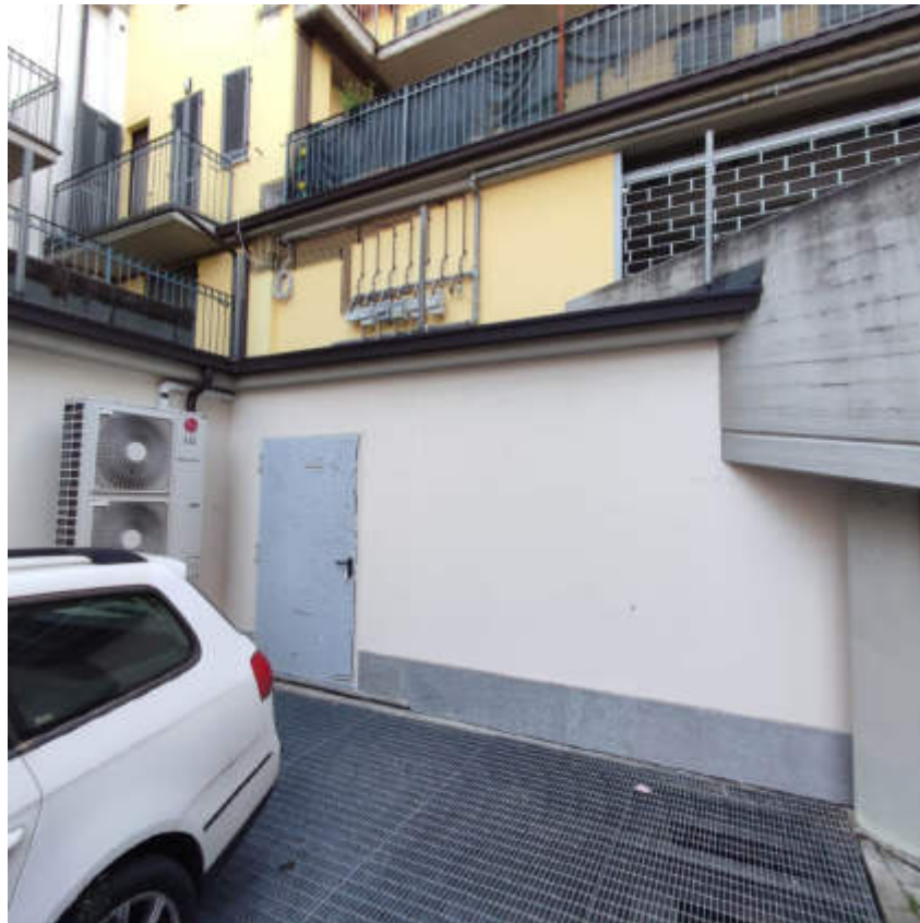
Vista dal cortile condominiale interno, dell'accesso ai locali in piano terra