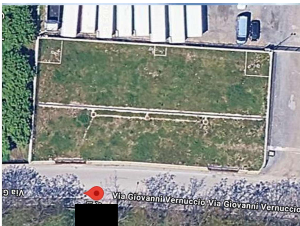
Immagine 3– Part. 2294