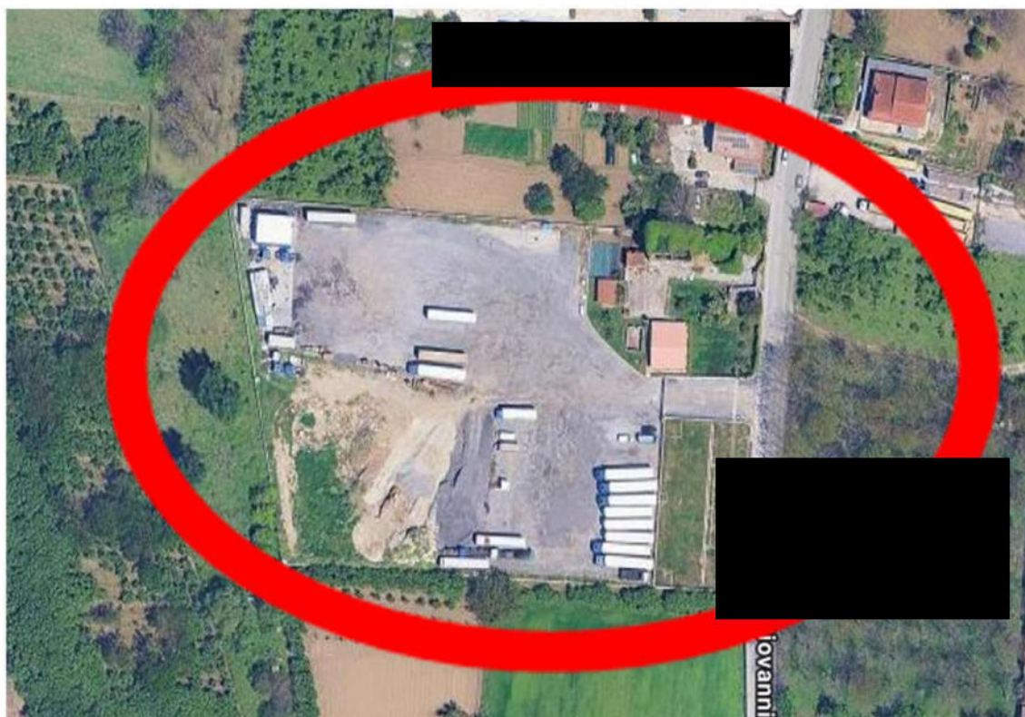
Immagine 2 – Vista Saltellitare