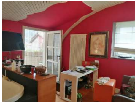
Monocale zona giorno