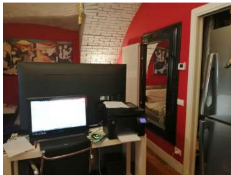
Monocale zona notte