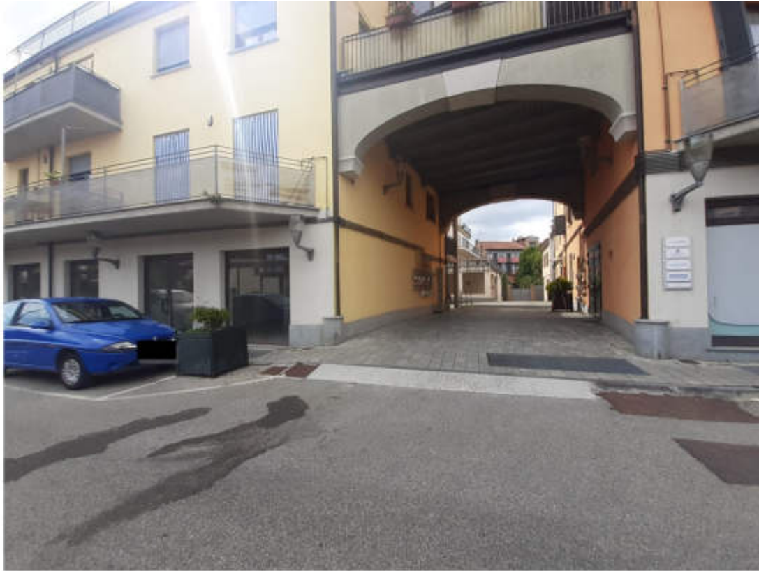
Vista dalla sede stradale di Via San Carlo dell'androne carraio di accesso al compendio immobiliare