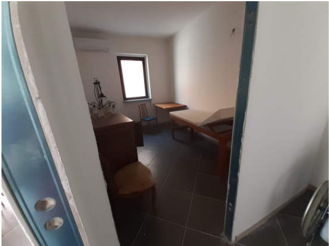
Vista interna suddivisione ambienti