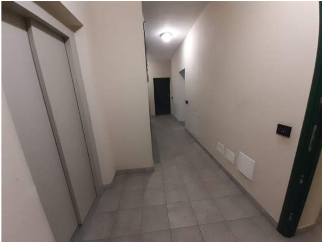
Vista interna del vano scala comune di accesso ai piani della scala condominiale "A"