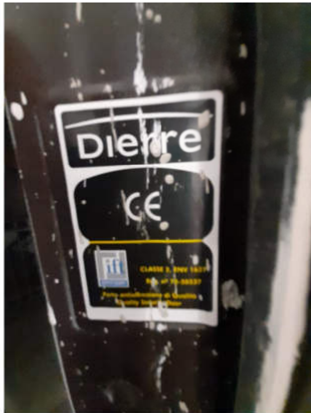
Tipologia portoncino caposcala di accesso alla I.U.I.U.