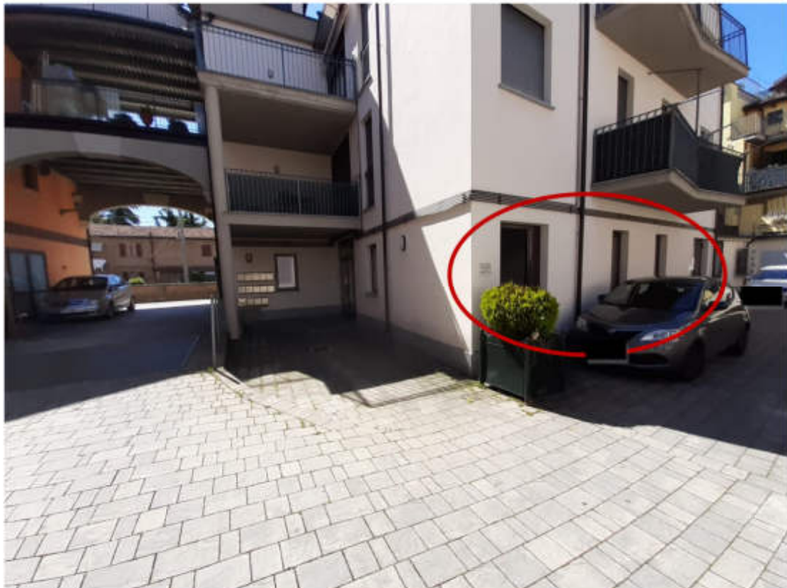
Localizzazione esterna affaccio U.I.U. su cortile comune interno