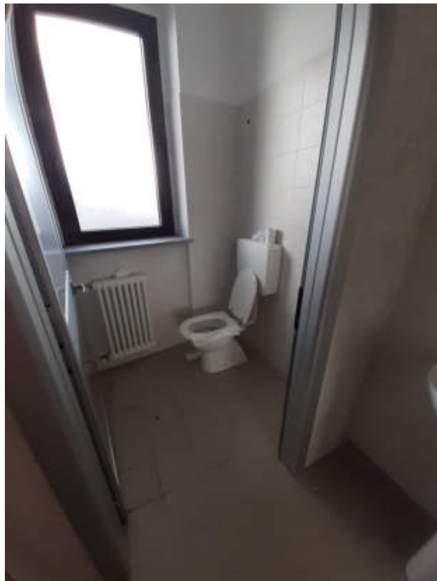
Vista interna locale bagno