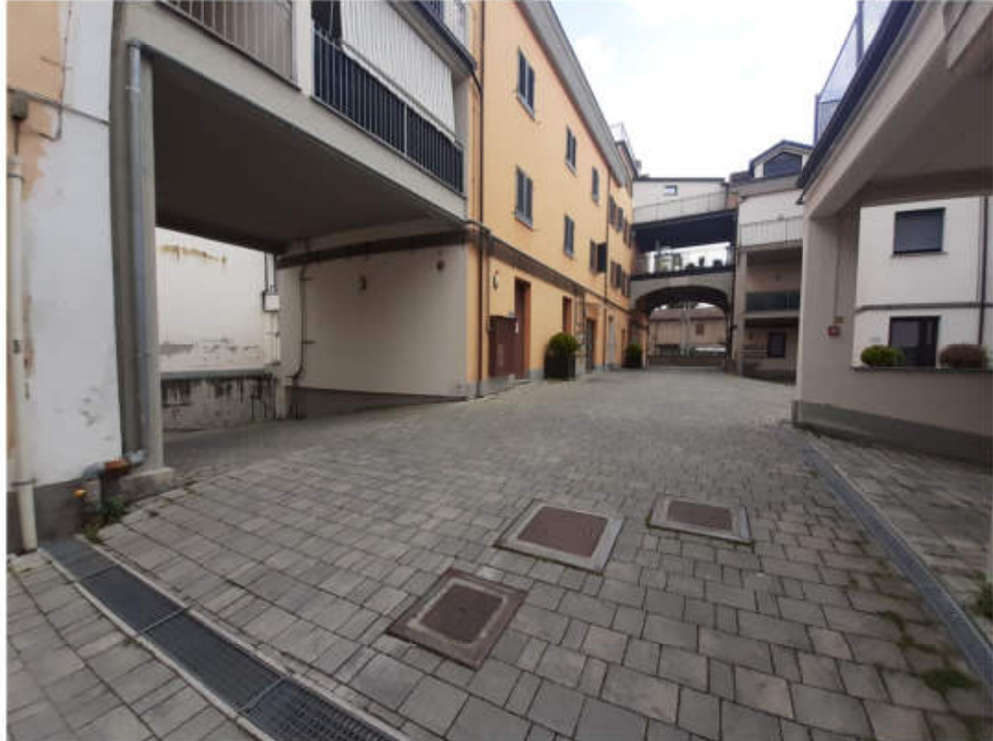
Vista del cortile interno comune alle U.I.U.