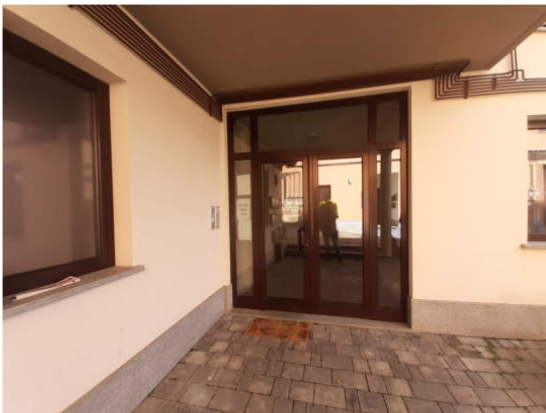
Vista dal cortile interno comune del portone di accesso alla scala condominiale " A "