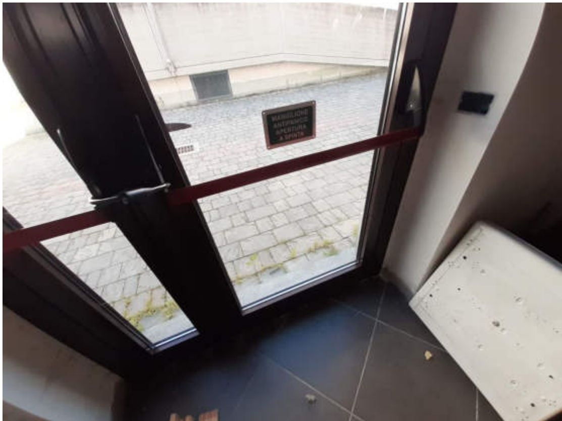
Vista particolare tipologia serramenti a servizio dei locali