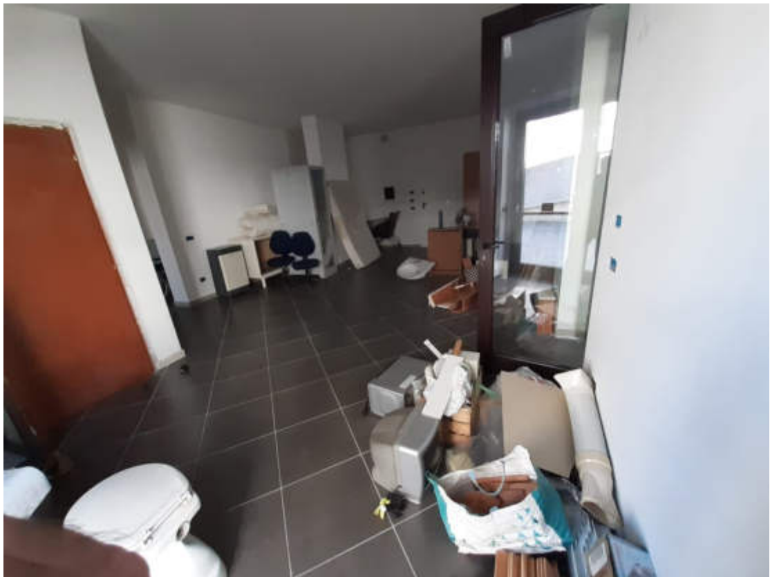
Vista interna suddivisione ambienti