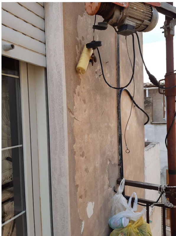
Figura 4 - vista dal balcone lato via Alonge