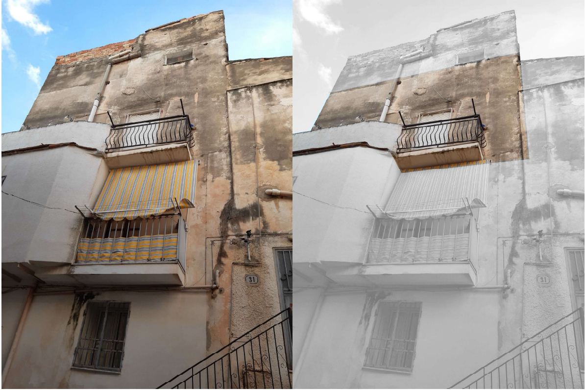
Figura 6 - vista del balcone lato c.le Interrante, con selezione del terzo piano