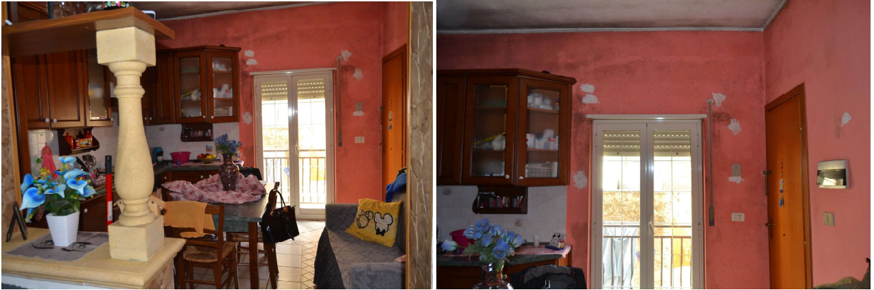
Figure 8 – cucina