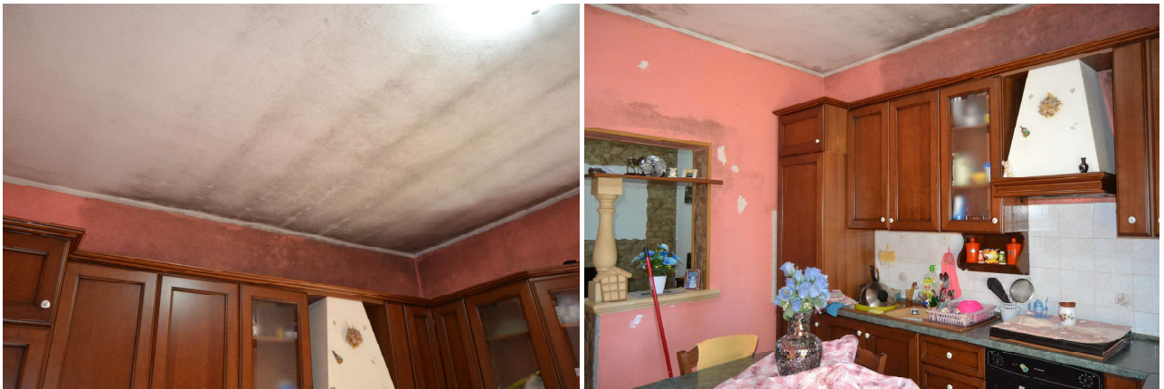
Figura 9 – cucina – soggettiva sull'insalubrità dei muri