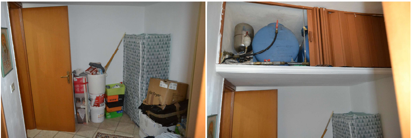
Figura 12 – ripostiglio di passaggio tra camera da letto e servizio