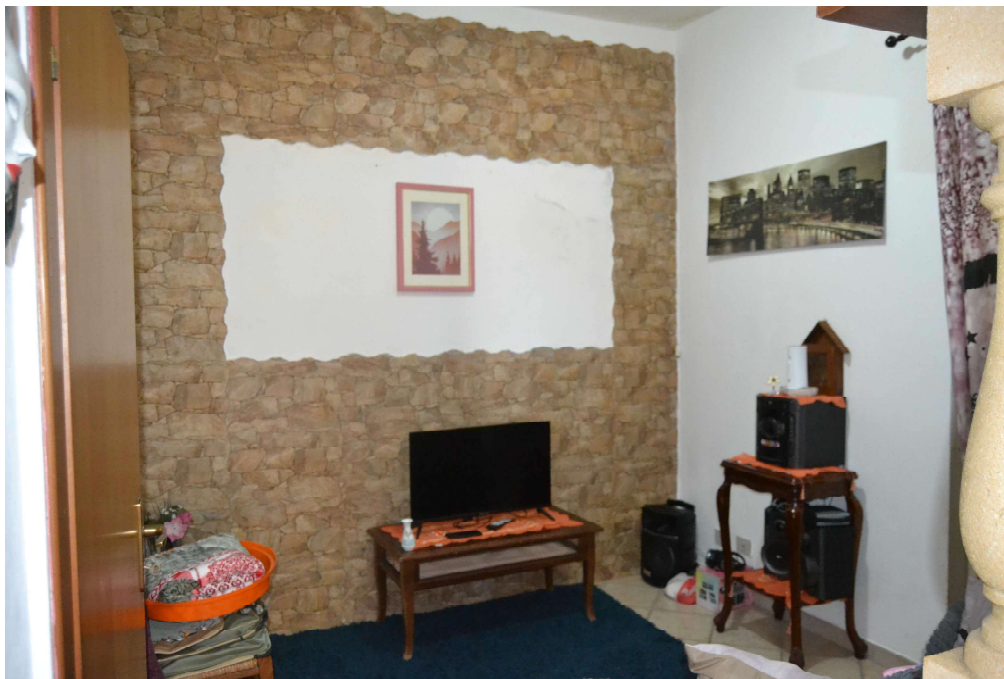
Figura 10 – piccolo soggiorno