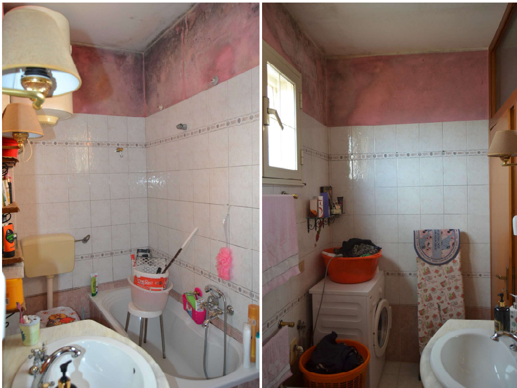
Figura 13 – servizio igienico – in dettaglio evidente tracce di umidità da infiltrazione e da condensa