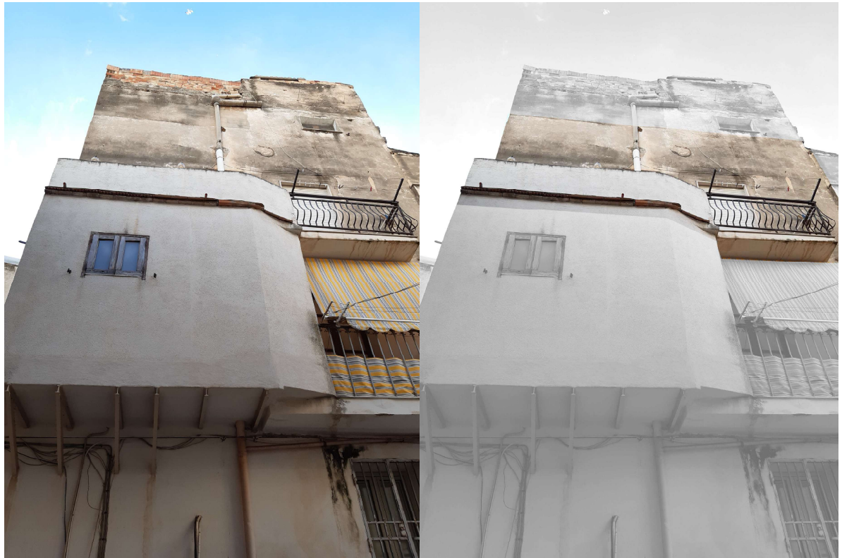
Figura 7 - lato prospetto c.le Interrante, con selezione del terzo piano