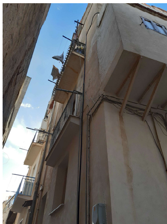
Figura 5 - vista del prospetto da via Alonge e dallo spigolo via Alonge-c.le Interrante