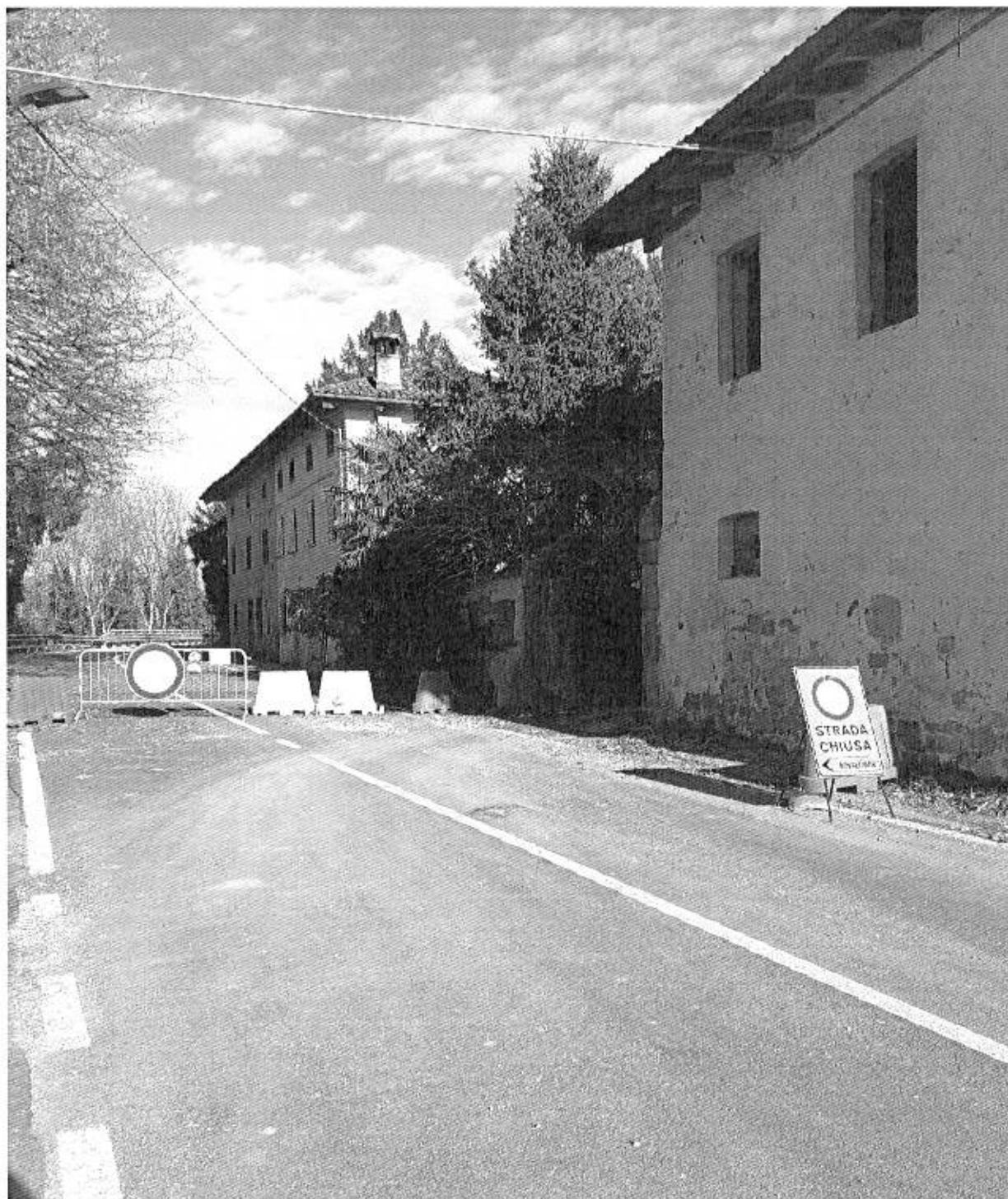
Foto n° 01 - Conseguentemente all'evento calamitoso estremo accorso il 16/17 novembre 2025 (frana dal Colle di San Giorgio a Brazzano) assunto fin alle cronache nazionali, per motivi precauzionali la Strada Provinciale 14 è stata chiusa al transito lungo il tratto Brazzano - Vencò (prossima al torrente Judrio).

Ora, delle particelle in questione (pp.cc. 221/1, 221/3, 221/4) solo percorrendo tale tratto di Strada, si sarebbero potute acquisire immagini fotografiche (dirette per quanto sommarie) dei fitti Boschi di Robinia caratterizzanti le stesse.