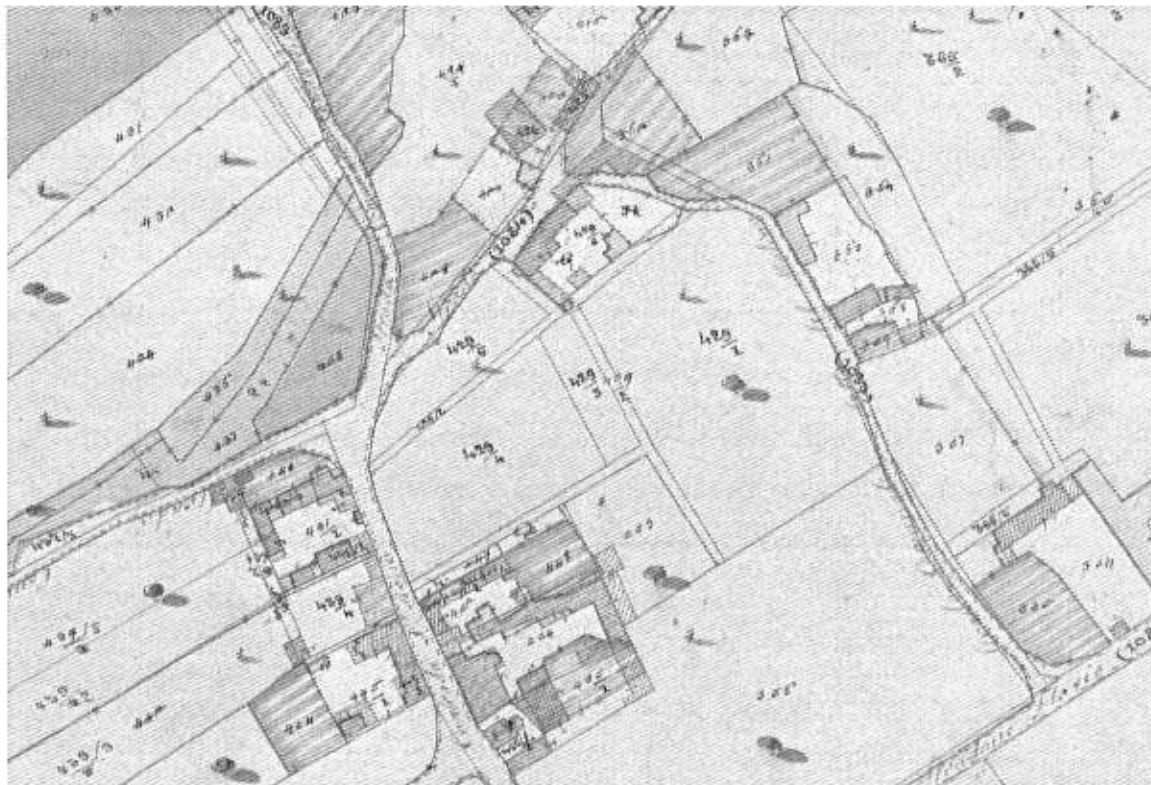
ANNO 1811 - Stralcio Mappa: visibile il frazionamento della p.c. 429 e l'ampliamento del fabbricato in questione sulla "corte" marcata G (p.c. 429/6).