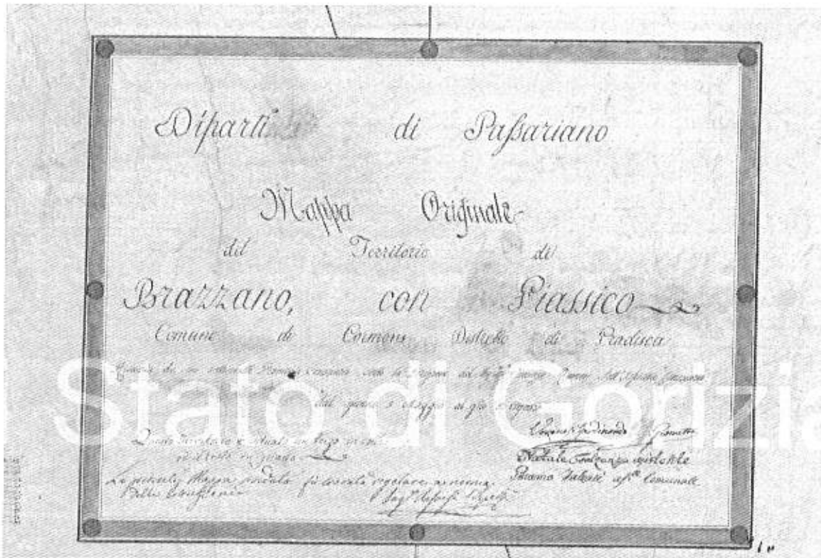
ANNO 1811 - Dipartimento di Passariano, Mappe originali del Territorio di Brazzano, con Giassico, Comune di Cormons, Distretto di Gradisca (ARCHIVIO DI STATO DI GORIZIA).

- ARCHITETTURA - URBANISTICA - ARREDO INTERNI - CONSULENTE TECNICO - TRIBUNALE DI GORIZIA -