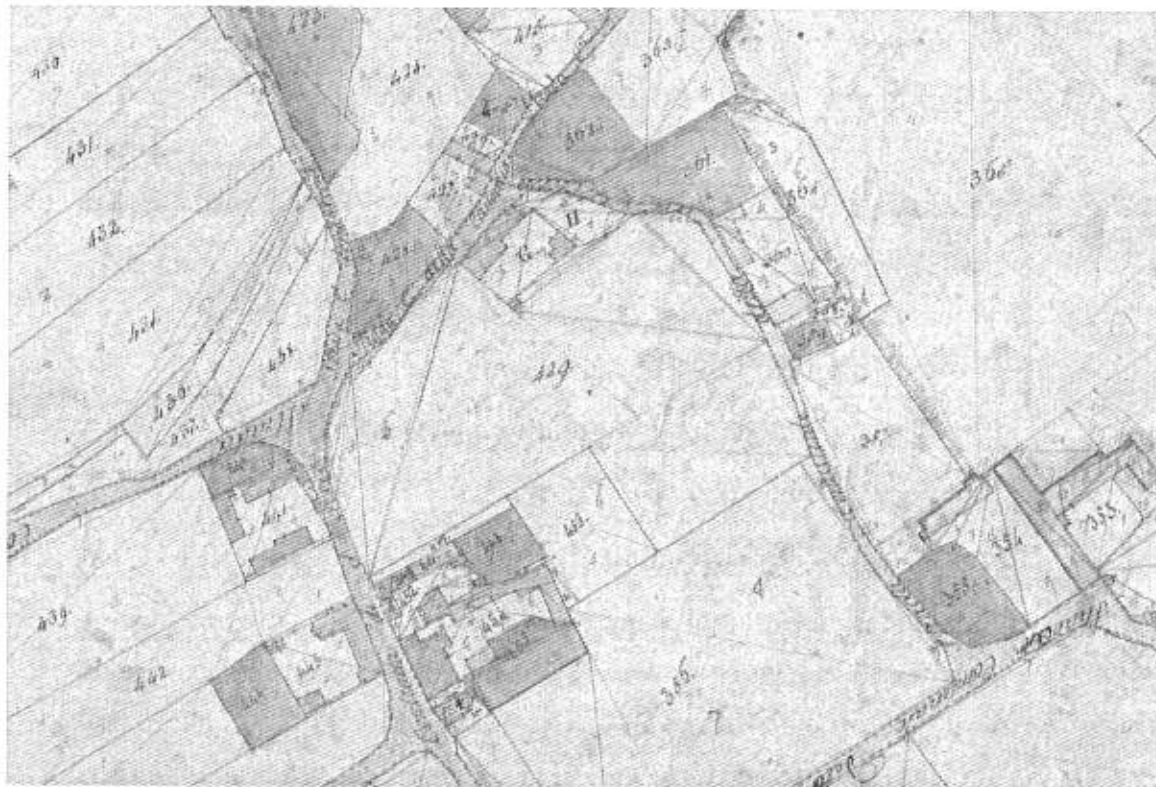
ANNO 1811 - Stralcio di Mappa: visibile la p.c. 429 originaria e la porzione del fabbricato in questione sulla "corte" marcata G (ARCHIVIO DI STATO DI GORIZIA).