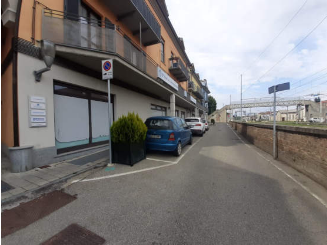
Vista da sedime stradale pubblico della U.I.U. commerciale oggetto di valutazione