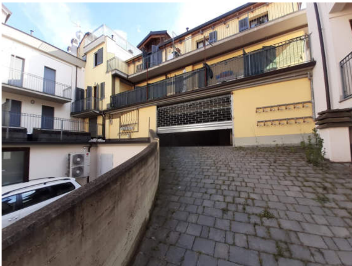
Vista della corsia comune e cancello di accesso alla corsia di manovra al piano terra rialzato