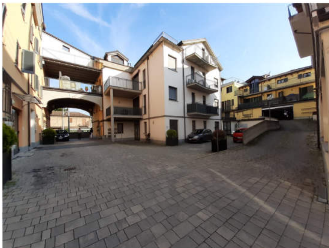
Vista dal cortile interno comune del portone carraio di accesso al piano terra rialzato