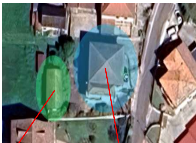
Manufatto allo stato grezzo Cantina/rimessa