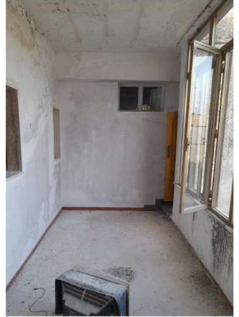
Figura 31 – Foto 25 :Vista Veranda