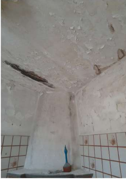
Figura 29 –Foto 23: Vano Cucina