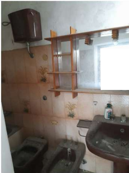
Figura 32 –Foto 26: Vano Bagno