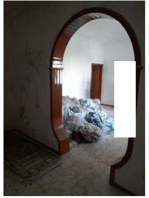
Figura 28 – Foto 22 :Vista da Ingresso a Sogg.