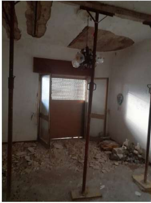
Figura 27 – Foto 21: Vano Letto