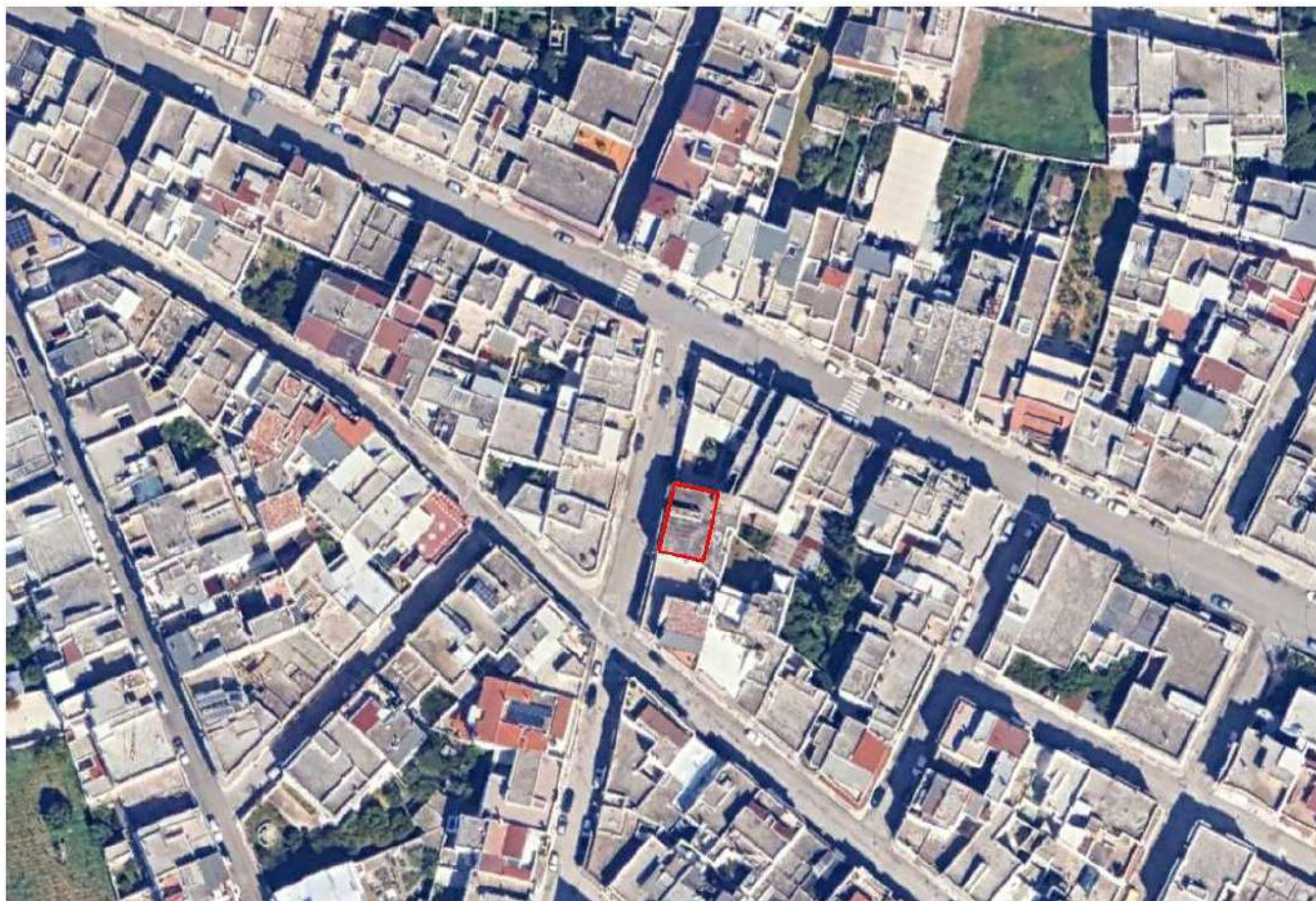
Figura 1 - Ortofoto circondario ed individuazione fabbricato ed uiv