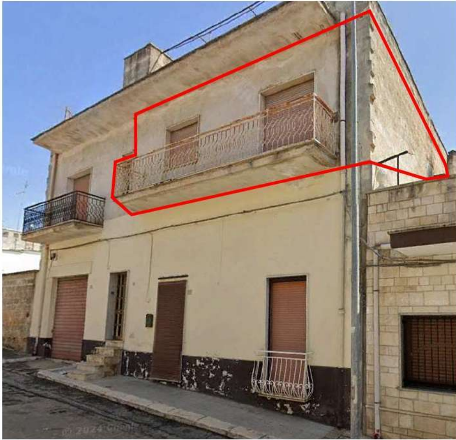
Figura 25 -Prospetto via Alessandro Volta: individuazione Uiu Fg 42- Plla 142 Sub 6