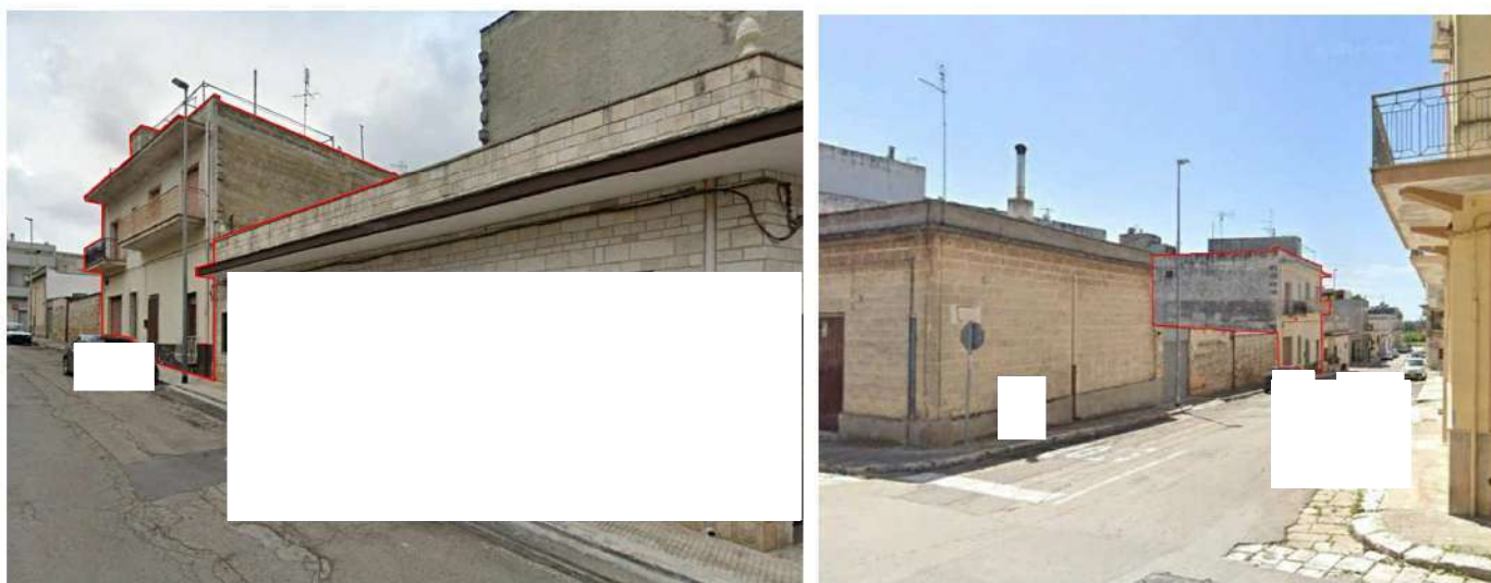
Figura 2/3 - Foto d'insieme scorcio e individuazione immobile su Via Alessandro Volta: 2) scorcio Sud->Nord 3) scorcio Nord->Sud