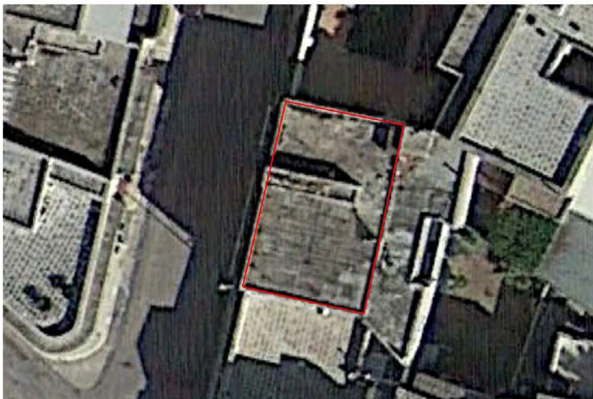
Figura 34 –Vista aerea individuazione Uiu Fg 42- Plla 142 Sub 7