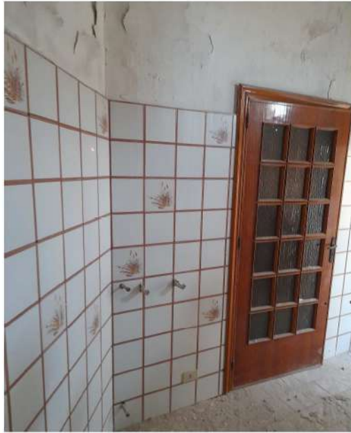
Figura 30 – Foto 24: Vano Cucina