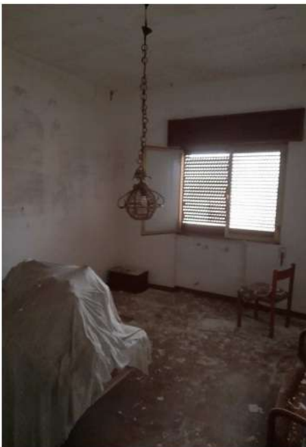
Figura 26 –Foto 20: Vano Letto