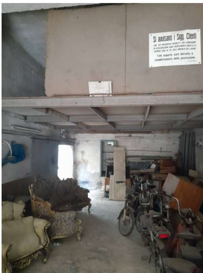
Figura 6 – Foto.2: vista insieme interno