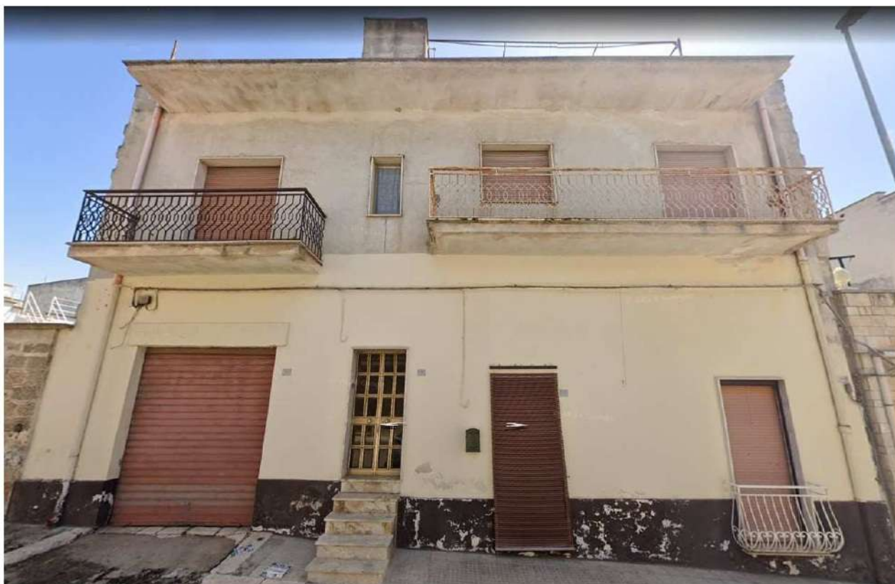
Figura 4 - Foto prospetto via Alessandro Volta: Ripresa intero Fabbricato