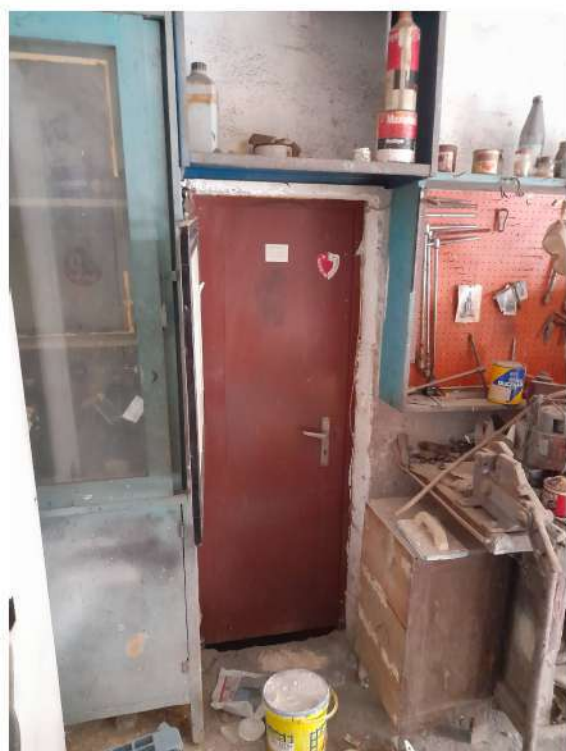
Figura 8 – Foto.4: vista accesso ripostiglio