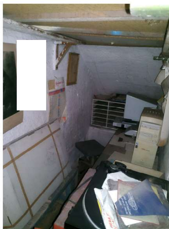
Figura 9- Foto.5: Vano ripostiglio