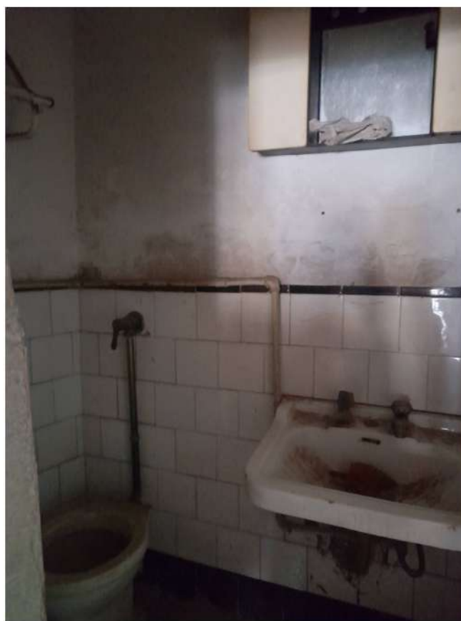
Figura 7- Foto.3: Vano igienico Wc