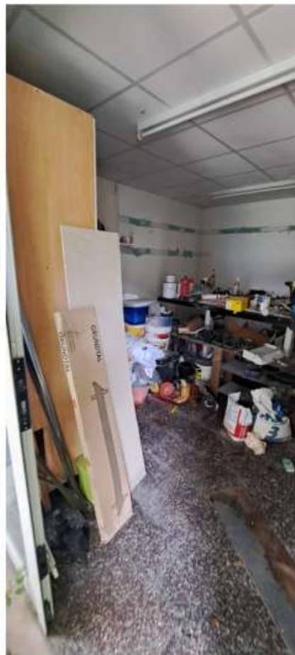
14_deposito piano terra