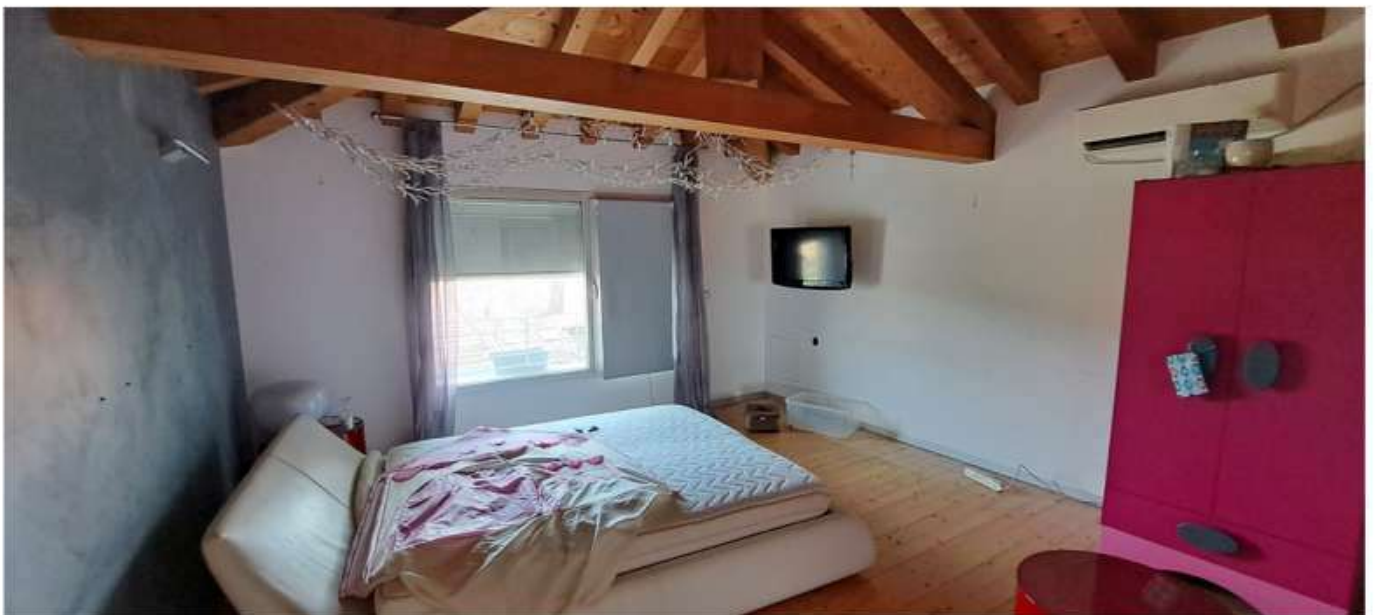
43_camera matrimoniale p2