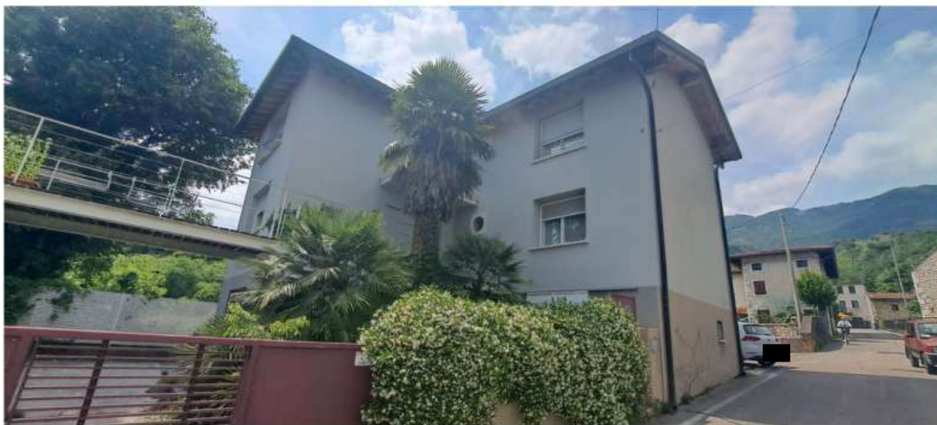
1_ fronte su via vallone