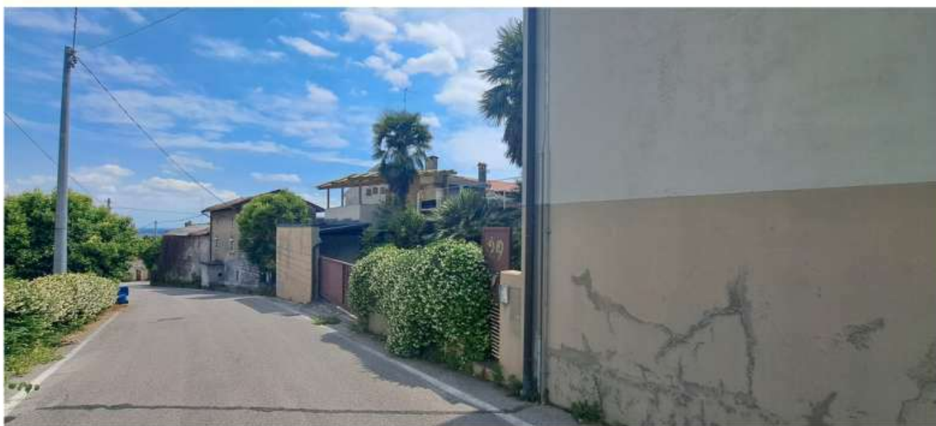
3_frente via vallone