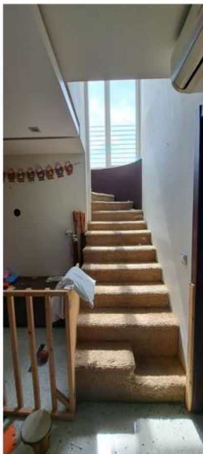
39_scala al p2