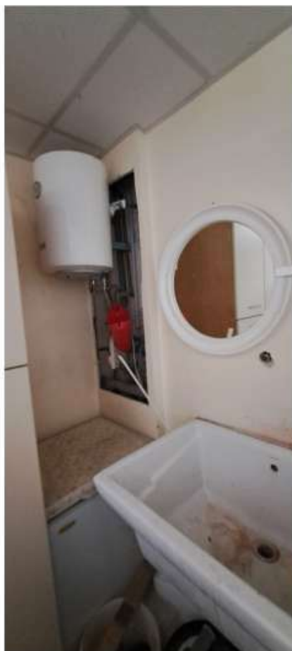
16_deposito piano terra