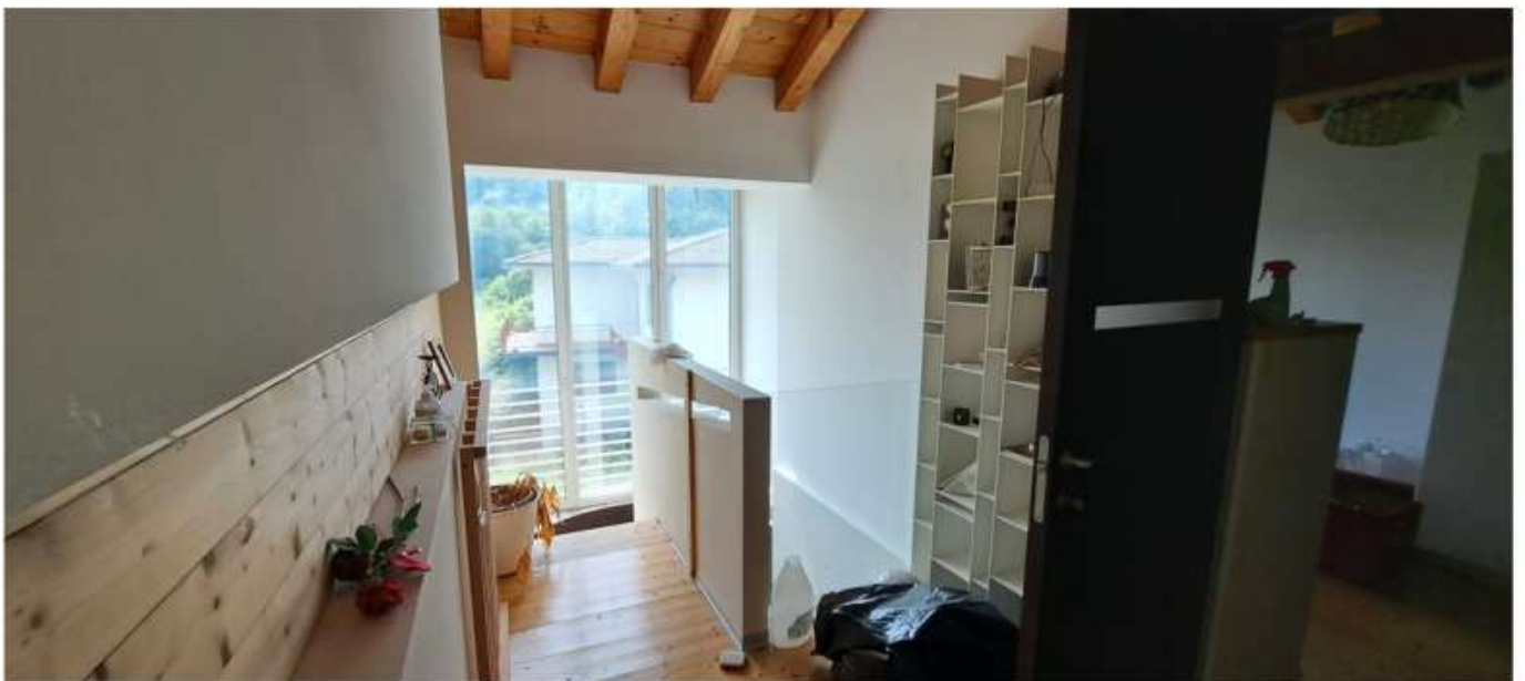
41_disimpegno scala p2