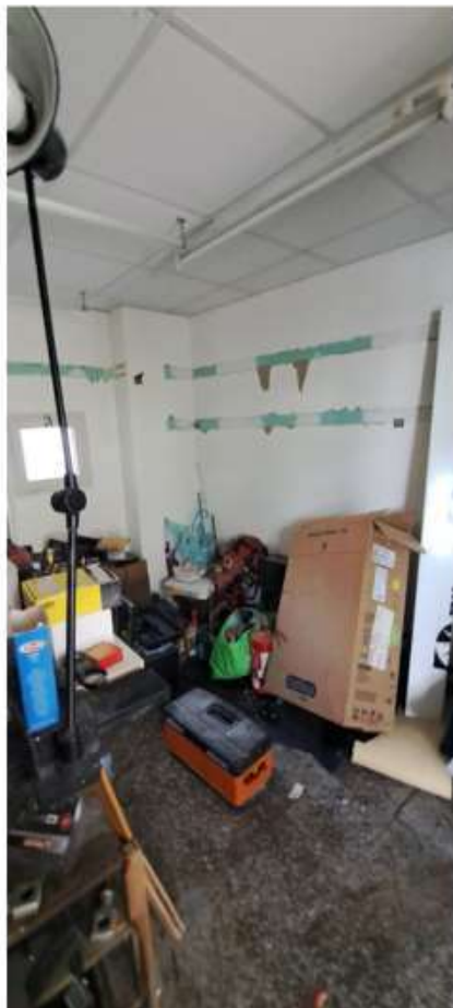
15_deposito piano terra