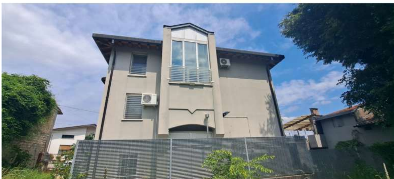
5_lato retro ovest