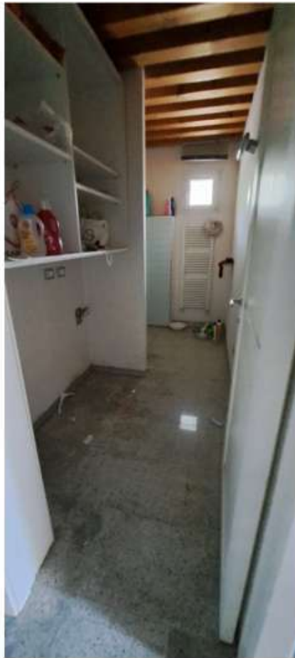
30_bagno lavanderia pt