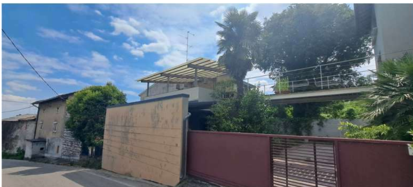
2_ fronte su via vallone