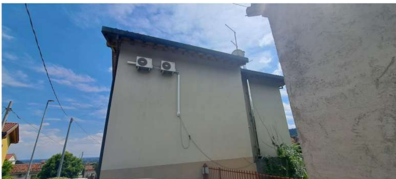
4_esterno lato nord