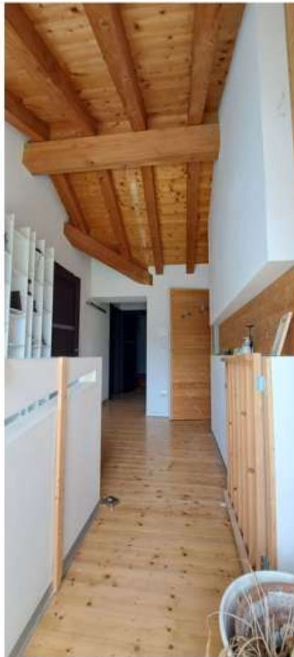
40_scala disimpegno p2