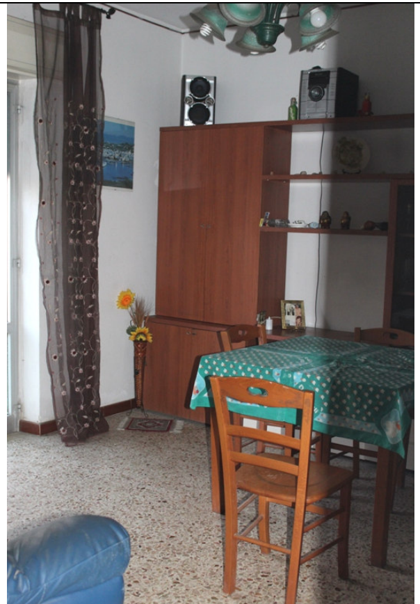
11 – CUCINA/PRANZO