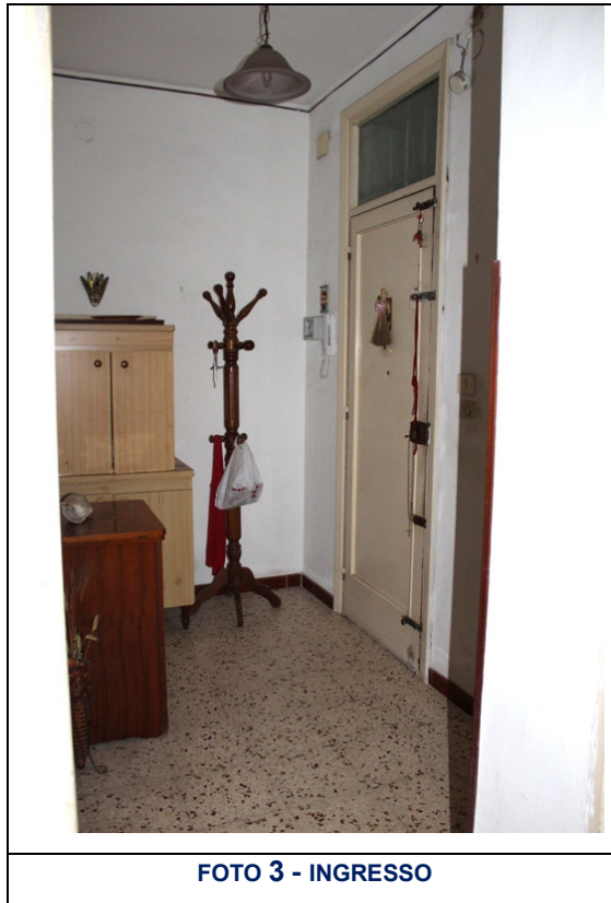
FOTO 3 - INGRESSO