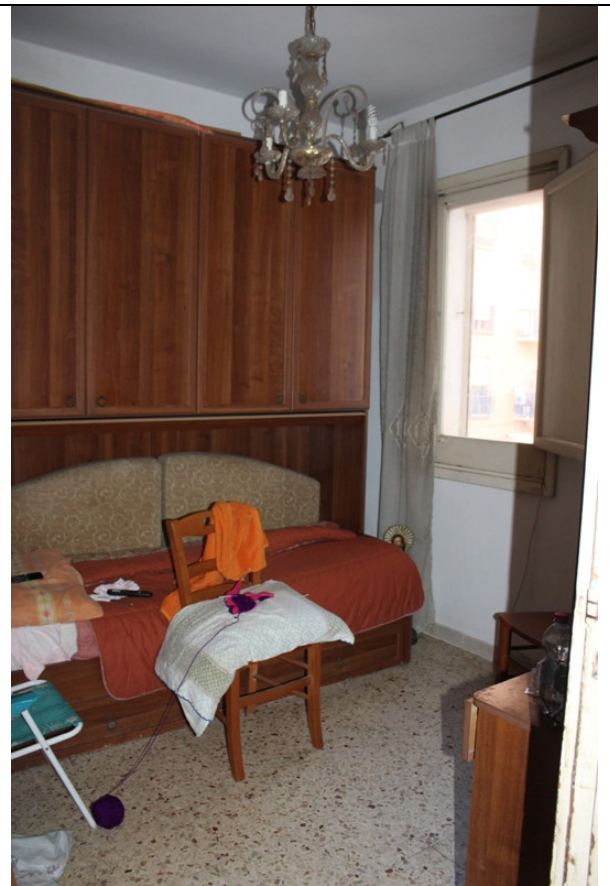
5 – camera 2