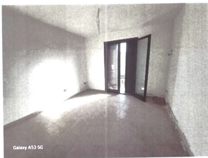
FOTO 10 Camera da letto matrimoniale