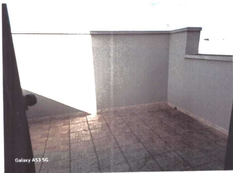
FOTO 17 Terrazzino al Piano Secondo