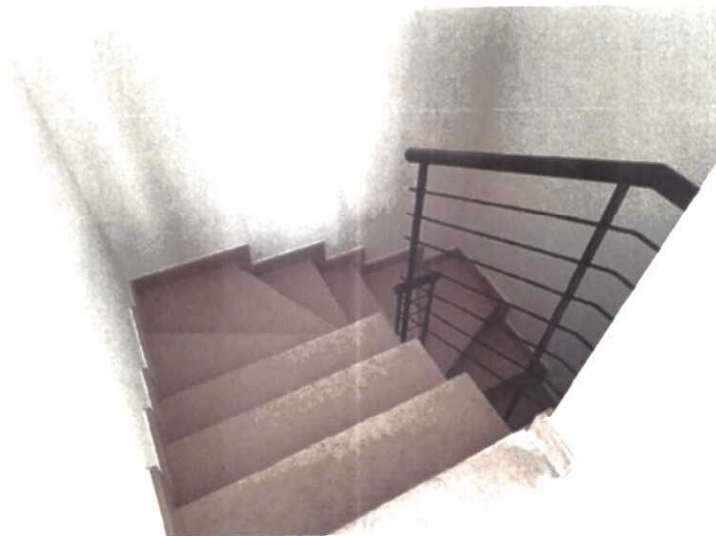
FOTO 14 Scale