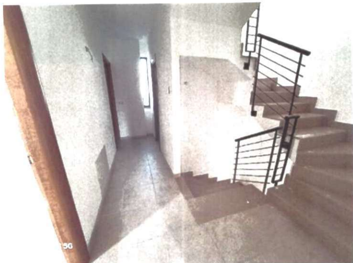
FOTO 9 Disimpegno Piano Primo