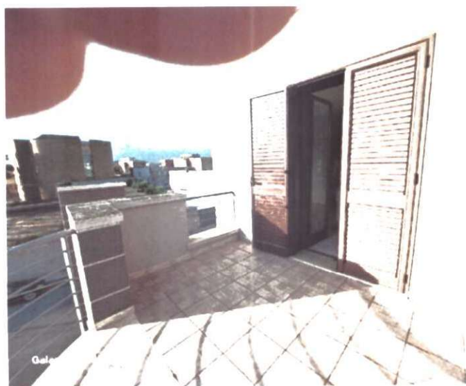
FOTO 16 Balcone al Piano Secondo