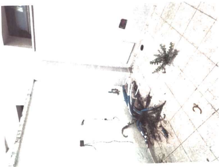
FOTO 20 Cortile interno al Piano Terra