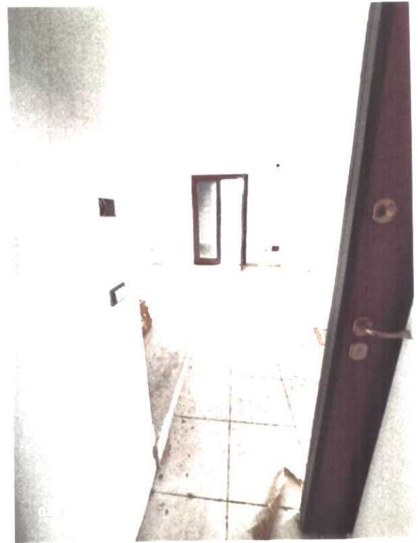
FOTO 4 Soggiorno PT