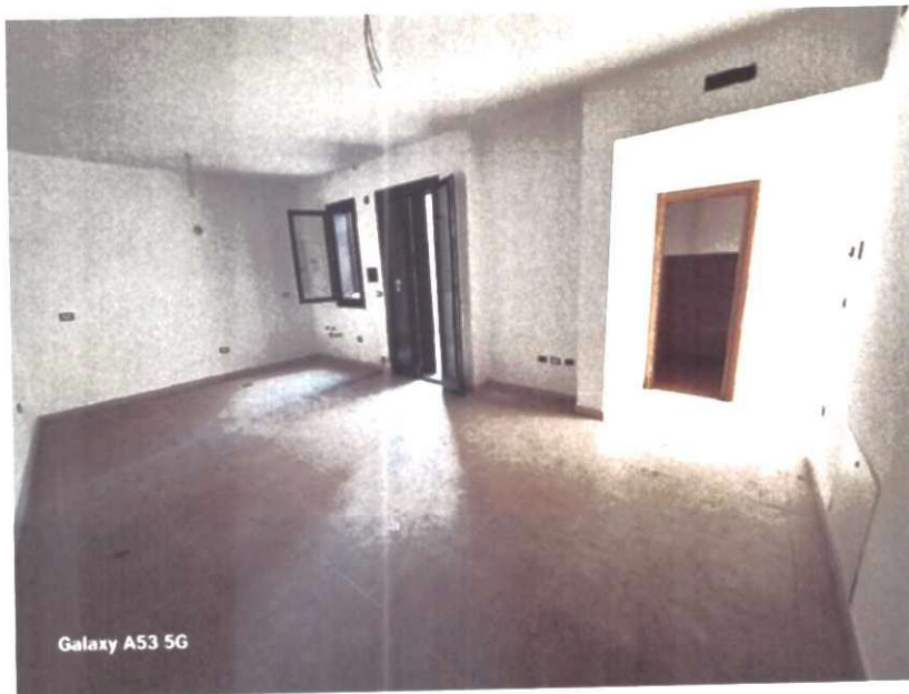
FOTO 5 Tinello con angolo cottura PT