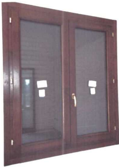
FOTO 19 Particolare Infissi