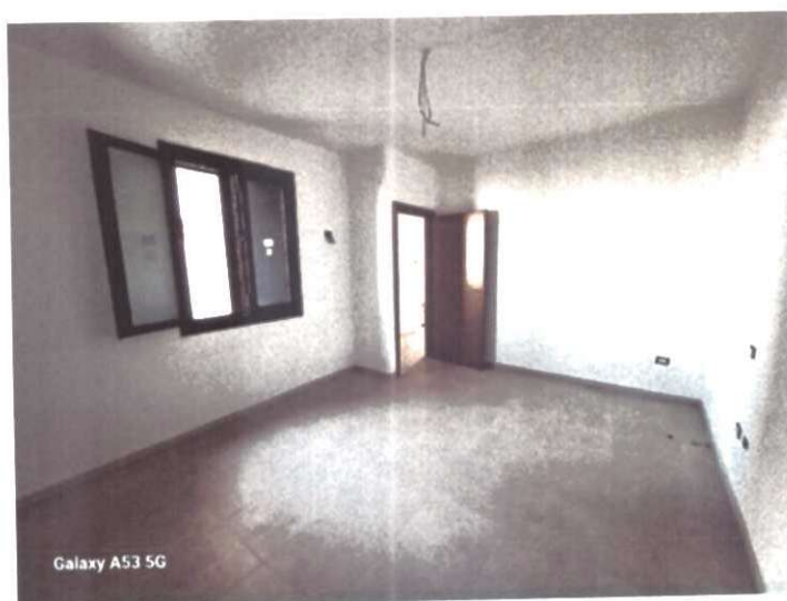
FOTO 11 Camera da letto 3