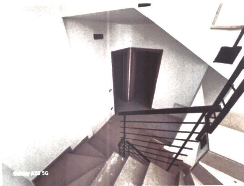
FOTO 8 Corpo scala