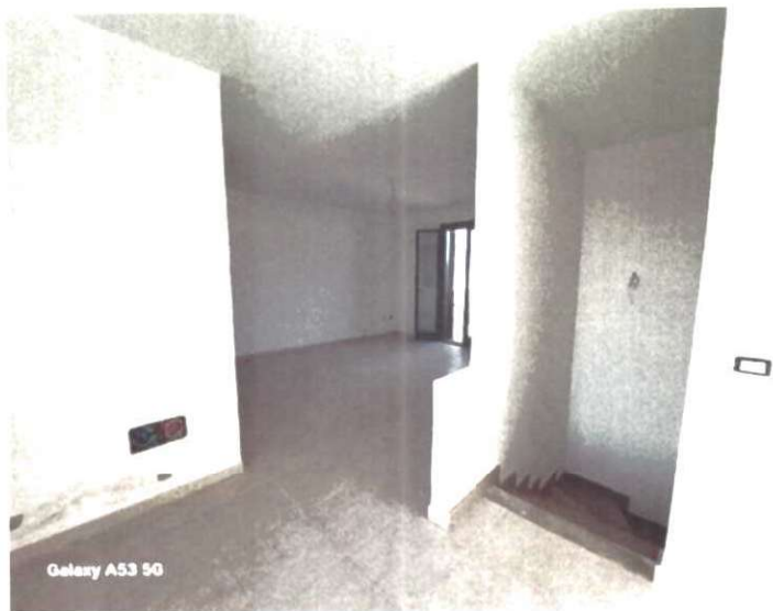
FOTO 15 Soggiorno multiuso Piano Secondo