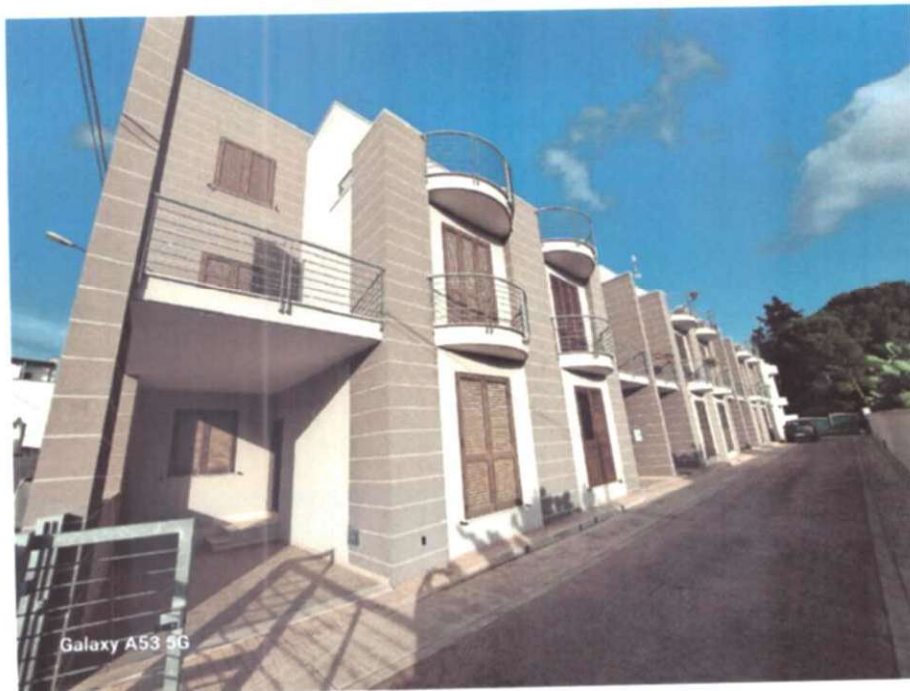
FOTO 2 - Fronte Interno Ingresso su passaggio comune con altri subalterni