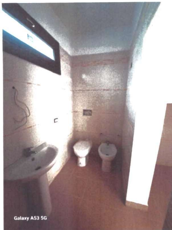
FOTO 6/7 Bagno/Lavanderia PT