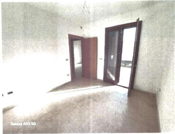
FOTO 12 Camera da letto 2