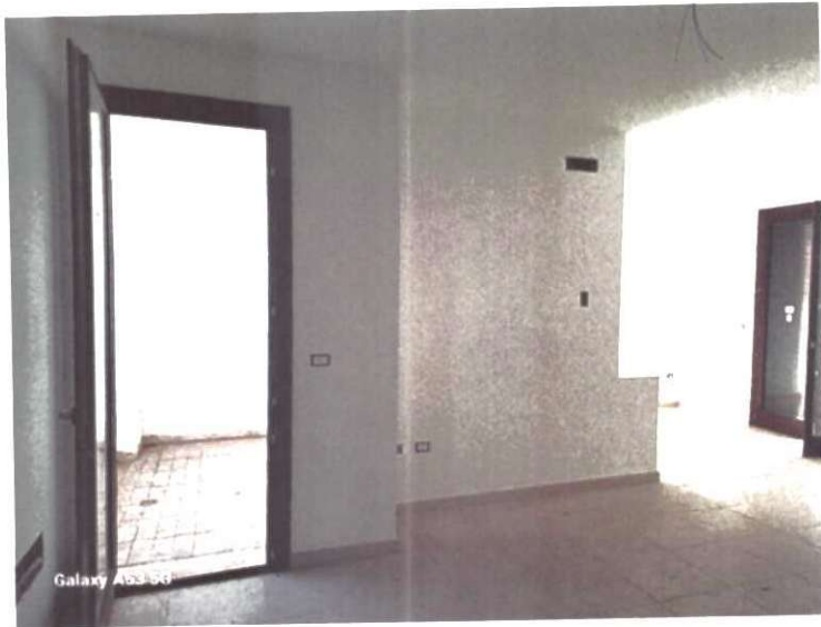
Foto 18 Soggiorno multiuso balconcino