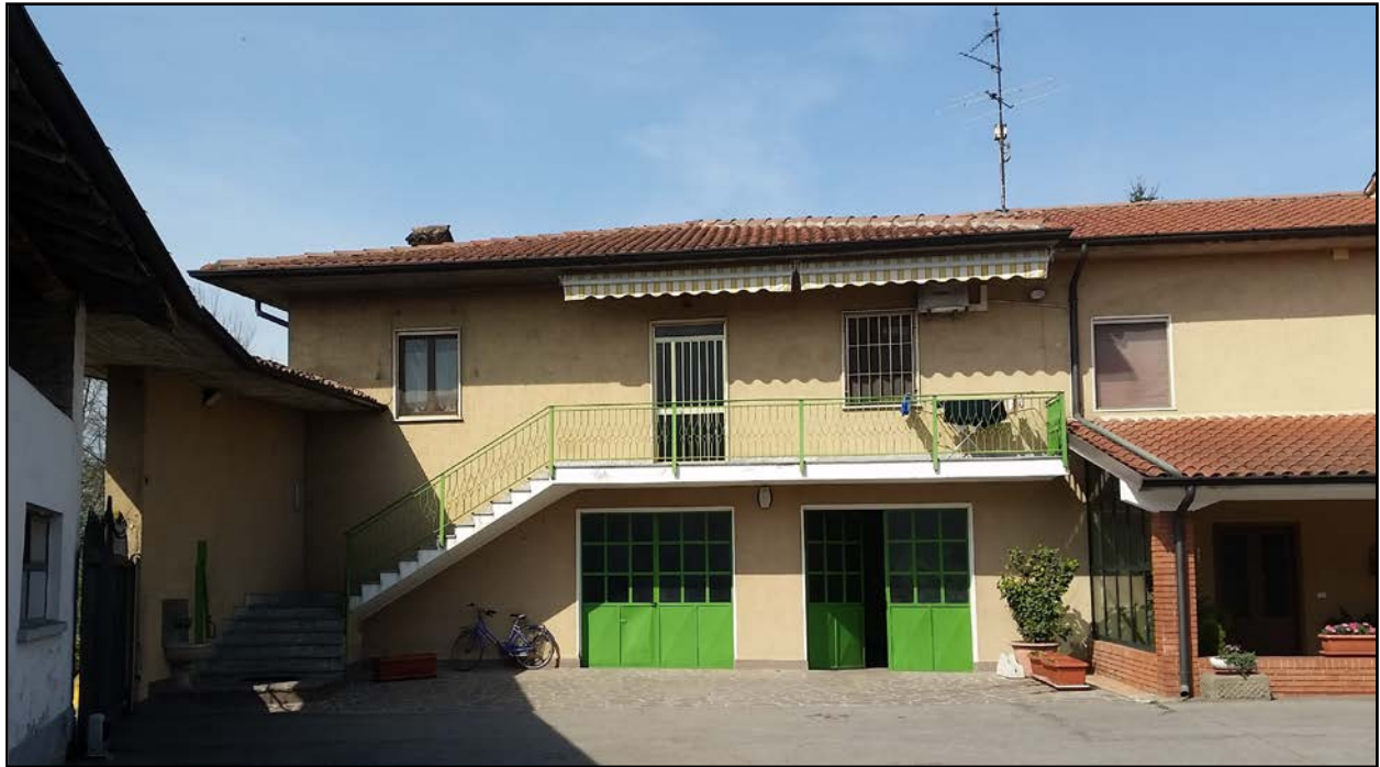
ESTERNO – FRONTE SUD