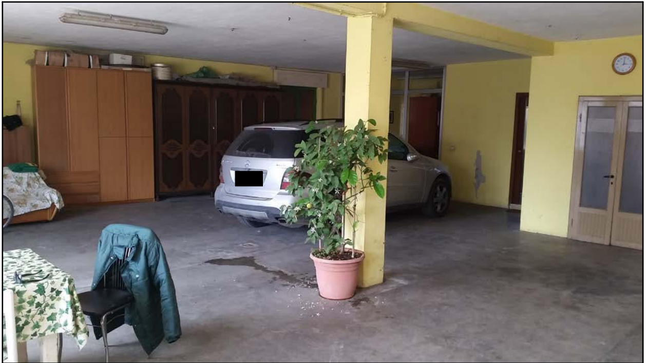
INTERNO - BOX