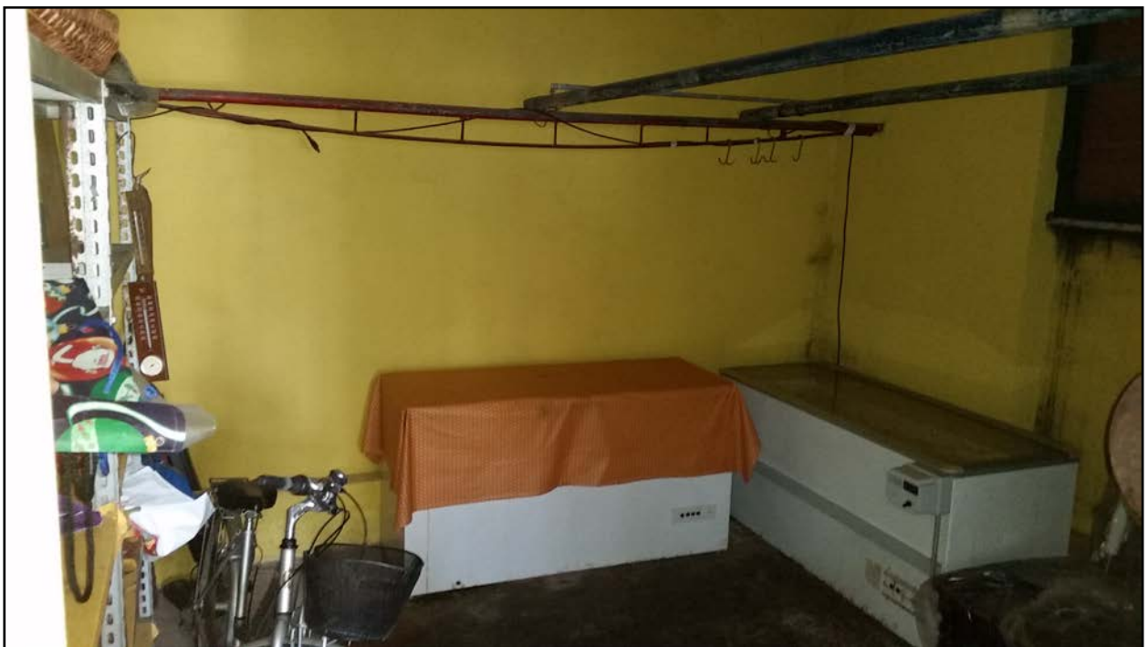
INTERNO - CANTINA