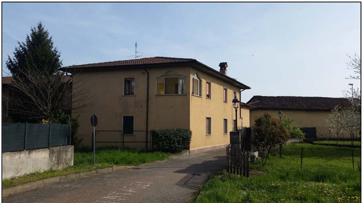
ESTERNO – FRONTE NORD-OVEST