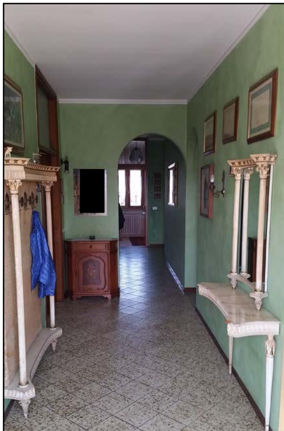
INTERNO – DISIMPEGNO