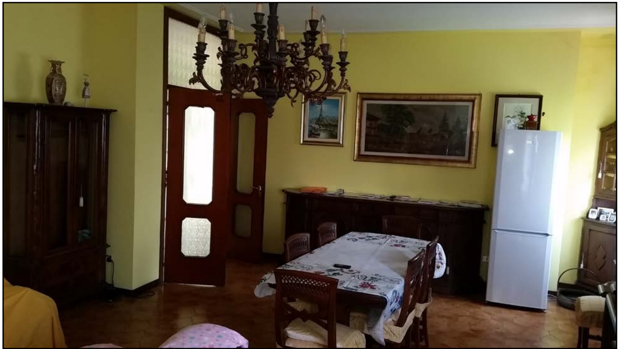
INTERNO - SOGGIORNO