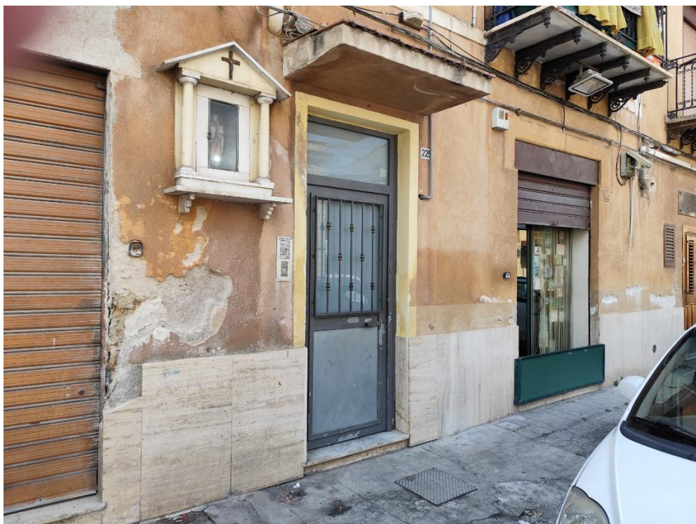
Vista dell'ingresso all'androne su via Brancaccio (F.3)