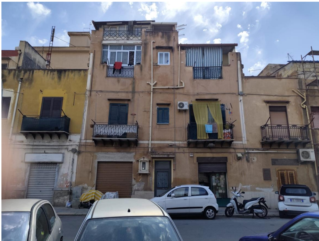
Vista del fabbricato sulla via Brancaccio (F.1)