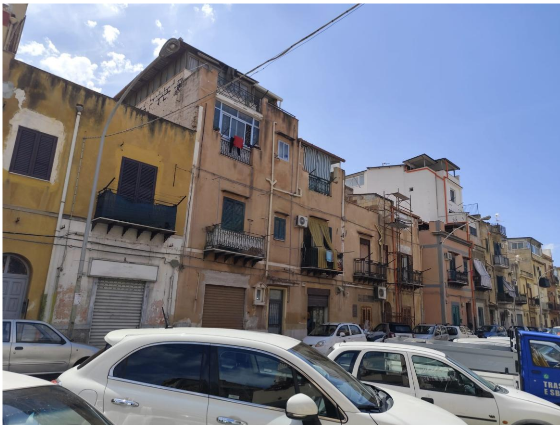
Vista del fabbricato sulla via Brancaccio (F.2)