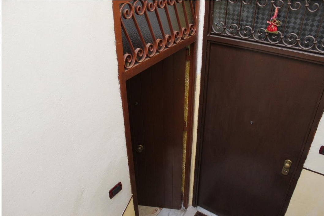
Vista della porta di ingresso all'appartamento (F.5)