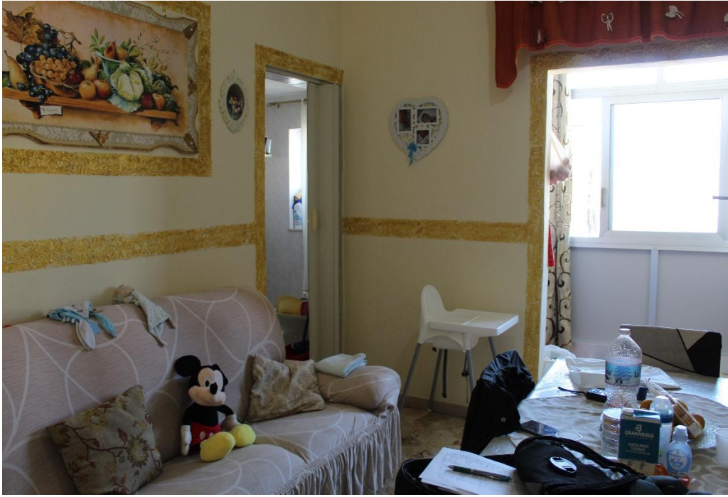
Vista della zona pranzo (F.7)