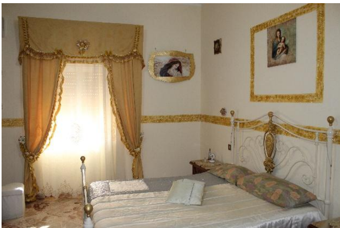
Vista della camera da letto (F. 10)