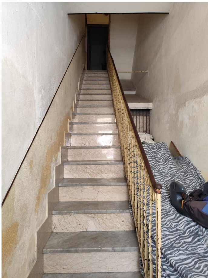
Vista della scala di collegamento ai piani (F4)