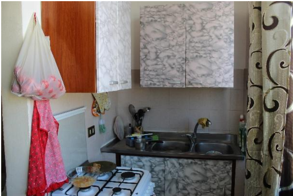
Vista del cucinino nella loggia verandata (F.8)