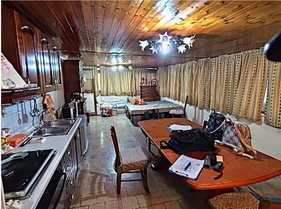
Vista del grande vano (F.13)