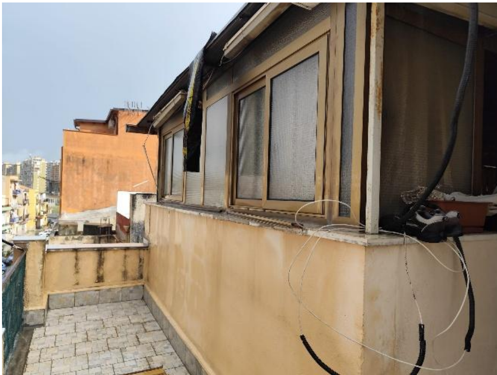
Vista del terrazzino (F.12)