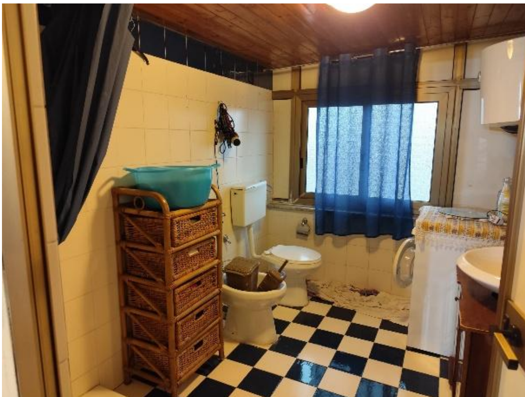
Vista del wc-doccia (F.14)