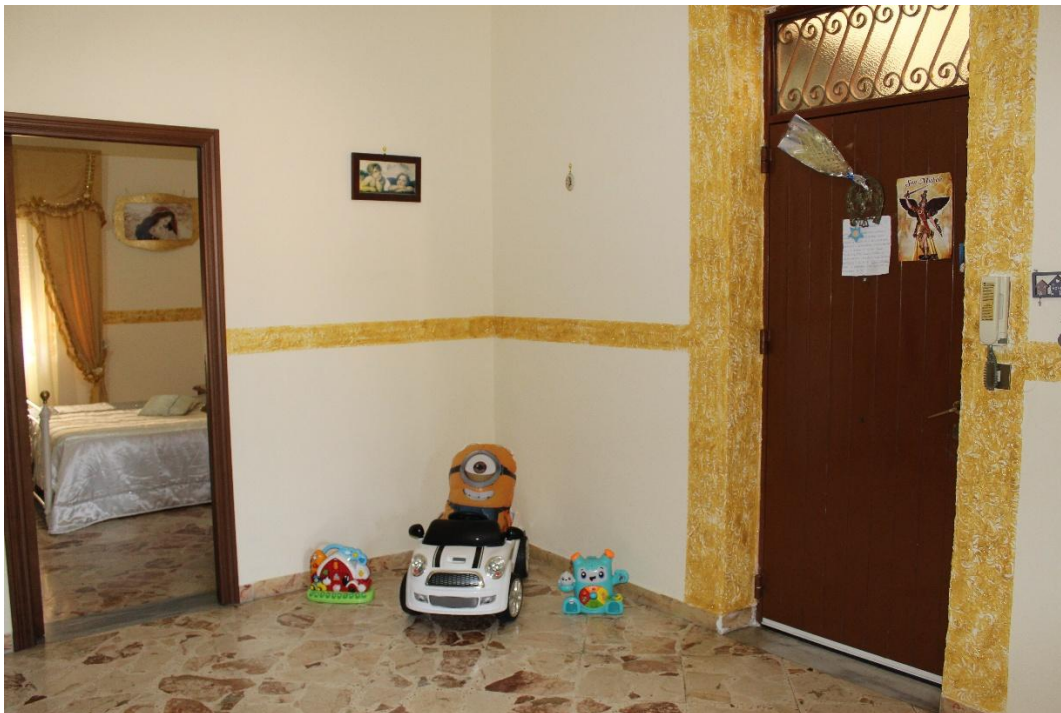
Vista dell'ingresso-soggiorno (F.6)