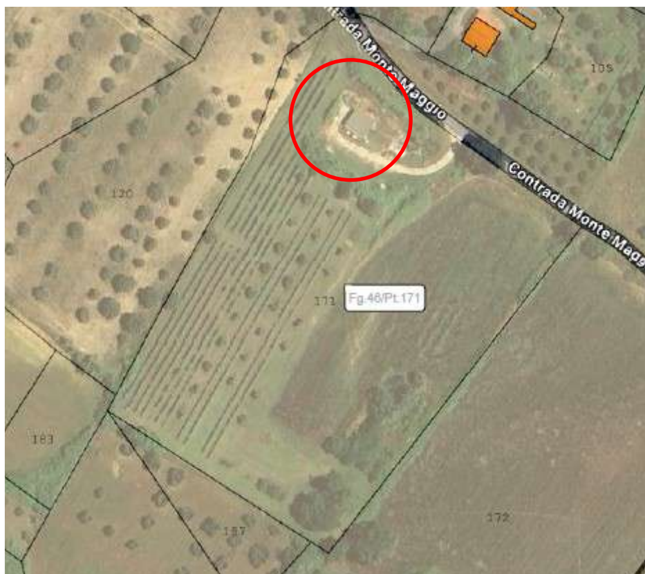
Foto n. 21 – Sovrapposizione foto aerea con mappa catastale, indicazione manufatto abusivo (cerchio rosso)