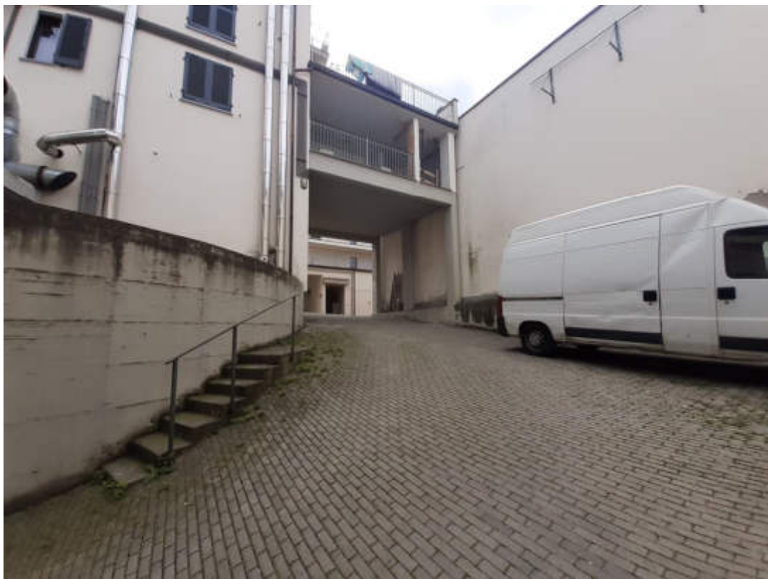
Vista dalla rampa carraia di accesso al piano seminterrato