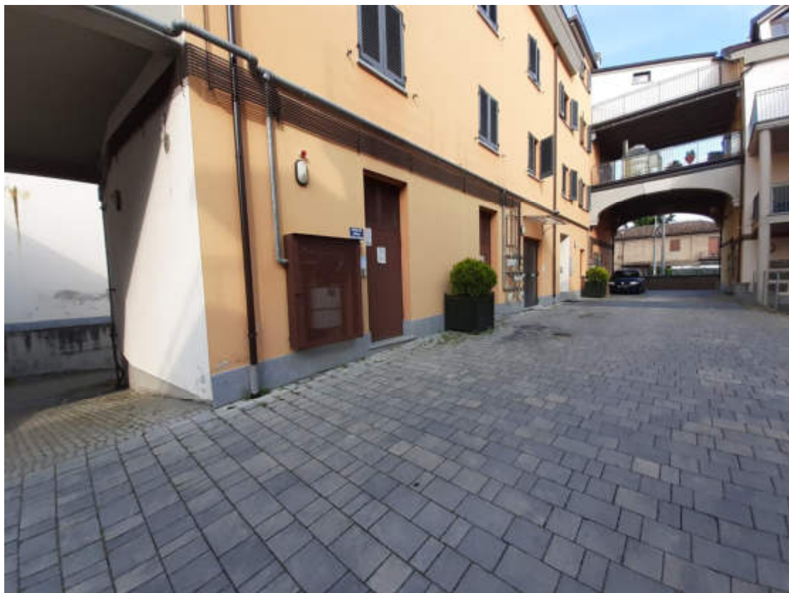
Vista dal cortile interno comune della rampa carraia di accesso al piano seminterrato