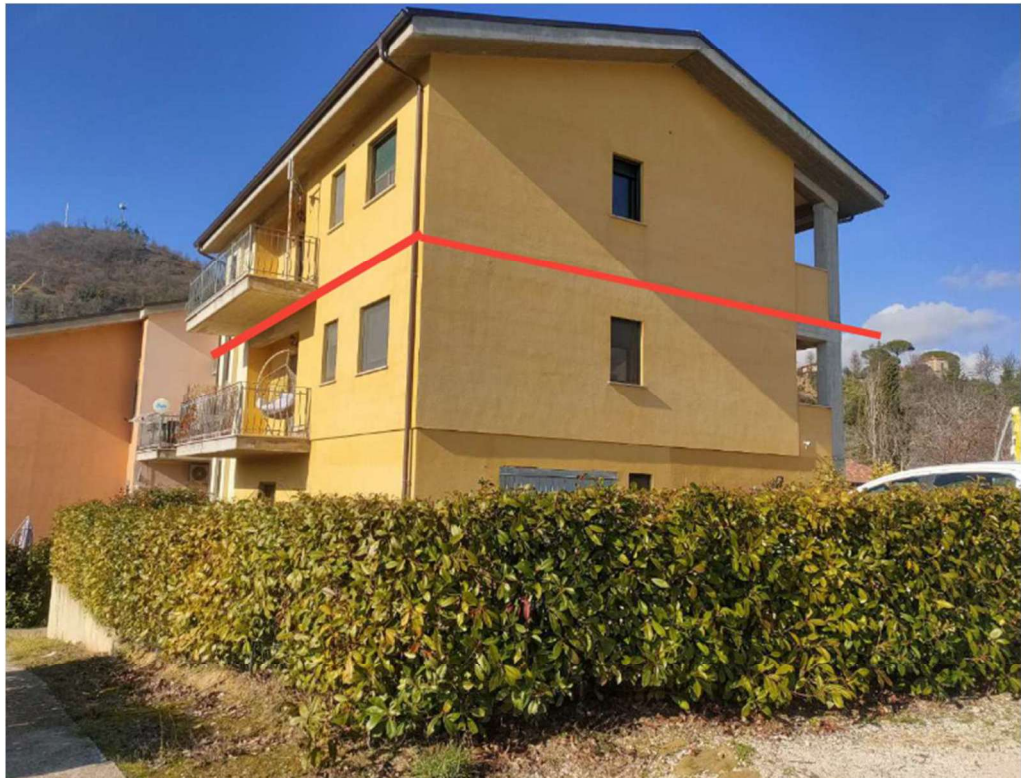
Via Giorgio Romani n. 87