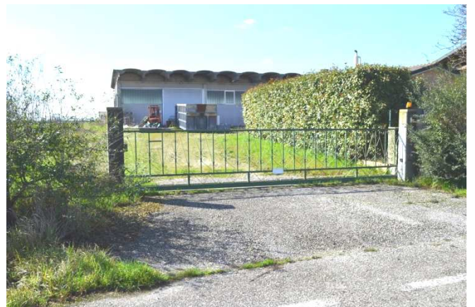
foto 8 - L'ingresso del laboratorio in via Oppioli 34