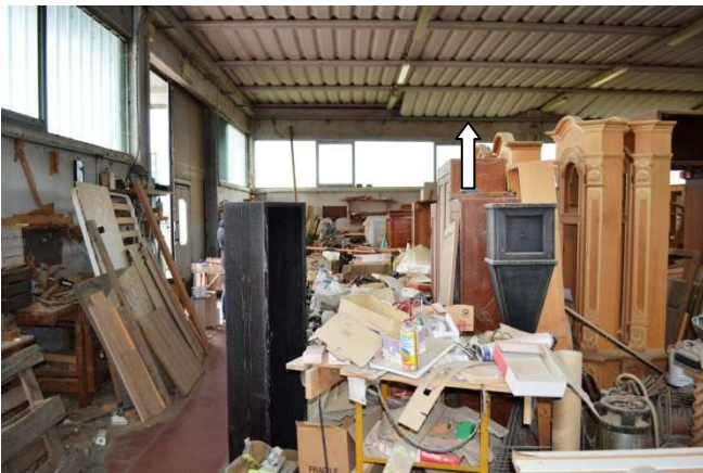
foto 12 - L'angolo sud con controsoffitto in dissesto