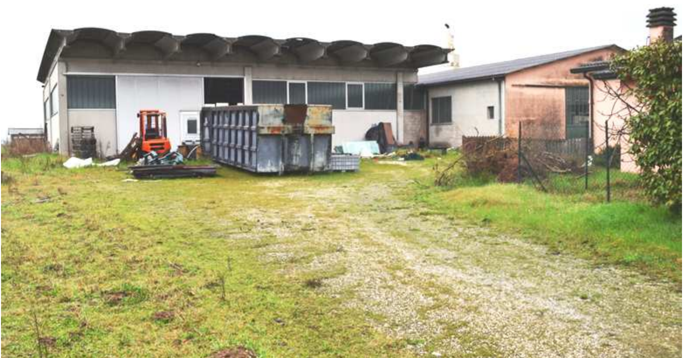
foto 3 - Prospetto nord est del laboratorio artigianale in via Oppioli 34 a Cherubine di Cerea, visto da est