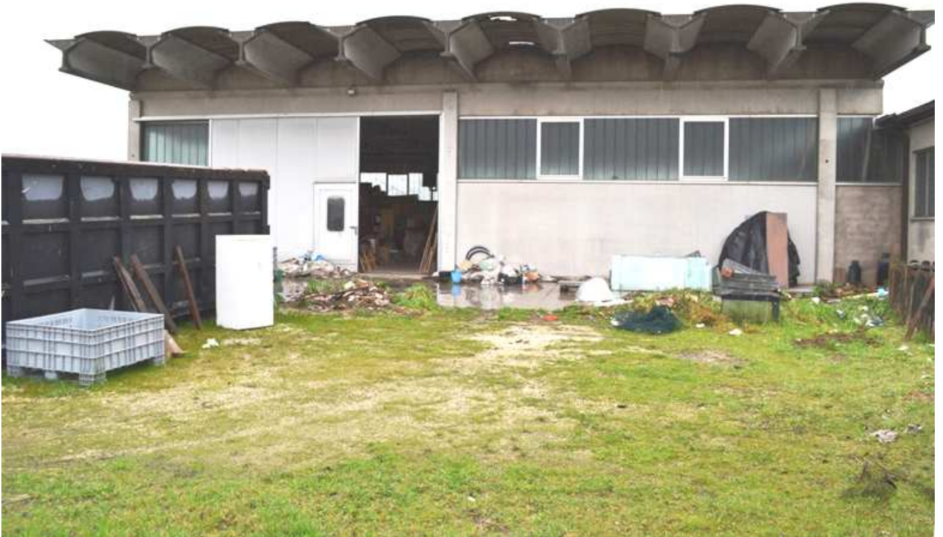
foto 4 - Scorcio del prospetto nord est del laboratorio in via Oppioli 34 visto dalla corte comune