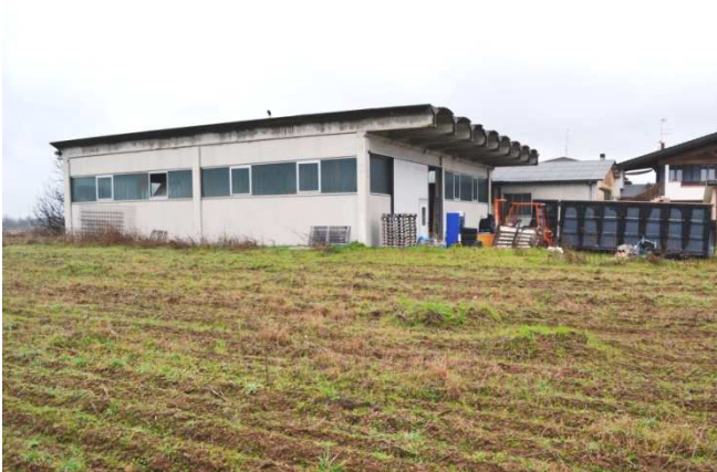
foto 5 - Il laboratorio artigianale visto da sud est