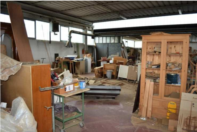
foto 10 - Vista dall'ingresso dell'angolo nord