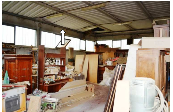
foto 13 - L'angolo ovest con controsoffitto in dissesto