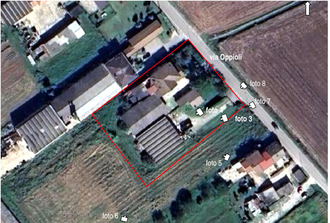
foto 2 - Aerofoto Google – coni visuali delle foto esterne – scala apx 1:1000