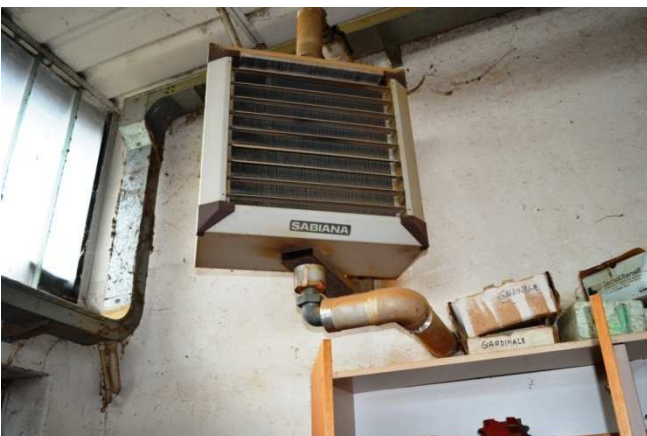
foto 17 - Particolare di uno degli aerotermini a soffitto