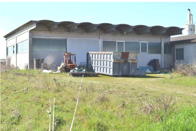
foto 7 - Scorcio del m.n. 127 sub 4 visto da via Oppioli