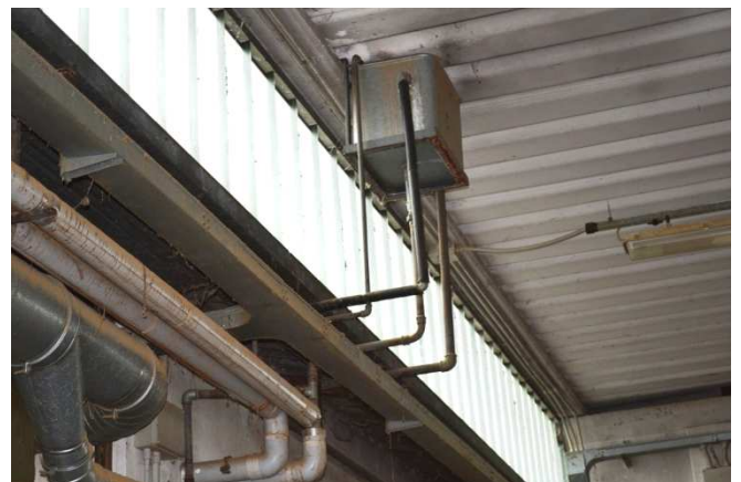
foto 18 - Vista della vasca d'espansione imp. idrico