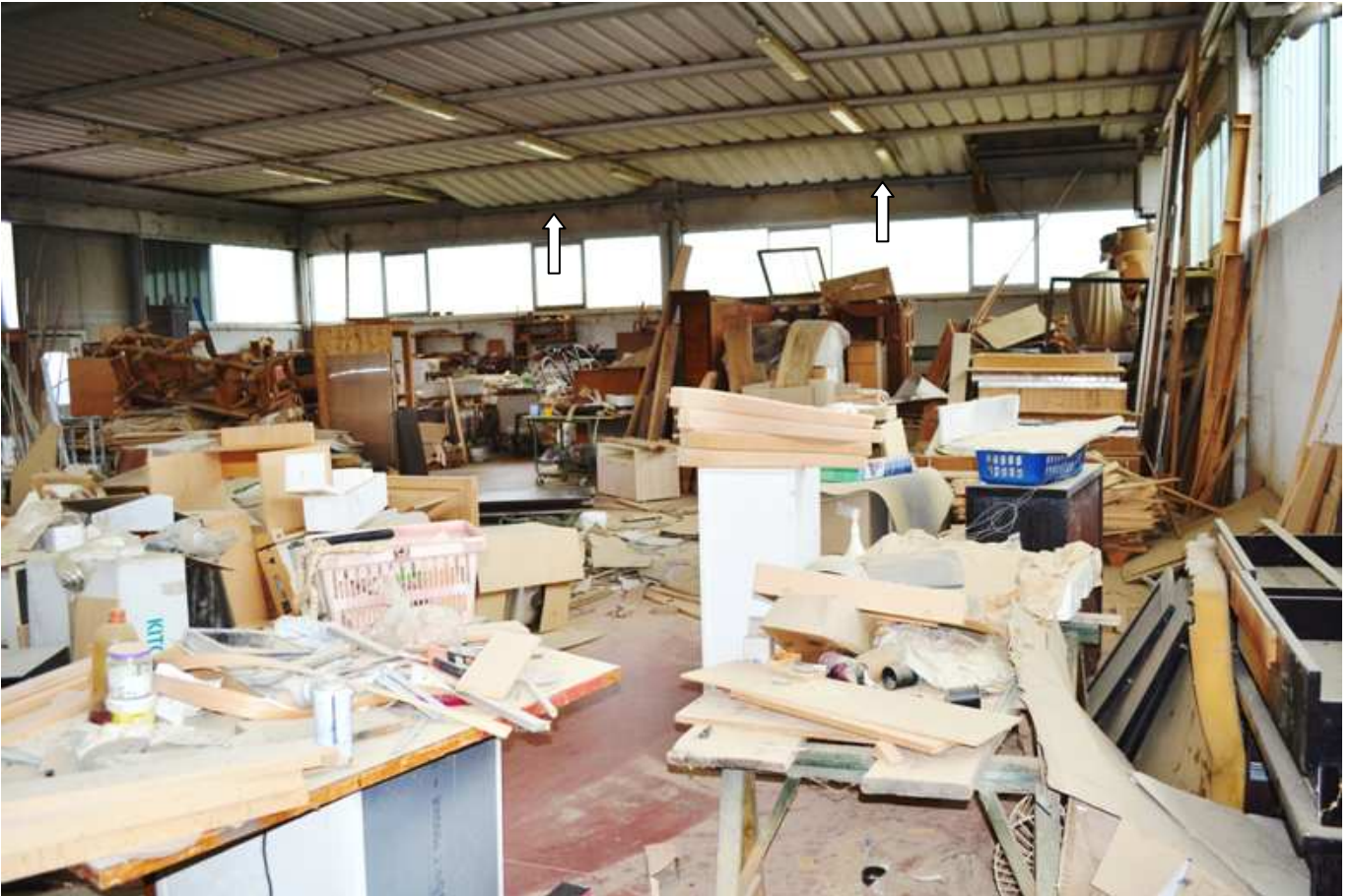
foto 14 - Laboratorio artigianale in via Oppioli - vista della parete sud ovest col controsoffitto disestato