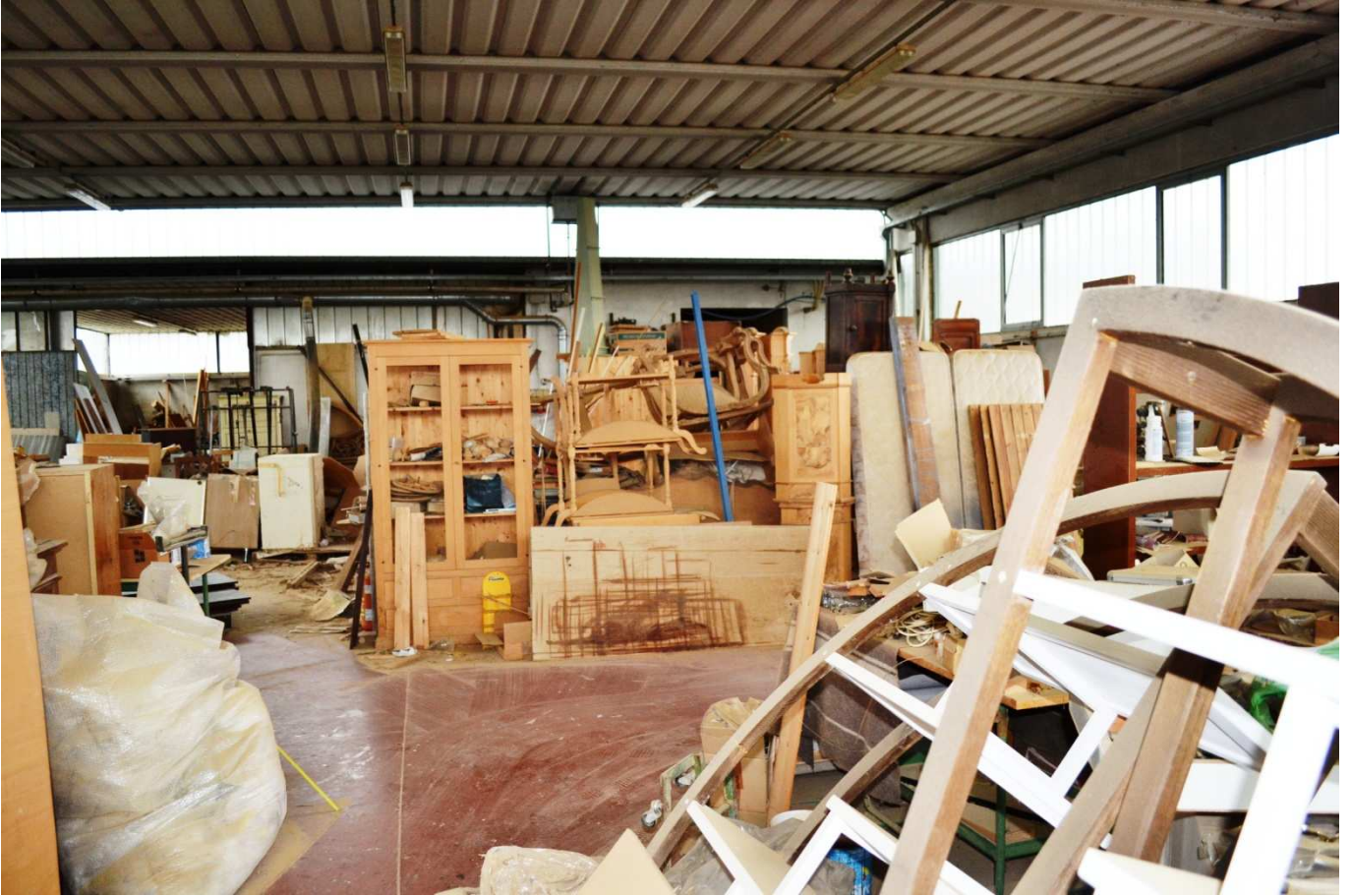
foto 9 - Laboratorio artigianale in via Oppioli - scorcio della parete nord est a contatto col laboratorio vecchio