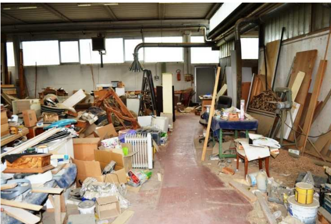
foto 15 - L'angolo nord con l'impianto di aspirazione