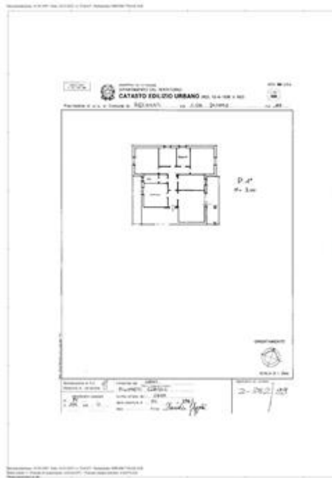
Planimetria Catale appartamento oggetto di procedura

8.3. CONFORMITÀ URBANISTICA: NESSUNA DIFFORMITÀ