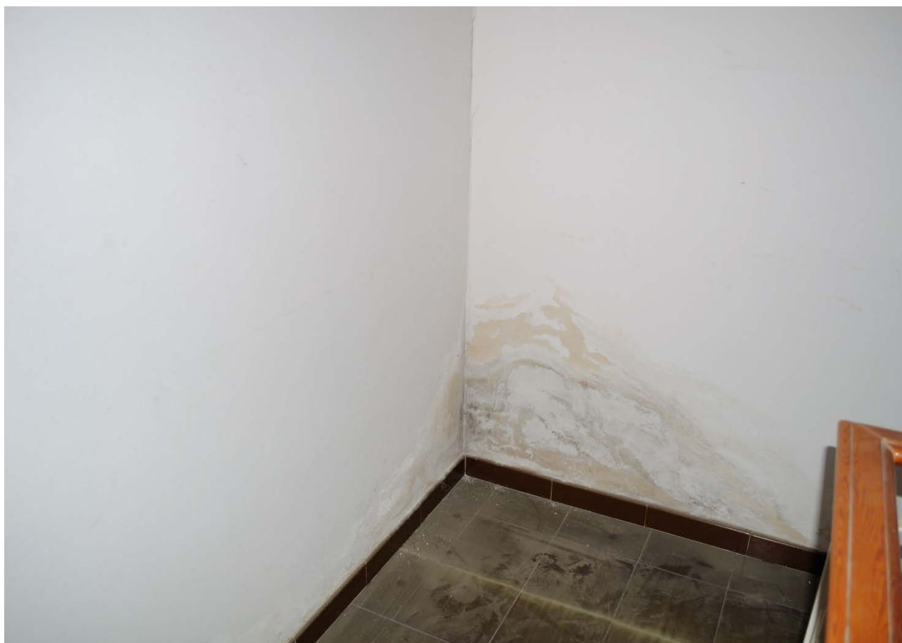
FOTO 12 – Particolare dei uno dei diffusi segni di infiltrazione e ammaloramento intonaci interni