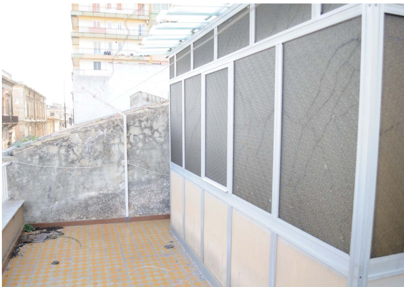
FOTO 14 – Struttura precaria ubicata sulla terrazza – da demolire