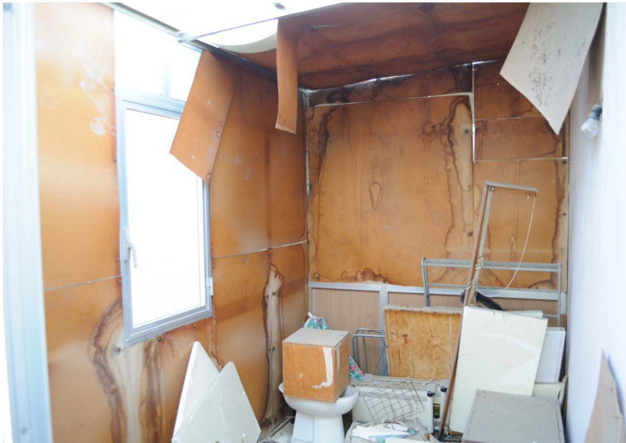
FOTO 15 – Particolare dell'interno della struttura in condizioni fatiscenti