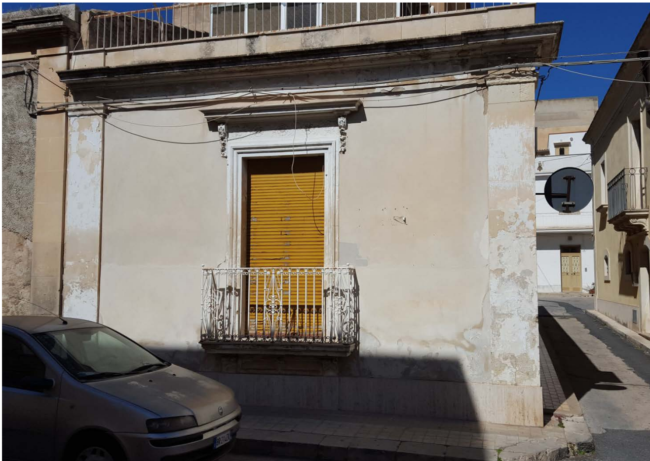
FOTO 1 – Fabbricato sito in Via Mazzini, angolo Cortile Cultrera, n. 15 – Avola (SR)