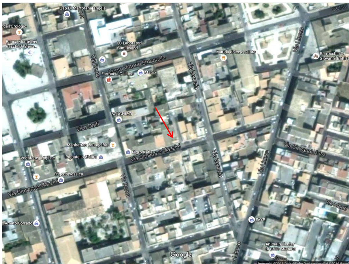
FOTO 16 – Ubicazione e geolocalizzazione dell'immobile - Via Mazzini angolo via Cultrera n. 15, Avola (SR) - Coordinate GPS: 36.909156, 15.136708