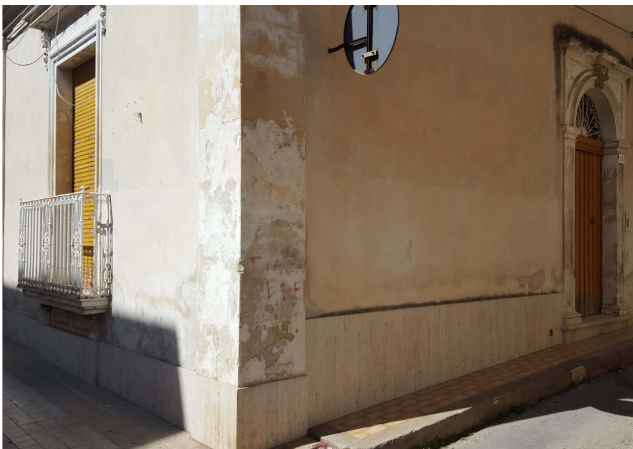
FOTO 2 – Fabbricato sito in Via Mazzini, angolo Cortile Cultrera, n. 15 – Avola (SR)