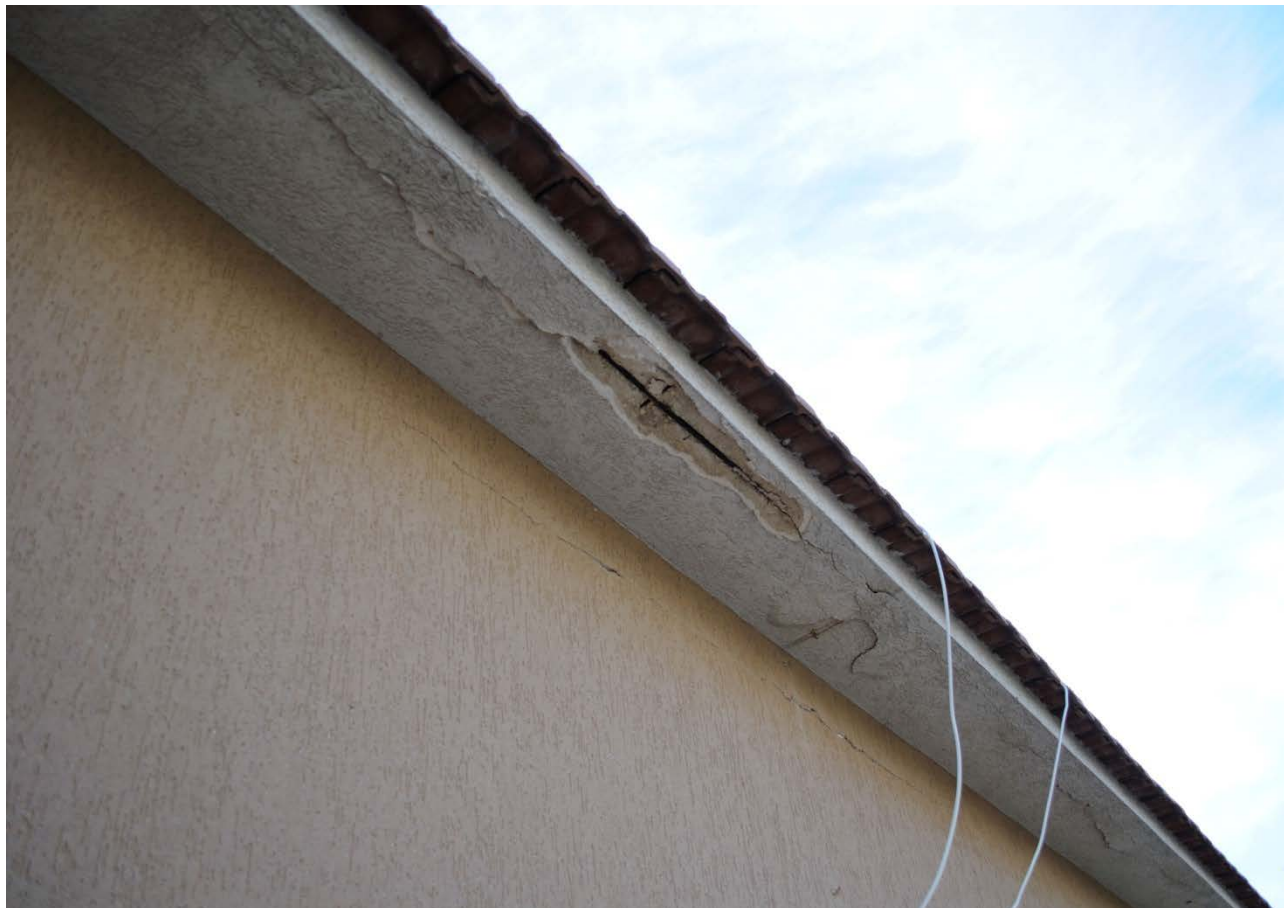
FOTO 13 – Particolare del distacco del copriferro dei frontalini al piano primo