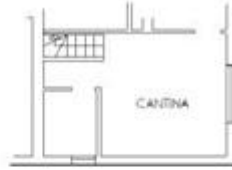
PIANO S1 H=250