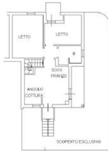
PIANO TERRA H=270