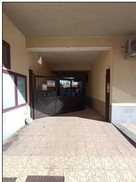
FOTO 2: Cancelli automatici per accesso rampa di discesa al piano sottostrada.