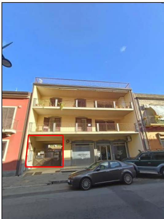
FOTO 1: Prospettiva del fabbricato ove si trova l'accesso carrabile per i garage siti al piano sottostrada.

Garage sub. 16 sito a Fiumefreddo di Sicilia (CT), via Umberto I s.n.c., piano primo sottostrada