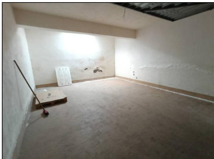
FOTO 7: Interno garage sub. 16, sgombero con lievi danni da umidità di risalita.