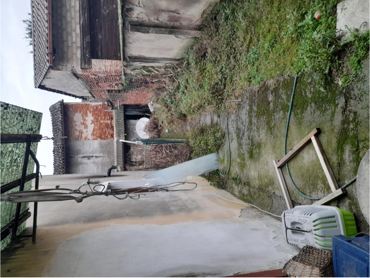
RUSTICO ESTERNO RETRO