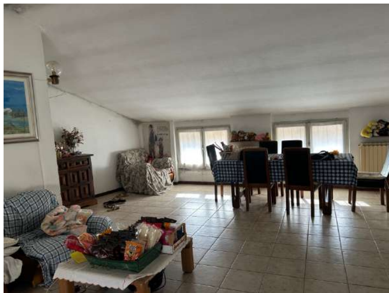
Foto 15, 16 e 17: P2 zona adibita a soggiorno e cucinotto. Le altezze non sono regolari