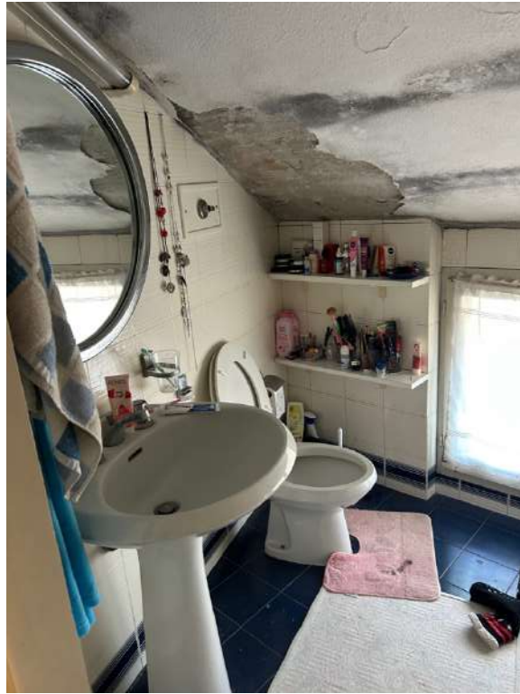
Foto 20 e 21: P2 bagno, l'umidità presente è dovuta sia ad infiltrazioni di acqua piovana sia a un insufficiente ricambio d'aria