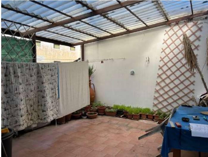
Foto 10, 11 e 12: P1 terrazza. Si vedono problemi con lo scarico acque piovane dal tetto