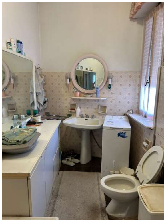
Foto 8 e 9: P1 bagno. Si evidenziano perdite dall'impianto di scarico e forse anche di adduzione acqua