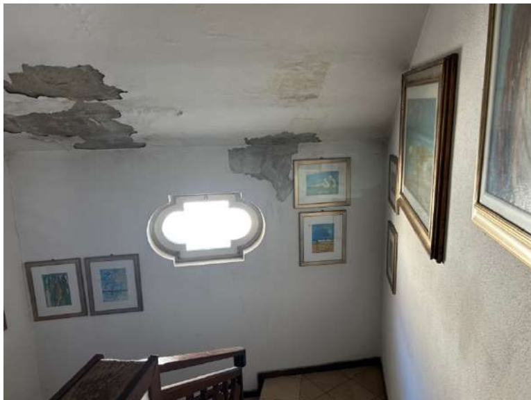
Foto 13 e 14: vano scala di collegamento tra P1 e P2. Si notano infiltrazioni di acqua dal tetto