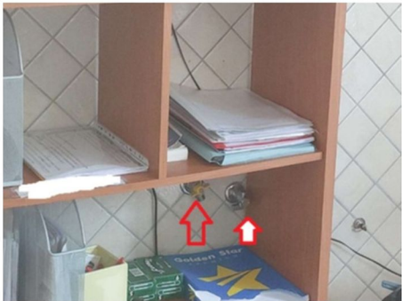
Foto n.7 – Particolare rivestimento parete ed attacchi utenze ex cucina adibita ad uso Ufficio (cfr. foto n.6)