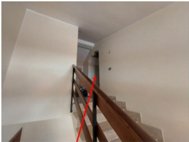
Foto n.11 – Vista dalla scala dell'accesso all'annessa soffitta posta al piano sottotetto