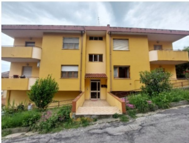
Foto n.1 – Vista accesso al fabbricato di appartenenza dell'appartamento pignorato, ubicato a Penne (PE), Via Agnello Maria Francia civ.10