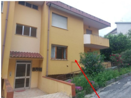
Foto n.2 – Vista dalla stessa Via A.M.Francia dell'appartamento pignorato posto al piano rialzato