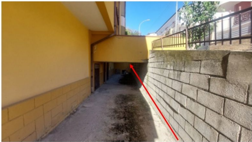
Foto n.14 – Vista accesso al posto auto con ballatoio in c.a. avente altezza da terra pari a circa 1,68 m