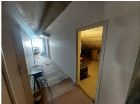
Foto n.12 – Particolare dell'accesso alla soffitta di cui alla Foto n.11