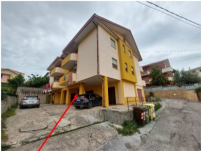
Foton.3 – Porta di accesso alla rampa di scala condominiale che dal piano terra conduce alla scala condominiale principale dipartentesi dal piano rialzato