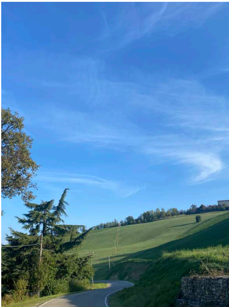
Immagine 8: Foglio 16 particelle 27 (corpo C) e 47 (corpo F)