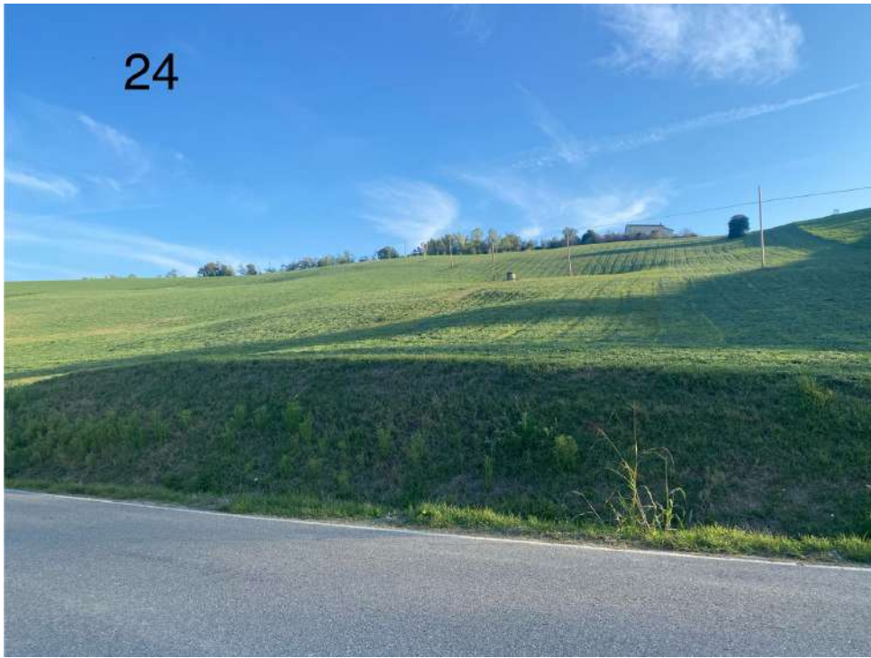
Immagine 7: Foglio 16 particella 24 (CORPO B)