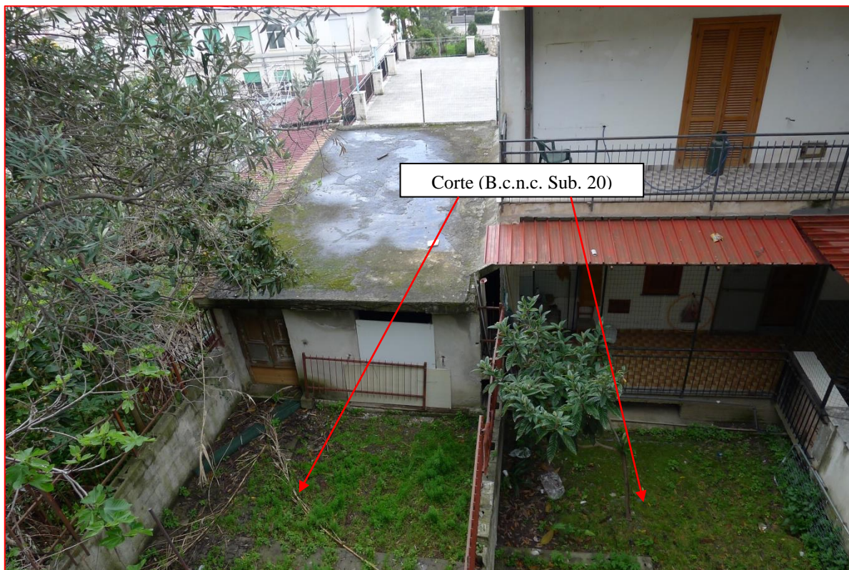
Fig. 6.9 – Foto con evidenziazione della continuità della corte