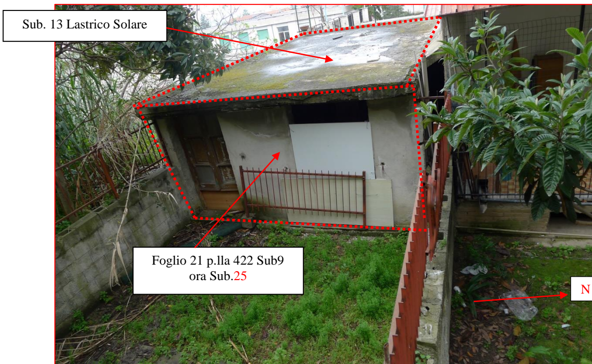
Fig. 6.1 – Prospetto Est. ex sub. 9 ora sub. 25 piano primo