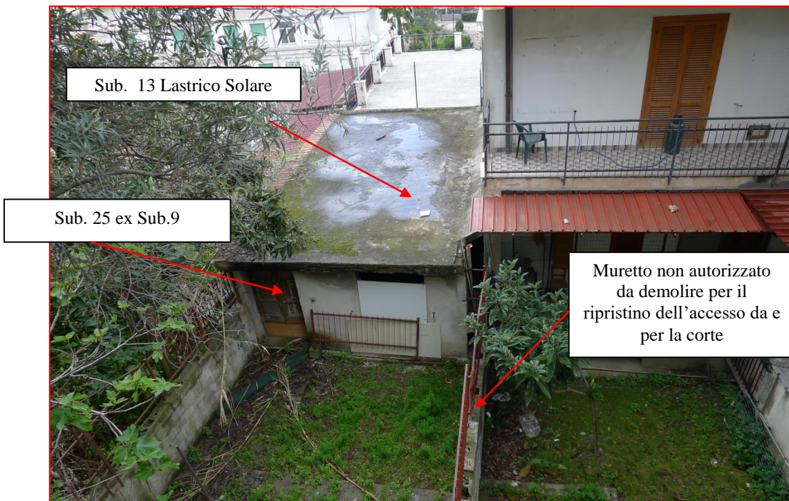
Fig. 6.6 – Foto dall'alto con individuazione di muretto