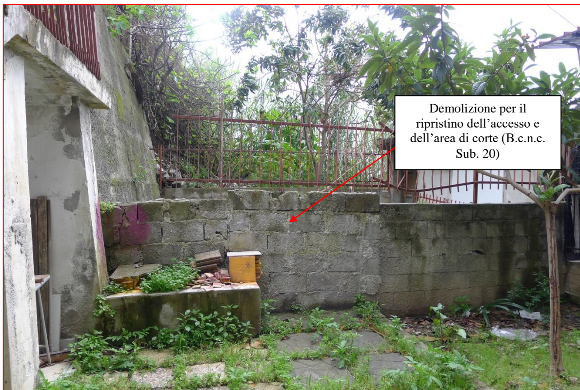
Fig. 6.8 – Foto da Nord dir. Sud, individuazione opera da demolire