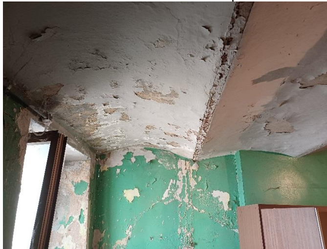
Foto 35 – Particolare soffitto cantina annessa all'appartamento piano primo-terra