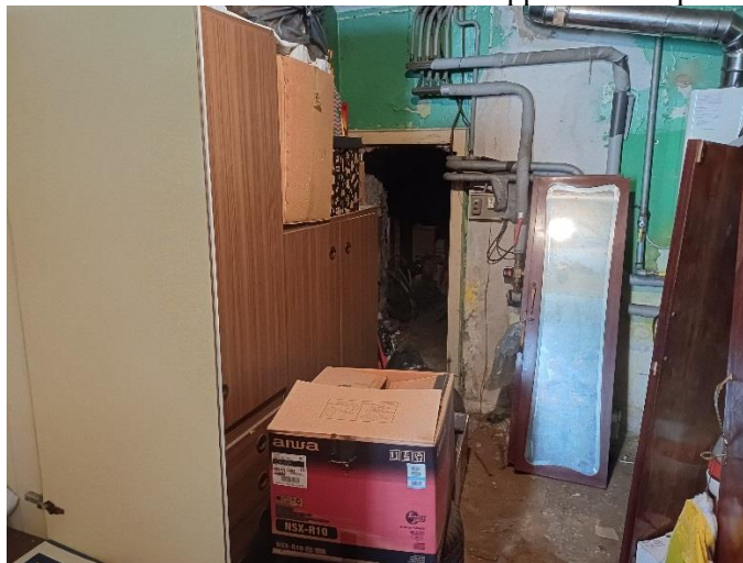
Foto 36 -Cantina e C.T.