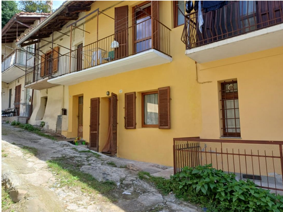
Foto 6 – Facciata su passaggio laterale dell'unità Fg 7 n. 29 sub 1