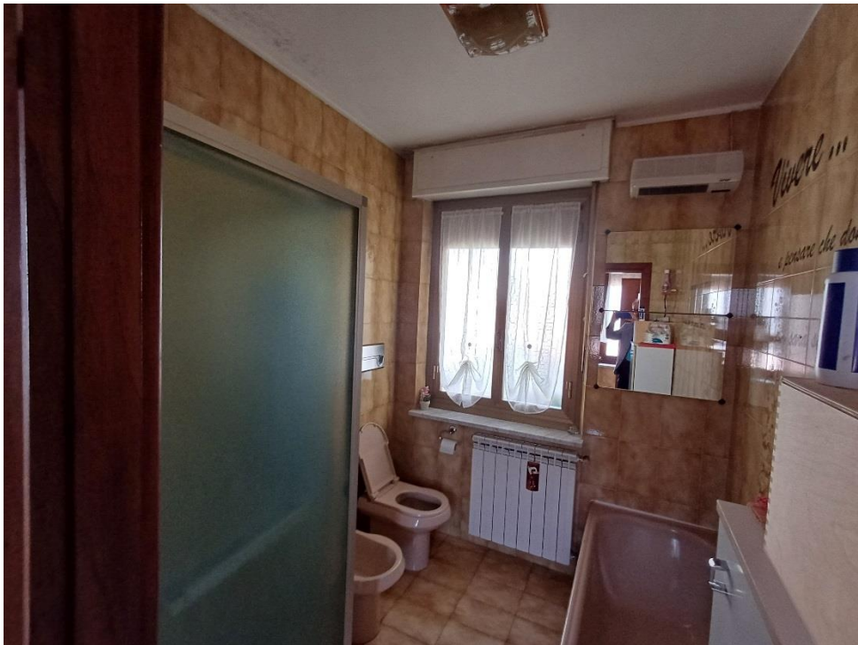
Foto 43 - Bagno