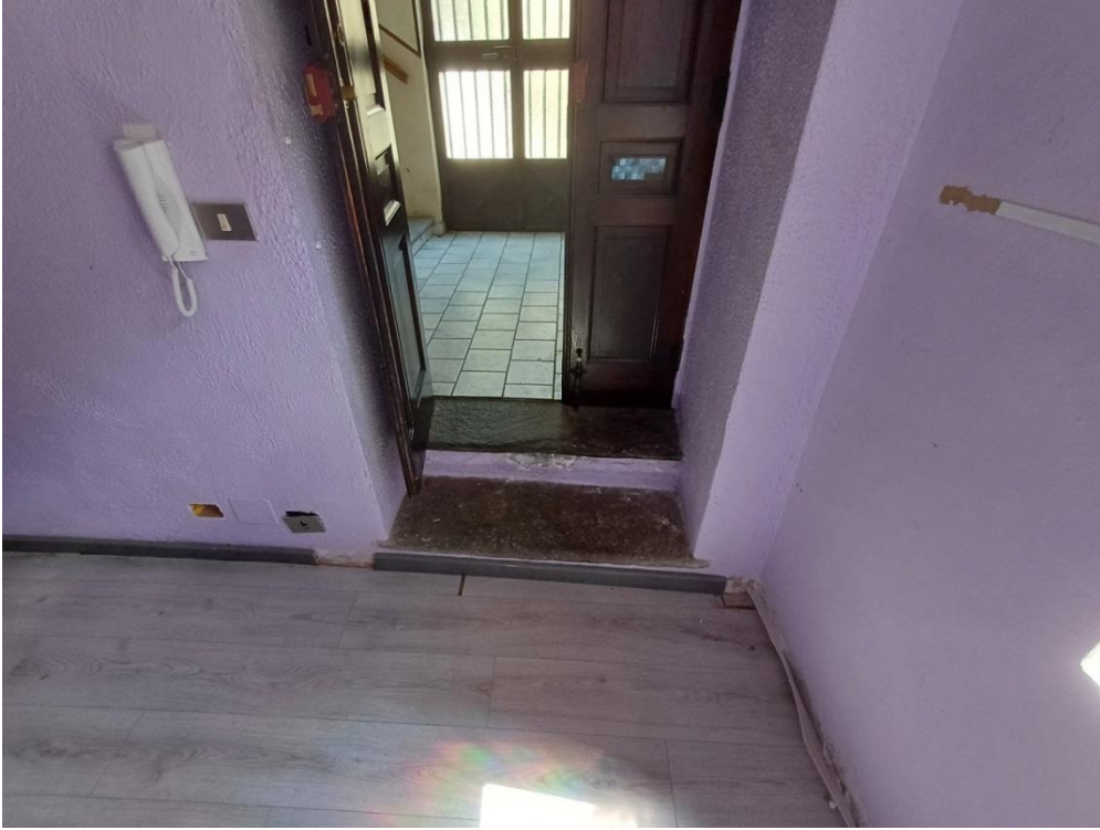
Foto 9 - Ingresso