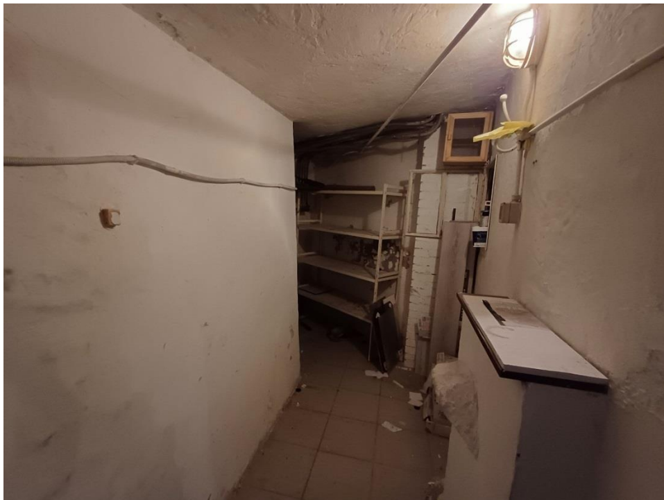
Foto 14 - Cantina