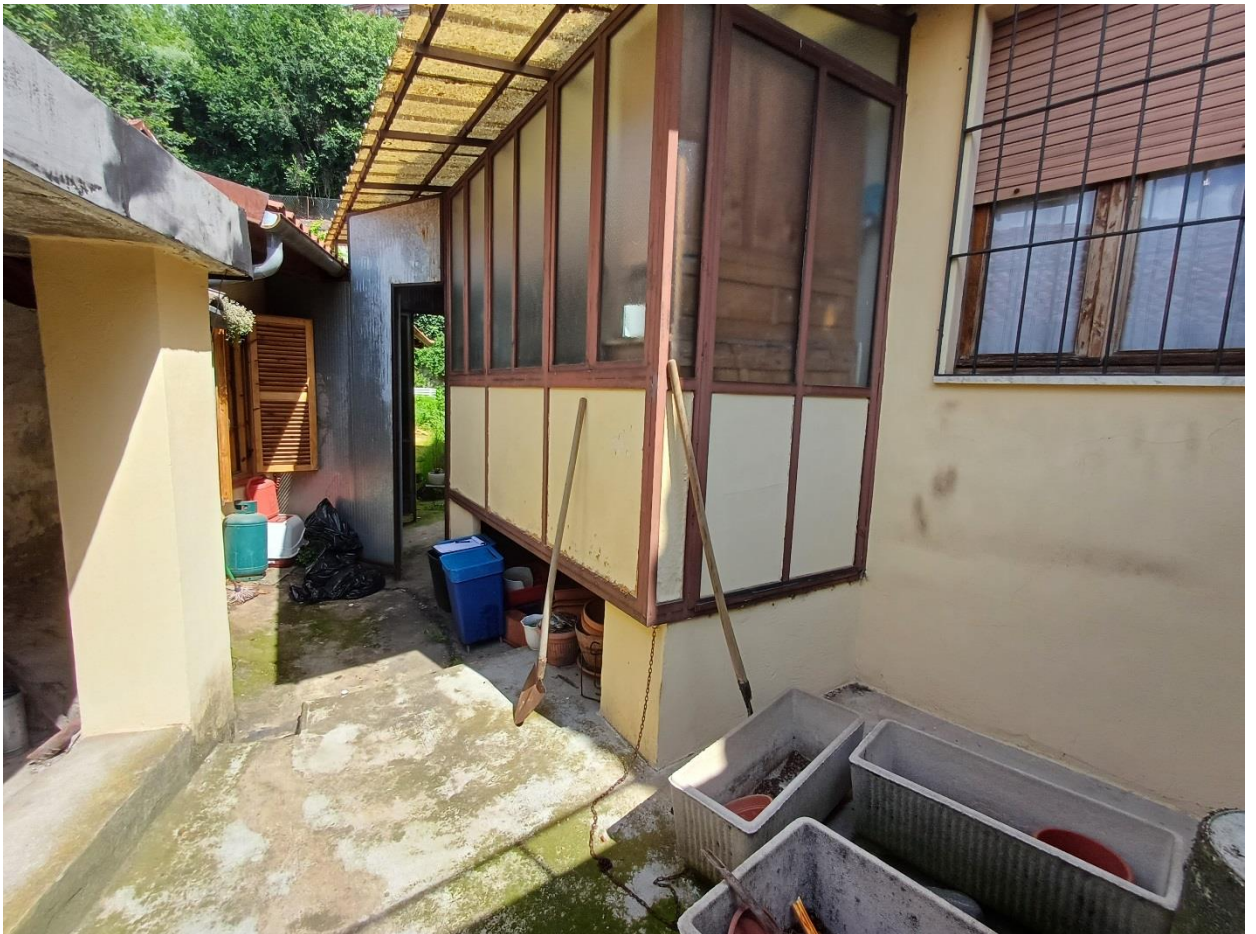
Foto 29 – Veranda di collegamento tra i due alloggi, entrambi al Fg. 7 n. 24 sub 7