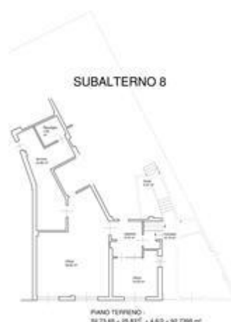
Planimetria per calcolo superfici lotto 3 Ufficio