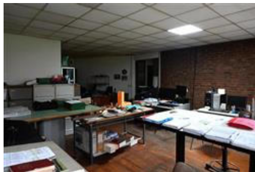
Ufficio aperto verso nord-est.