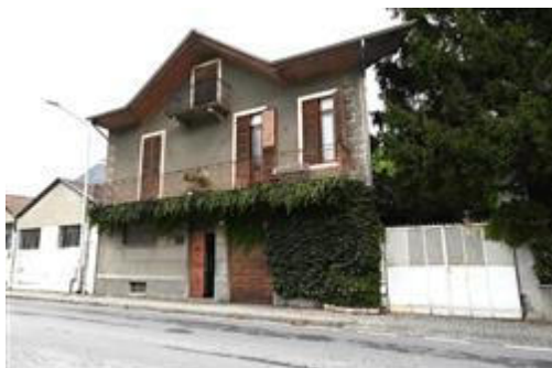
Ripresa da sud-est.

L'intero edificio sviluppa 4 piani, 3 piani fuori terra, 1 piano interrato. Immobile costruito nel 1930.