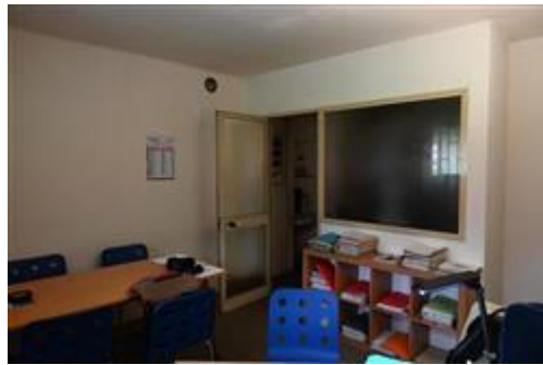
Ufficio direzionale verso nord.