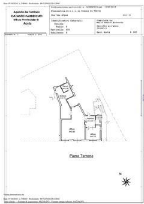
Planimetria catastale lotto 3 Ufficio Subalterno 8