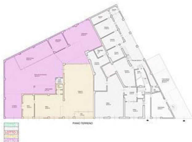
Planimetria complessiva del piano terreno con la suddivisione dei lotti