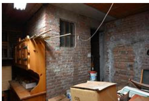
Spazio archivio non finito.