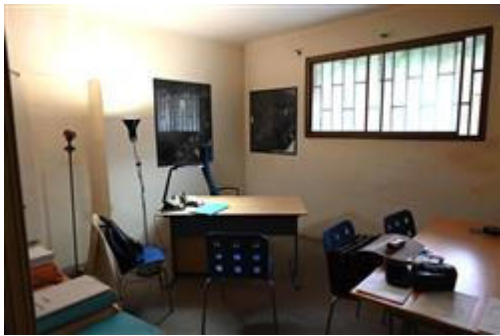
Ufficio direzionale verso sud.