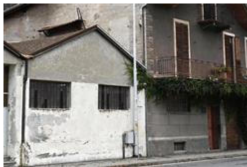
Particolare dei fronti dell'ufficio verso strada